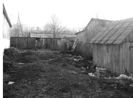
Pilskalnes pagastā, Senlejas ielā.