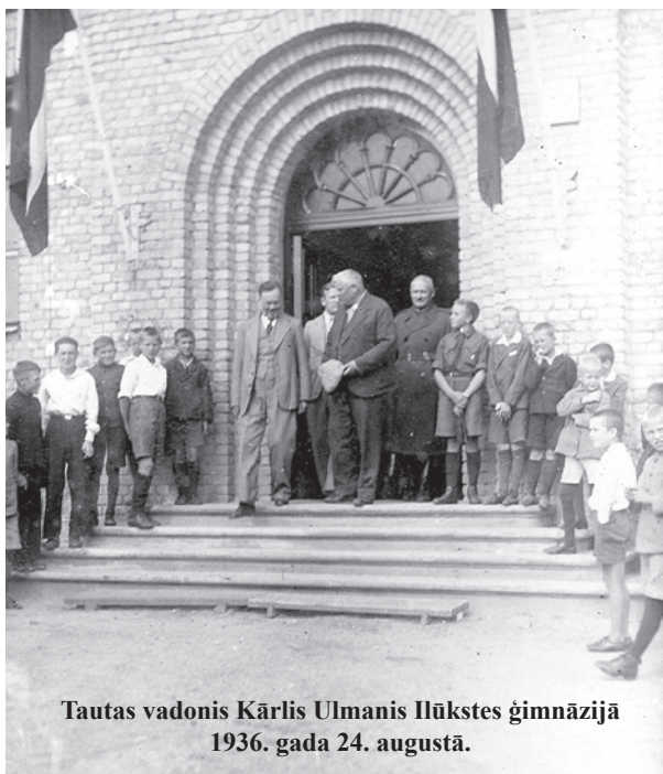
Tautas vadonis Kārlis Ulmanis Ilūkstes ģimnāzijā 1936. gada 24. augustā.

1936. gada 24. augustā prezidents Kārlis Ulmanis.