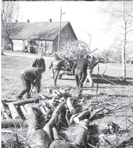
Bebrenes profesionālās vidusskolas skolotāji un darbinieki skolas apkārtnes uzkopšanas talkā.