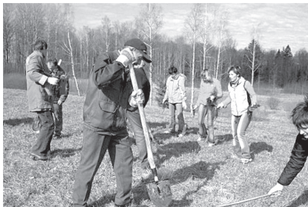
Pilskalnes pagasta pārvaldes un novada domes iestāžu darbinieki pavasara talkā Pilskalnē

14. aprīlī Pilskalnes pagasta darbinieki piedalījās uzkopšanas darbos, kas pagastā ir ikgadējā pavasara tradīcija.