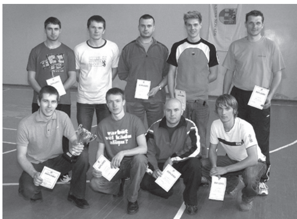
Novada kausa ieguvēji, komandas ar jautru nosaukumu “Ķiškla” dalībnieki: