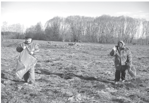
Bebrenes pagasta pārvaldes sievietes dabas parkā „Dvietes paliene” darba nebijās un savāca palu ūdeņu sanestos atkritumus ...