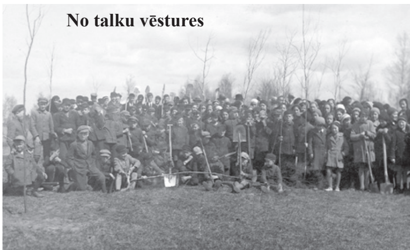
1934. gada 25. maijā Ilūkstes ģimnāzijas skolēni un skolotāji Meža un dārza dienās.