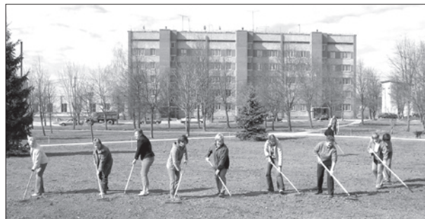
Talka Kastaņu ielas skvērā.