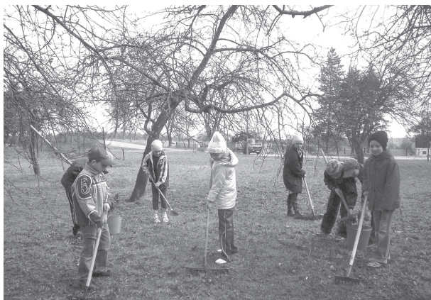
3. klašu skolēni grābj lapas.

29. martā Ilūkstes 1. vidusskolas skolēni piedalījās skolas apkārtnes sakopšanas talkā. Jaunāko klašu skolēni grāba pērnās lapas skolas ābeļdārzā. Savukārt skolas tehniskie darbinieki izzāģēja vecās ābeles un krūmus. Sakopt ābeļdārzu viņiem palīdzēja vidusskolas audzēkņi.