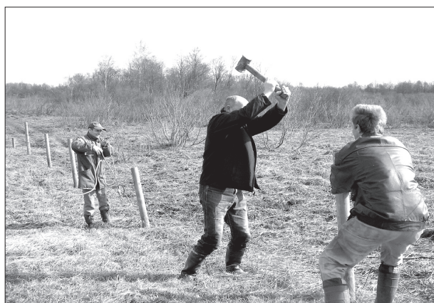
..., bet vīrieši laboja savvaļas dzīvnieku aplokus!