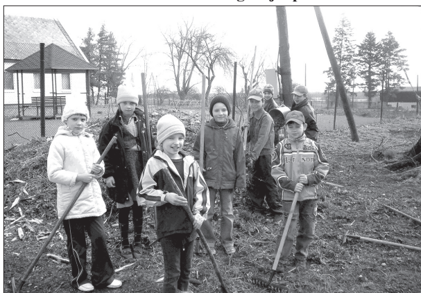
Darbs ir padarīts! Prieks par savākto lapu kaudzi...