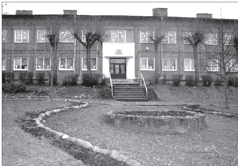
Raudas speciālā internātskola bērniem bāreņiem.