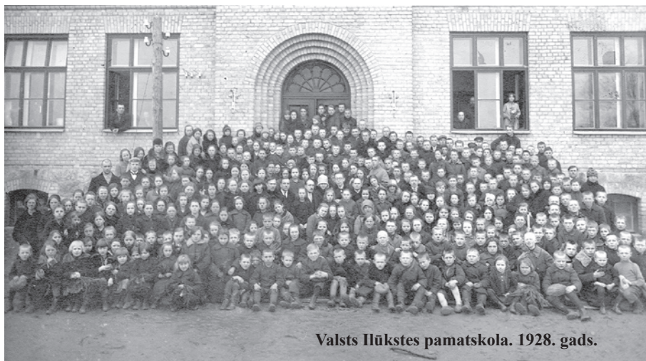
Valsts Ilūkstes pamatskola. 1928. gads.