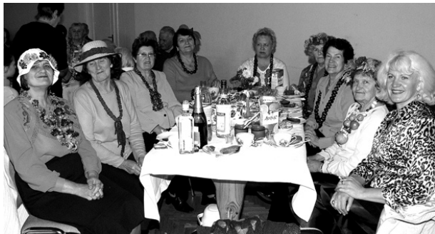
Vokālais ansamblis “Atvasara”.

Patiesu aizkustinājumu ikvienā klātesošajā kā vienmēr izraisīja bērnu darba “Zvaniņš” audzēkņi. Viņi gan dziedāja, gan