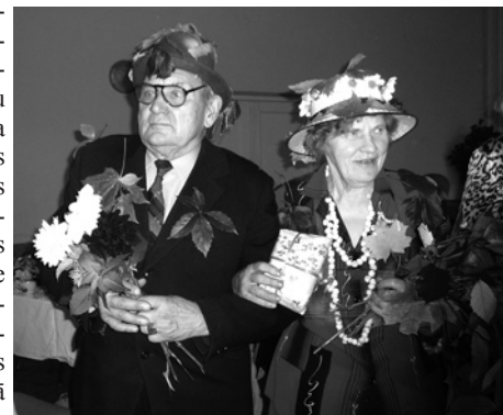
Pasākuma dalībnieki rudens rotā.

Kādā brīvākā brīdī parunājos arī ar jaunās paaudzes pārstāvjiem – meitenēm no instrumentālā ansambļa “Fox”. Par saviem