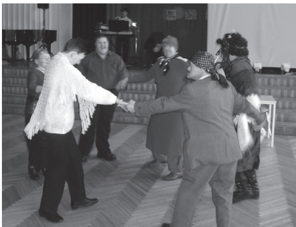
Ilūkstes dienas aprūpes centra “Fēnikss” dejotprieks.