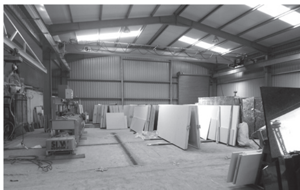
Akmens griešanas ceļā.

– Jā! Īrijas baznīcai ir mazliet citāda baznīcas vēsture, nav bijis arī tāda pārrāvuma kā mums padomju laikā. Cilvēkos ticība ir iesakņojusies jau kopš bērnības. Bet daudzas iezīmes ir tādas pašas kā pie mums – vieni meklē dziļāk, citi tikai formāli skaitās draudzes locekļi. Un pēdējā laikā no Dieva meklējumiem arvien vairāk attālinā materiālists. Es meklēju un atradu dzīvus kristiešus. Iepazinos ar katoļu lūgšanu grupu, reizi nedēļā kopīgi lūdzāmieš, slavējām, lasījām Bībeli un dalījāmies atziņās. Ļoti jauka bija arī iepazīšanās ar baptistu draudzes mācītāju un