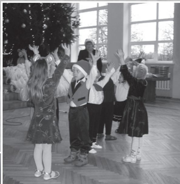
Sanākušos ar dzejoļiem, dziesmām un dejām iepriecināja arī Ilūkstes bērnu darza "Zvaniņš" audzēkņi.