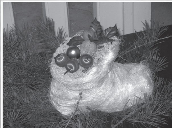
Kurš pazaudējis zābaciņu?(Bebrenes vsk.).