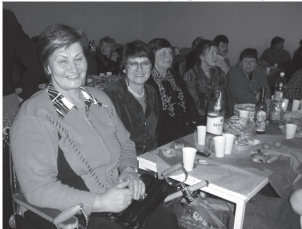
Balles dalībnieki no Eglaines.

Pasākuma ievaddaļā tika rādīti gan priekšnesumi, gan filma