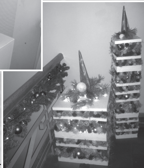
Ilūkstes novada dome.