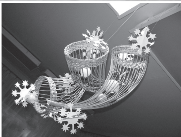
Eņģeļu taures Ilūkstes pilsētas bērnu bibliotēkā.