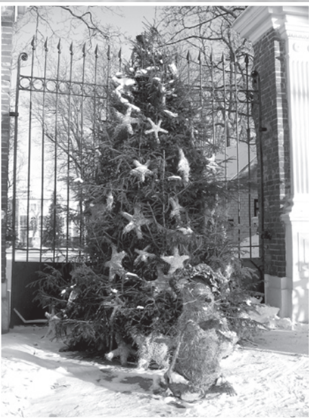
Svētku egle pie Bebrenes vidusskolas.