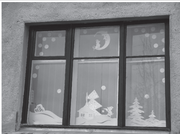
Ilūkstes bērnu un jauniešu centra logs.