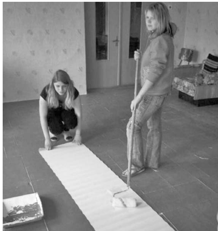
Bebrenes Profesionālās vidusskolas audzēkņi piedalās atpūtas telpas labiekārtošanā

Jau vairāk kā gadu Bebbrenes Profesionālajā vidusskolā darbojas nevalstiska organizācija „Jauniešu brīvdienų centrs”. Tās pirmsākumi rodami skolas kopienā, kuras darbība sākās pirms 5 gadiem. Sadarbībā ar Daugavpils rajona partnerību kopienas dalībnieki bija iesaistījušies vairāku projektu īstenošanā. Projekta „Vingrosim - atgūsim dzīvesprieku” rezultātā tika iegādāti trīs trenāžieri, noformētas trenāžieru un konferenču zāles dienesta viesnīcā. Jaunieši aktīvi iesaistījās arī Bebbrenes pagasta rīkotajos pasākumos un sadarbības projektos.