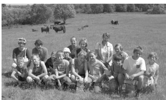
Savvaļas govju aplokā

1.jūnijā ar nelielu izrādi un atklāšanas runu Ilūkstes Bērnu un jauniešu centrā Raiņa ielā 33a darbu uzsāka bērnu vasaras interešu grupas "Zīnkārīgā vārna". Šī - pirmā diena - tika veltīta izbraucienam uz Bēbreni, lai iepazītu tās vērtības - gan cilvēku roku, gan dabas radītās. Katru dienu līdz pat 27.jūnijam ikviens bērns bez maksas tiek aicināts prasmīgu skolotāju vadībā izmēģināt