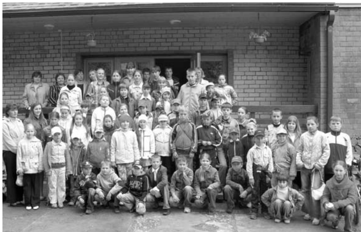
Pie atpūtas bāzes "Dubezers"