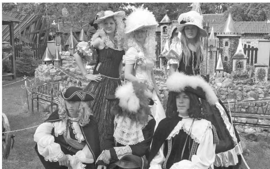
2007. g. pārsteigumi bērnu žūrijas ekspertiem. Čaklākie lasītāji no 8. klases brauca ekskursijā uz Preiļu miniatūro karaļvalsti, Aglonas bazīliku un Aglonas maizes muzeju