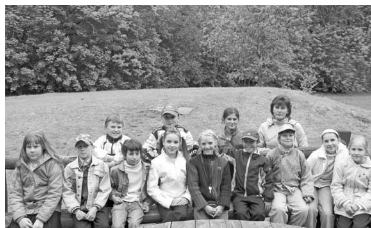
Ilūkstes 2. vidusskolas 3. klase