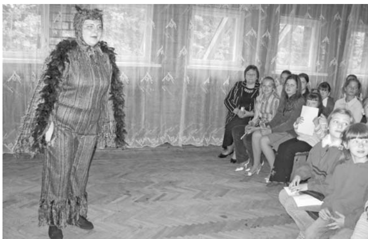
Bērnu zināšanas pārbaudīja Pūce