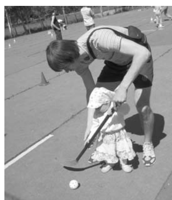
Kamēr skolēni sacentās, dažs labs cūtiņi gatavojās dalībai ģimeņu stafetēs.