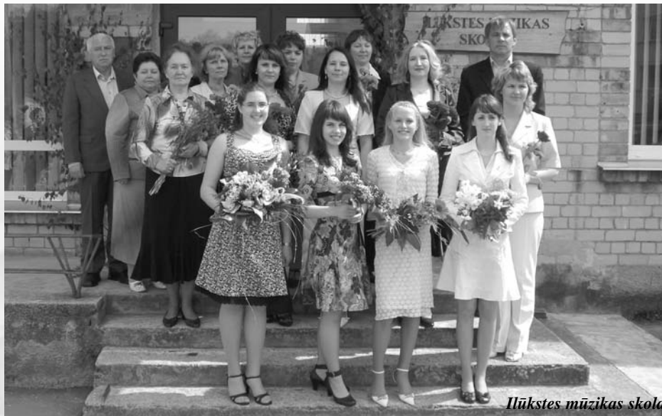
Ilūkstes mūzikas skola

31.maijā savas lielās dzīves ceļū ir aizsākuši 17 Raudas speciālās internātpamatskolas bērniem bāreņiem absolventi, kā ceļā maizi sev paņēmot direktora, skolotāju un daudzu ciemiņu laba vēļējumus. Būt drošiem un pārliecinātiem, skatoties ikdienas grūtībām acīs un nesaraut saites ar sev miļajiem - tā izskanēja viens no pēdējiem padomiem. Ar skumju asaru pilnām sirdīm, audzēkņi atvadījās no savas skolas, ko sauca par mājām un saviem skolotājiem, kuri spēja būt ne vien zināšanu devēji, bet arī atsaucīgi draugi, miļoši tēvi un mātes. Novēlam arī mēs šiem jauniešiem saudzīģu dzīves ceļū un veiksmīģu izdošanos!