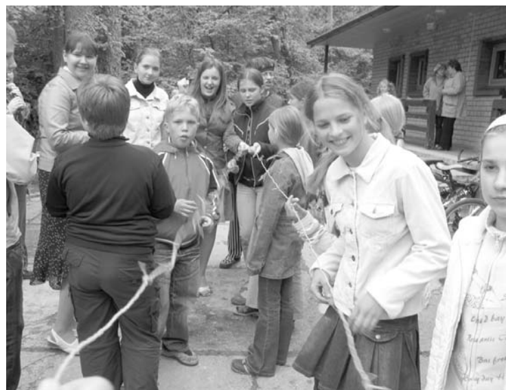
Kas gan tie būtu par svētkiem bez spēlēm un rotaļām!