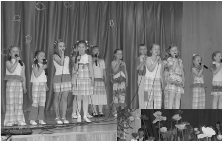
Uzstājas BJC vidējā vecuma pop-grupa

11.maijā Ilūkstes bērnu un jauniešu centra (BJC) audzēkņi ikvienu aicināja uz Mātes dienas koncertu "Cik pasaule šī skaista" Ilūkstes KC un Sēdēres KN. Pavisam koncertā piedalījās 94 BJC audzēkņi: koncertu vadīja teātra pulciņa meitenes (sk.M.Rimoviča), ar priekšnesumiem uzstājās jauniešu vokālais ansamblis (sk.D.Paukšte), pirmsskolas deju kolektīvs (sk.D.Jurjevskā), bērnu popgrupas (sk.T.Basova), instrumentālais ansamblis