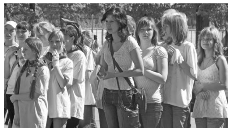
Pirmās palīdzības sacensību dalībnieki