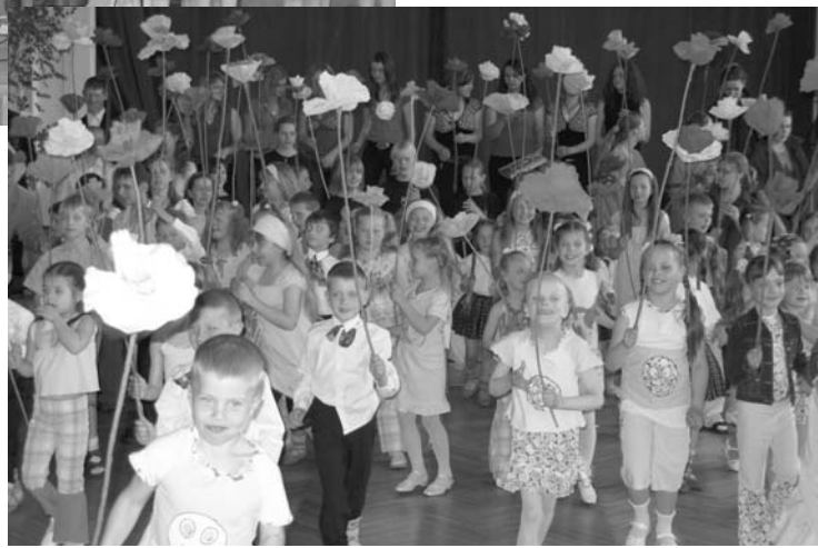
Dodamies sveikt un samīļot savas māmiņas!