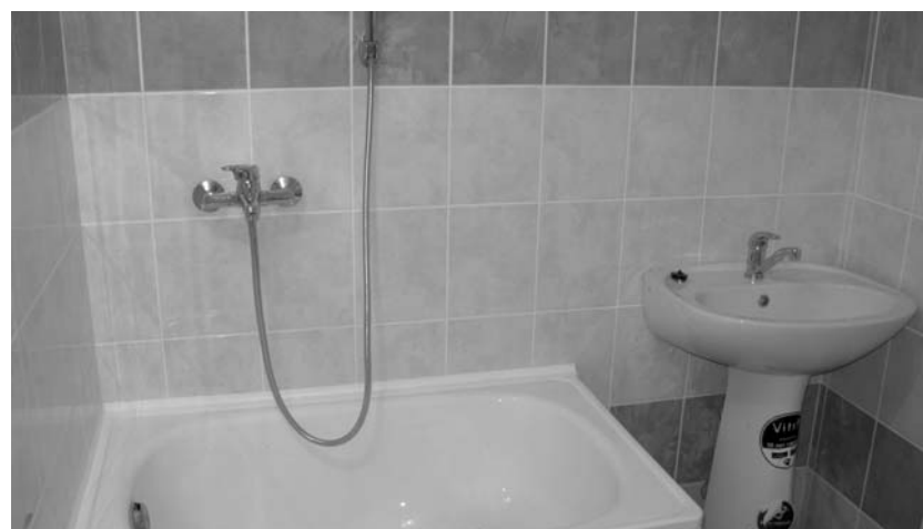
Projekta ietvaros tapusi arī ērta dušas telpa.