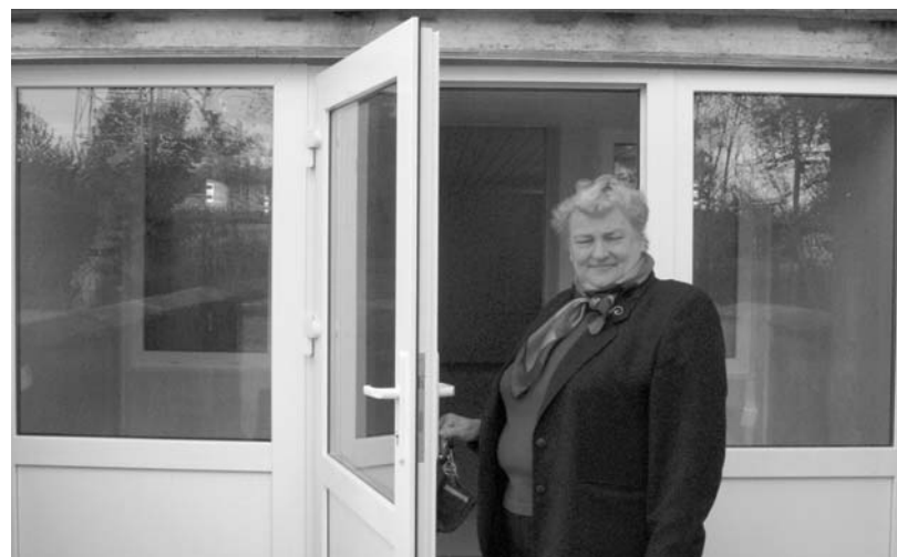
Laipni lūgti jaunajā zālē!