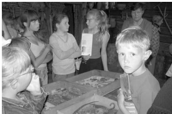
Aplūkojot Bēbrenē atrastās senlietas

roku galdniecībā, zīmēšanā, netradicionālajos rokdarbos u.c.interesantās nodarbēs. Nodarbības notiek no pl.10 līdz 14 un iesaistīties tajās var jebkurā dienā. Par Ls 1 ir iespējams paēst arī pusdienas. Pieteikšanās un sīkāka informācija pa tālr.654 62580.