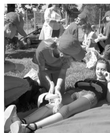
Ja ir savainota kāja, tad jārikojas tā...