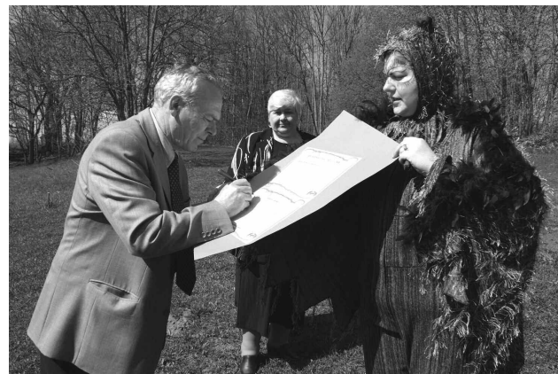
Solījuma par regulāru „Pilskalnes Siguldiņas” apmeklējšanu un rožu uzraudzšanu parakstīja visi domes deputāti