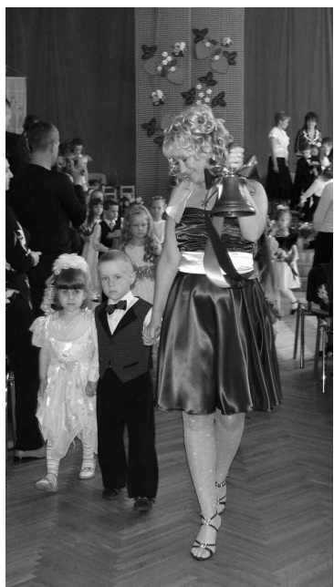
Ar zvanu ceļā uz skolu