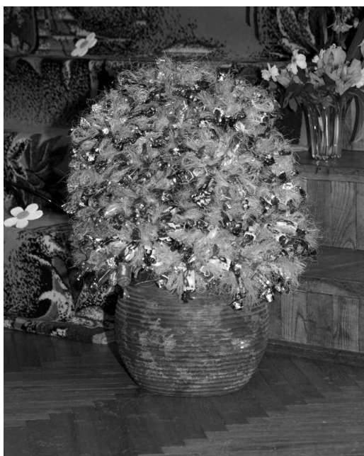
Konfekšu ziedi priecēja mazo izlaidumnieku sirdis