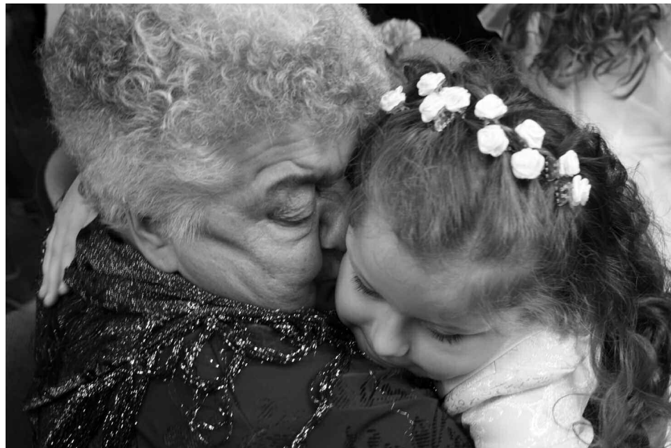
Mazo teiktais "paldies" tuviniekiem

Pasaulei nav gala, un debesīm nav malas. Īstā dzīve ir liela kā pasaule un augsta kā debesis.