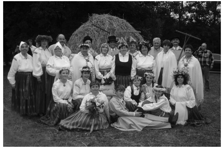
„Paša siena laikā” Višķos

Dziedu - tātad dzīvoju!!! Ar šādu moto Lašu kora dziedātāji, 15 spraiģa darba gados, ir piedalījušies daudzos un dažādos kora sadziedāšanās svētkos gan sava rajona un novada robežās, gan arī citos Latvijas novados un pilsētās (Viļānos, Balvos, Aglonā, Limbažos, Gaujienā, Ērgļos, Secē,