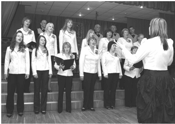
Lašu kori sveic Sēlpils pagasta jauktais koris.