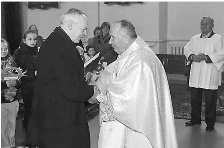
Ilūkstes novada pašvaldības domes priekšsēdētājs Stefans Rāzna