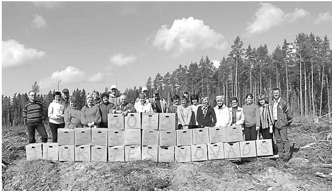
Kārtīgam latvietim dzīves laikā ir jāiestāda vismaz viens koks, un kāpēc lai tas nenotiktu AS „Latvijas valsts meži” apsaimniekotajās platībās aktīvi tur-

pinās meža atjaunošanas darbi. Arī Ilūkstes novada domes deputāti un darbinieki, sadarbojoties ar AS „Latvijas valsts meži” Dienvidlatgales mežsaimniecības 4. Aknīstes meža iecirkni, piedalījās Latvijas valsts mežu atjaunošanā.