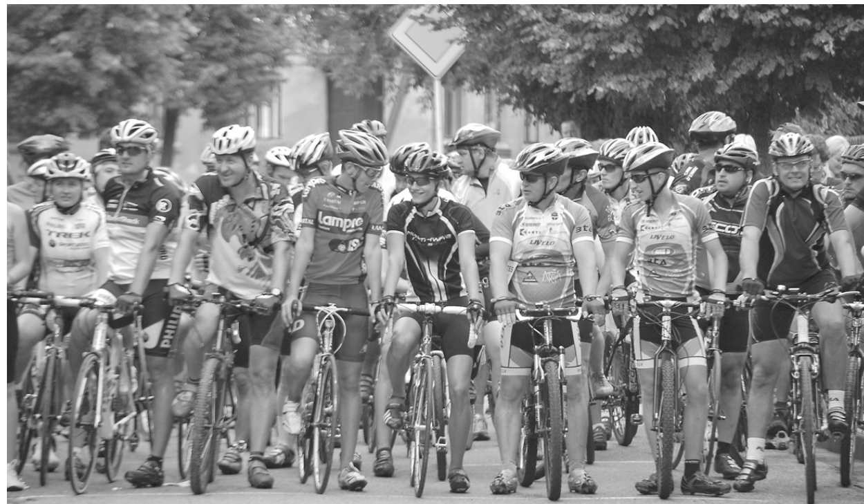
Ilūkstes novada 7. velomaratona starts.

Ilūkstes novada pašvaldības izglītības, kultūras un sporta nodaļa