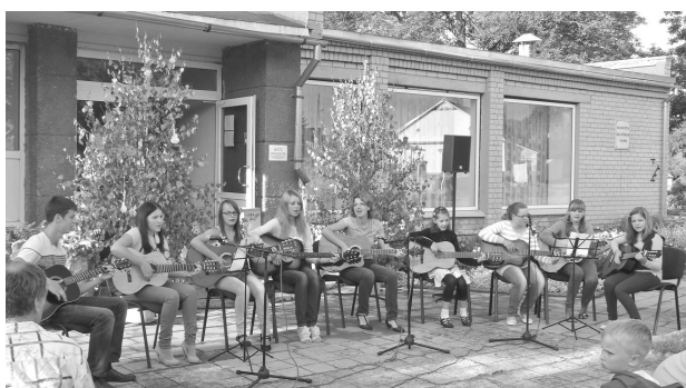
Muzicē ģitārspēles ansamblis un pulciņa dalībnieki

17. augustā Ilūkstes novada svētku ietvaros Subatē notika tradicionālais ģitāristu kopasānākšanas pasākums. Saiets bija gan ģitārspēlētāju tikšanās, gan atskaitē par padarīto, gan arī jauno talantu pirmā publiskās uzstāšanās reize.