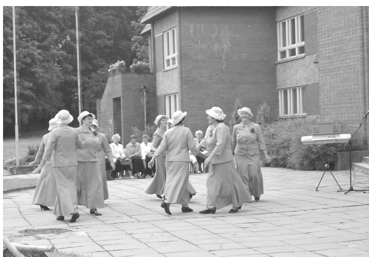
Bebreņē dejojāšo senioru grupa „Rudzupuķes”

Katrs senioru kolektīvs, kurš svētku dalībniekus priecēja ar