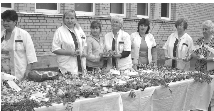
Seniores gandarītas par paveikto darbu

Dažādi projekta „Mūža atvasara” pasākumi Ilūkstes novadā notiek arī vasarā – nodarbības brīvā dabā, radošās darbnīcas un puķu kopšana grozos pilsētas pievārtē, kā arī dobē „Novada karte ziedos”.