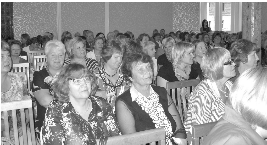
Novada pedagogu kuplā saime