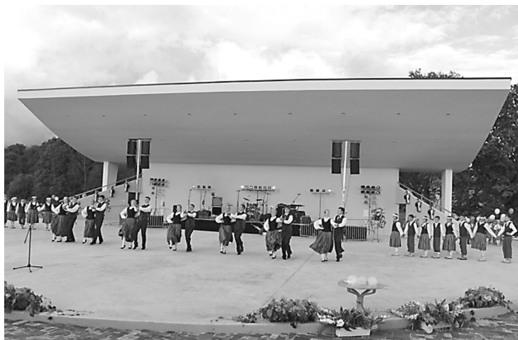
Ilūkstes novada jaunā estrāde

Un tomēr, neraugoties uz draudīgajiem lietus mākoņiem, 10. augustā simtiem cilvēku pulcējās Ilūkstē, lai pirmie ieraudzītu vietu, kur vasarās noteikti skanēs lustīgas dziesmas, ritēs raitie deju soļi, kur amatierēatri varēs piecēt ar savu aktiermāk-