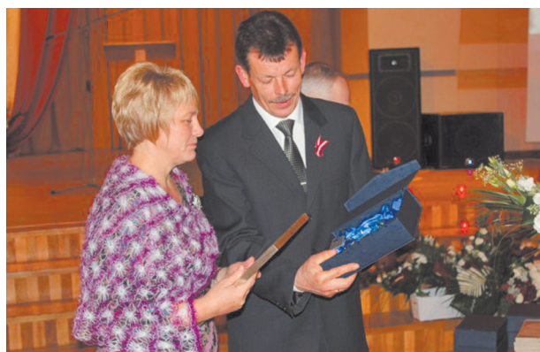
Ilūkstes novadpētniecības muzeja rokdarbu vadītāja