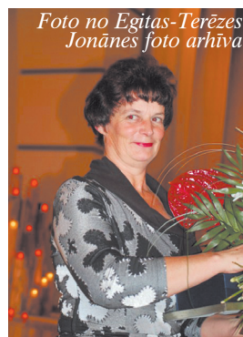
Eglaines pagasta pārvaldes lietvede - sekretāre