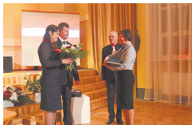
Ilūkstes 1. Vidusskolas matemātikas skolotāja