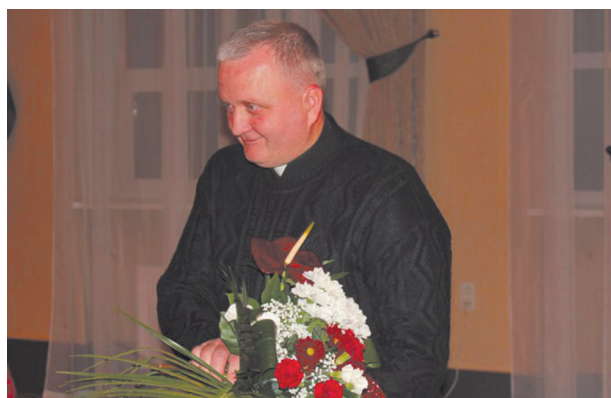
Dvietes Romas katoļu draudzes prāvests