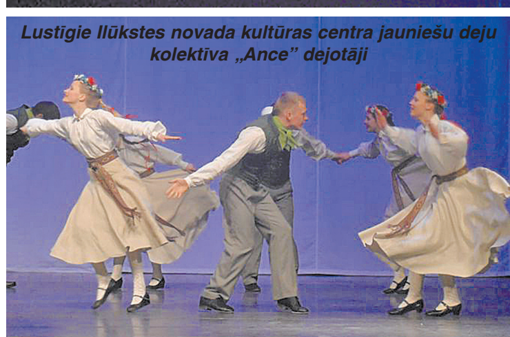
Lustīgie Ilūkstes novada kultūras centra jauniešu deju kolektīva „Ance” dejotāji