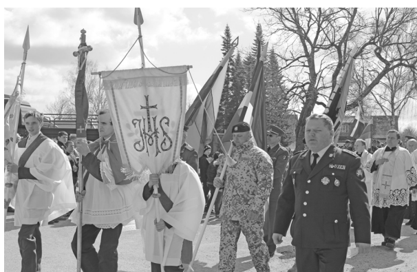
Svinīgais gājiens uz piemiņas vietu