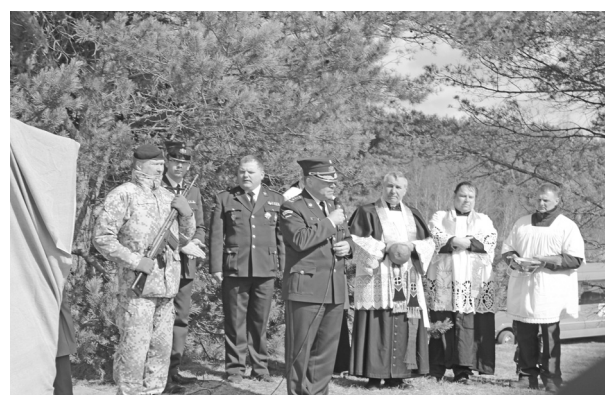
Klātesošos uzrunā LR NBS komandieris ģenerālleitnants Raimonds Graube