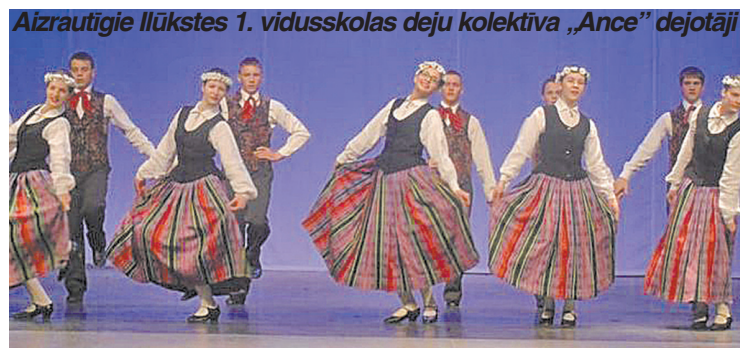
Aizrautīgie Ilūkstes 1. vidusskolas deju kolektīva „Ance” dejotāji

Ilūkstes novada kultūras centra darbinieki