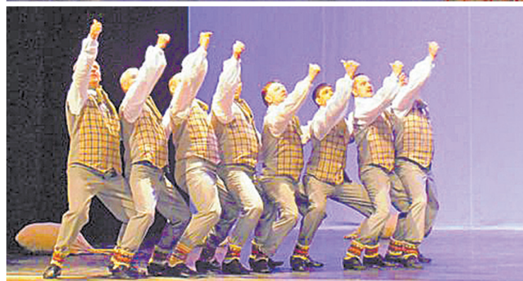
Spēcīgie Pilskalnes pagasta vidējās paaudzes deju kolektīva vīri