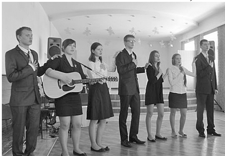
Ilūkstes 1. vidusskolas 10. klases komanda