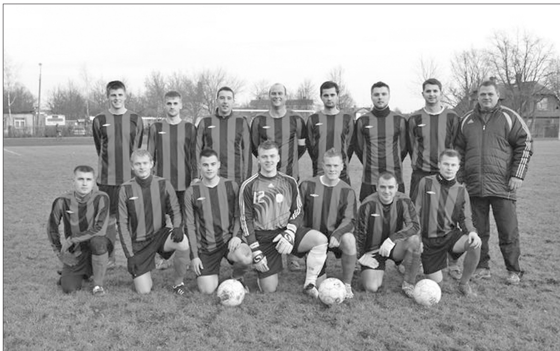
Ilūkstes novada sporta skolas futbola komanda, kas izcīnīja ceļazīmi uz Virslīgu

Komanda, salīdzinot ar 1. līgas sastāvu, ir pavisam cita, ir daudz jaunpieņācēju. Ziemas kausa izcīņā „Ilūkstes NSS” nebija no veiksmīgākajām (1:0 pret „Jūrmalu”, 2:8 pret „Ventspili”, 0:3 pret Daugavpils „Daugavu”, 2:5 pret „Jelgavu”, 0:4 pret „Liepājas metalurgu”), taču komandas cīņas sparū tas nema-