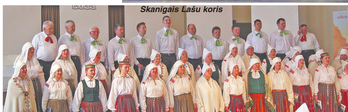
Skanīgais Lašu koris