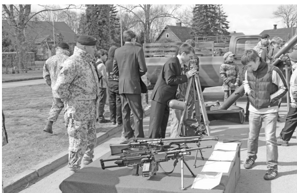
Skolēni aplūko zemessardzes ieročus un ekipējumu

kalti plāksnē, tie vienalga ir zināmi debesīs, jo labie darbi nepaliek neatdarīti...”