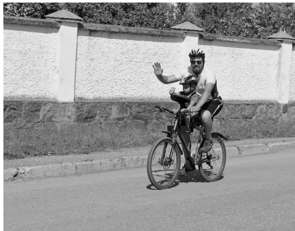
Velomaratons - svētki visai ģimenei