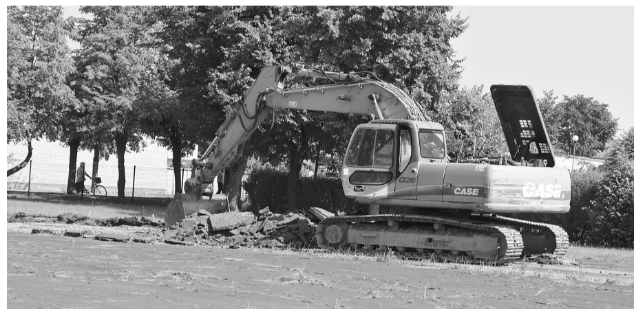
Uzsākti darbi Ilūkstes stadionā

bija 1,1MW, kura ar siltumu nodrošināja Bebrenes Profesionālo vidusskolu, dienesta viesnīcu, skolas mācību korpusu, ēdnīcas - sporta zāles telpas. 2011.gadā tika realizēts projekts, kura rezultātā tika nomainītas siltumtrases 264,21 m garumā. Bet šogad, veiksmīgi realizējot būvprojektu „Katlu mājas” „Bebrenes tehnikums” siltumenerģijas ražošanas efektivitātes paaugstināšana” Bebreņē, blakus esošajai, tika izveidota jauna katlu māja, kas ir aprīkota ar modernām un efektīvām iekārtām, tādā veidā