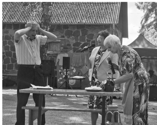
Pasmieties par sevi un dzīvi ļāva Dvietes senioru kopas „Saulespuķes” amatiereteātra uzvedums