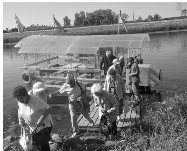
Novada seniori visa gada garumā ir ārkārtīgi aktīvi, ne vien radoši izpaužoties, bet arī dodoties kopīgos izbraucienos. 4.augustā Dvietes seniori posās uz ekskursiju, lai iepazītos ar kaimiņu novadu