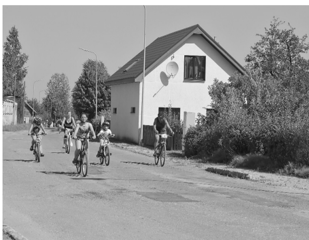
Velomaratona ietvaros notika Sēlijas novadu riteņbraukšanas komandu sacensības, kurās piedalījās 4 komandas - trīs no Ilūkstes novada un Aknīstes - Viesītes apvienotā komanda. Visas godalgotās trīs vietas ieguva Ilūkstes komandas