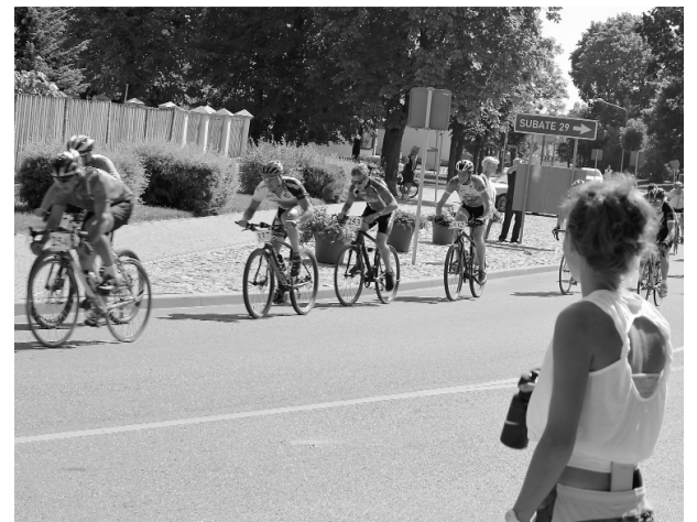
Šogad dažādās vecuma grupās velomaratonā piedalījās 151 dalībnieks