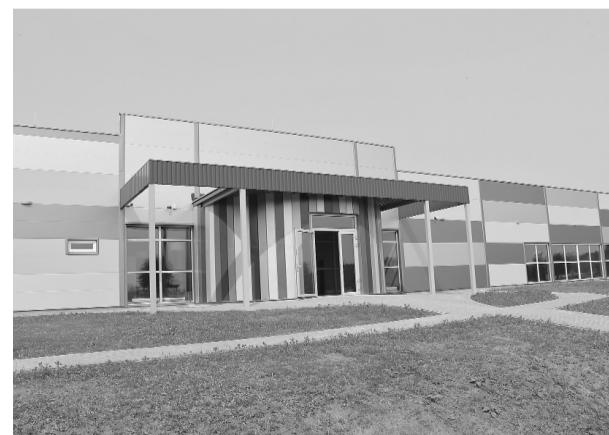
Septembrī durvis vērs vaļā jaunais Ilūkstes sporta skolas sporta centrs

Izglītības, kultūras un sporta nodaļas vad.p.i.