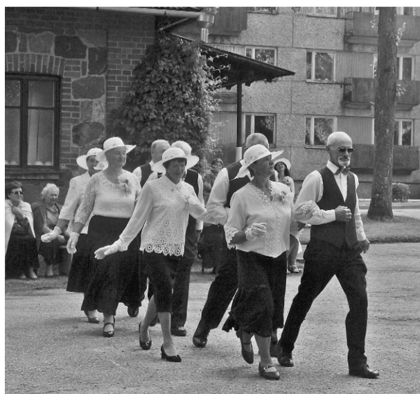
Šēderes kultūras nama plašajā pagalmā, visus sanākušos priecēja Ilūkstes vecākās paaudzes deju kolektīvs