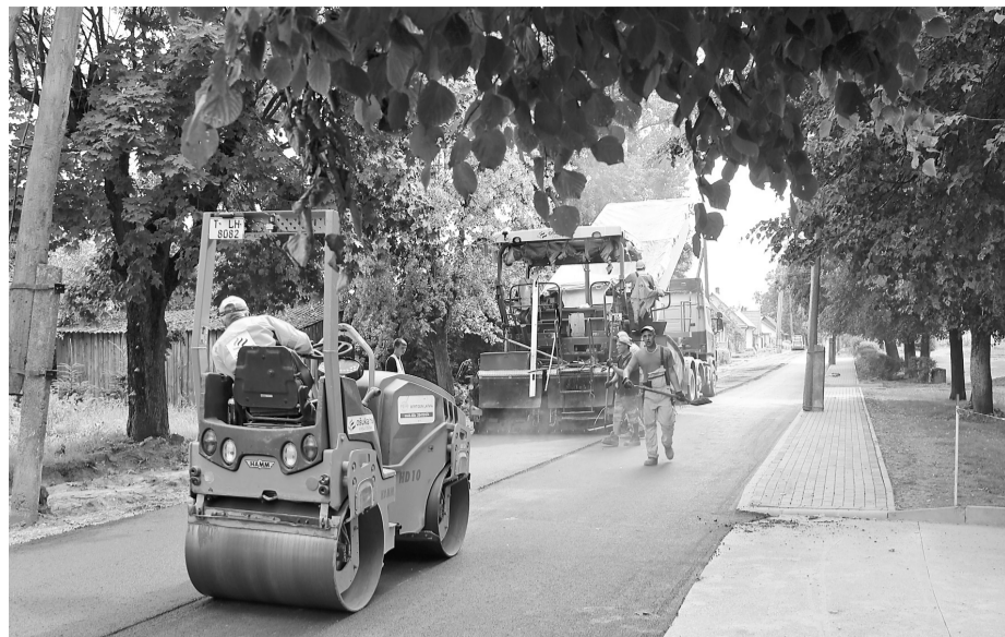
Ir uzsākti Mazās Smilšu ielas un Ozolu ielas seguma atjaunošana