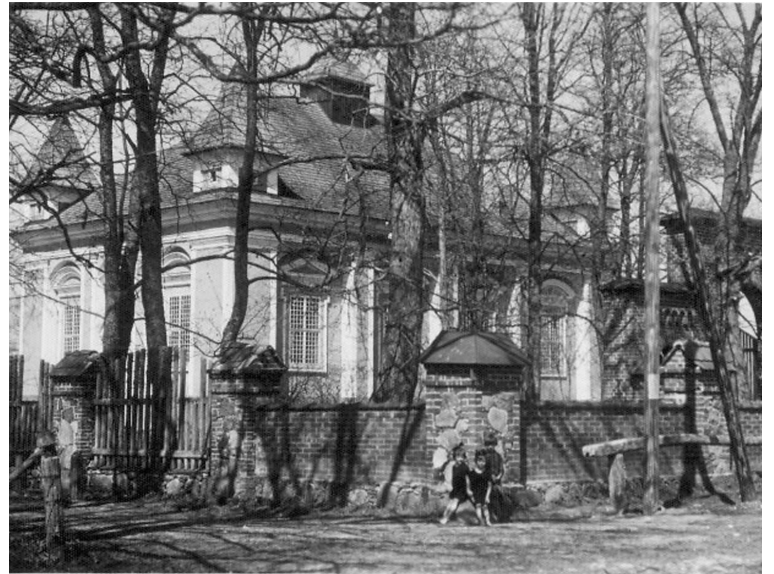
Vienīgā baznīca Latvijā ar pieciem tornīšiem

Gothards Frīdrihs Stenders (Vecais Stenders), kurš pirmmācību ieguva Subates skolā. Viņš ir aizsācis latviešu laicīgās literatūras tradīcijas, sarakstījis pirmo populārzinātnisko grāmatu latviešu valodā, kas faktiski ir pirmā zemniekiem domātā enciklopēdija Eiropā. 1989.g. G.F. Stendera 275 gadu jubilejas gadā atklāts Stendera muzejs.