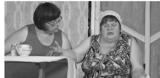
Regīna aktīvi darbojas arī dramatiskajā kolektīvā, sakot: „Pašdarbnieki - tie ir savi cilvēki, kas mēģina padarīt dienu krāsaināku. Visi grib svētkus, bet kādam ir jāstrādā...”

Priecātos, ja uz šejieni atnāktu cilvēks, kas nav iesācējs, lai spēj ienest svaigas vēsmas, lai prot