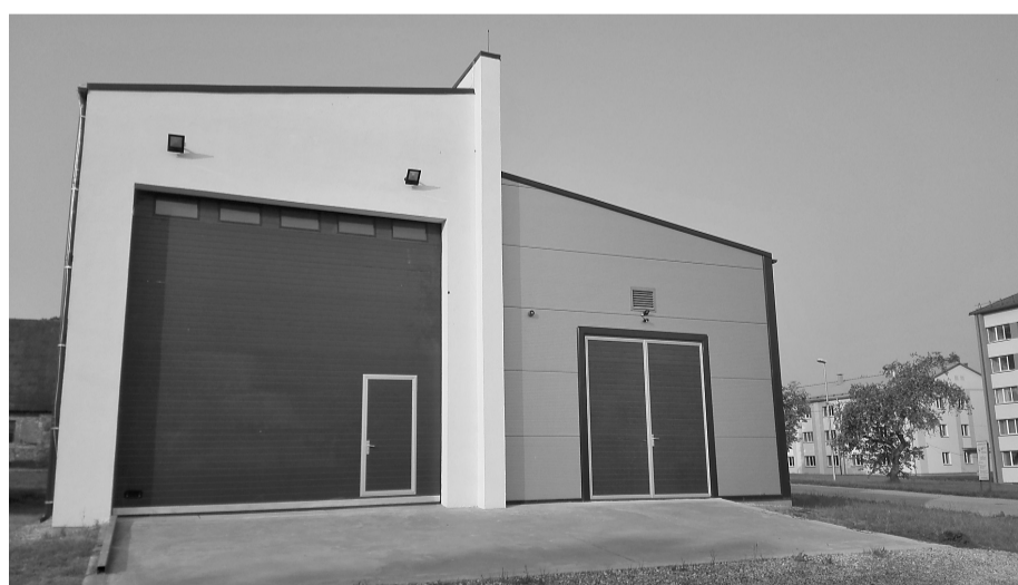
14. jūlijā ekspluatācijā tika pieņemta jaunā katlu māja „Bebrenes tehnikums”