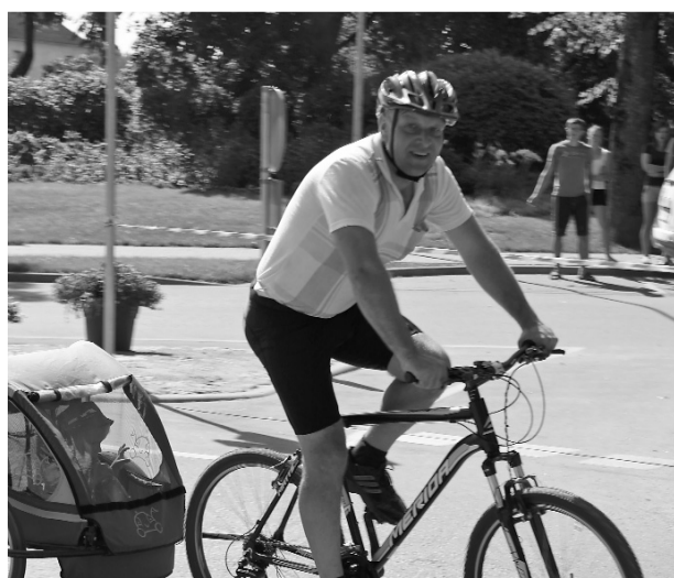
Spotiskais gars gan lieliem, gan maziem. Jaunākajam dalībniekam 2 gadi, vecākajam 70.