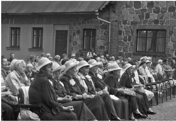
Senioru kolektīvi pulcējās kuplā skaitā ikgadējā Ilūkstes novada senioru saietā