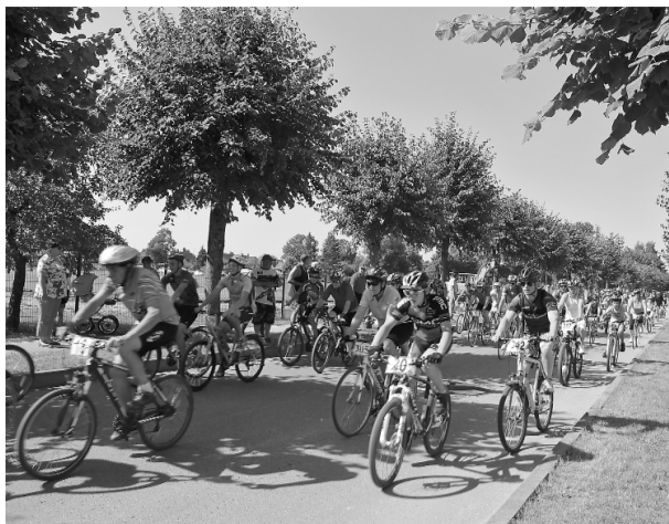
Distances garums - viens aplis 10,5 km, divi apli 20,6 km, 3 apli 30,7 km