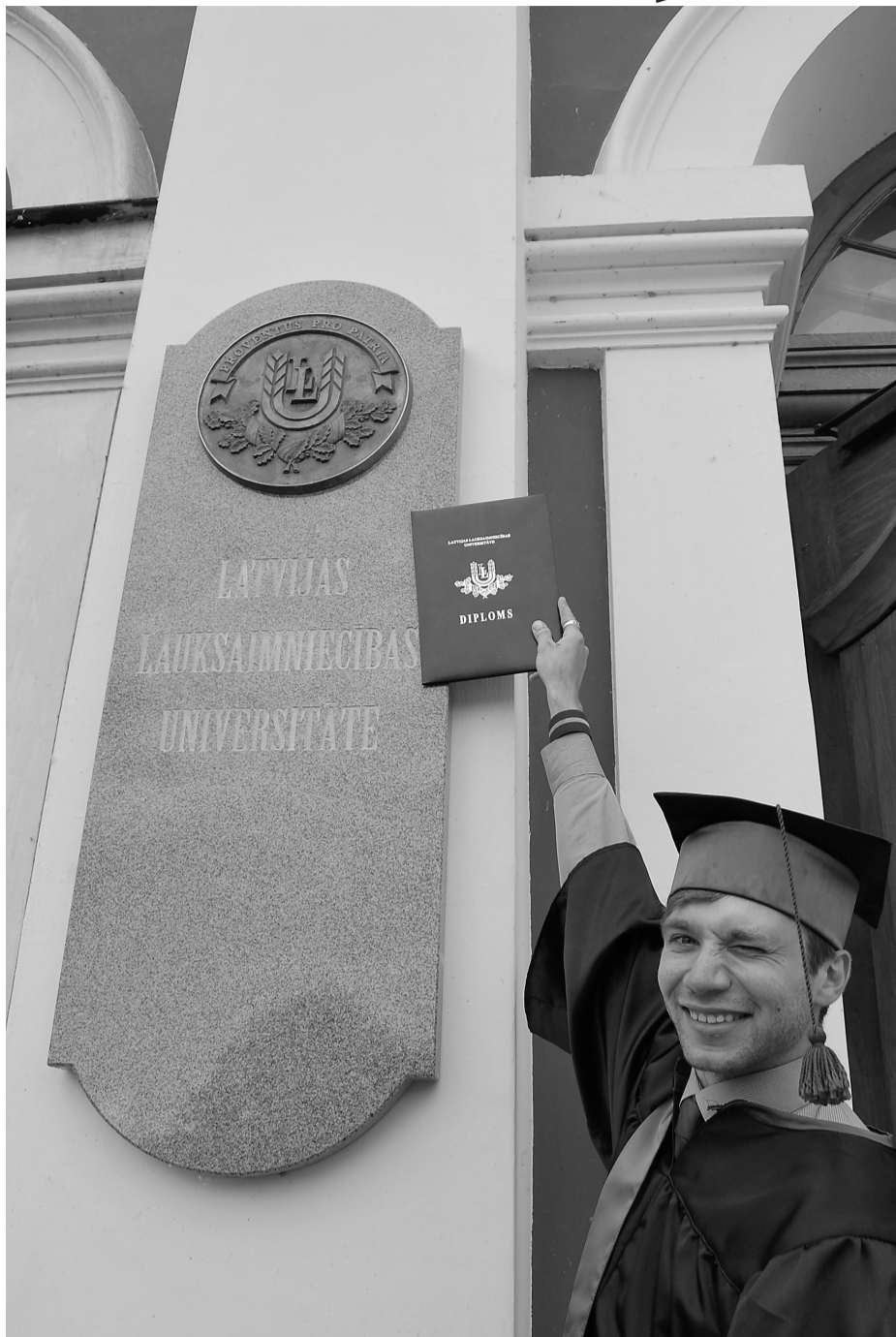
Paulis šī gada izlaidumā, absolvējot LLU

Neuzskatu, ka skolotājiem ir tik liela nozīme, lai ietekmētu jauniešu nākotnes izvēles. Bet redzesloka paplašināšanai gan. Skolotāja vissvarīgākais uzdevums, manuprāt, ir domāt vispusīgi un spēt paplašināt bērnu redzesloku. Vienmēr ciešāks kontakts ir ar skolotājiem, kuru stāstītais izraisa interesi, man par piemēru tā bija bioloģija, valodas gan nepati-