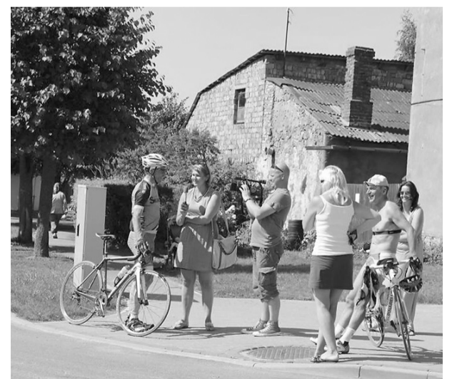
Sīkāku informāciju par uzvarētāju rezultātiem var apskatīt Ilūkstes novada pašvaldības mājaslapā www.ilukste.lv sadaļā Sports-Sporta pasākumi-Velomaratons. Kā arī novada mājas lapā un sociālajos tīklos ( www.facebook.com/pages/Turisms-Ilukstes-novada ) ir iespējams aplūkot plašu foto galeriju.