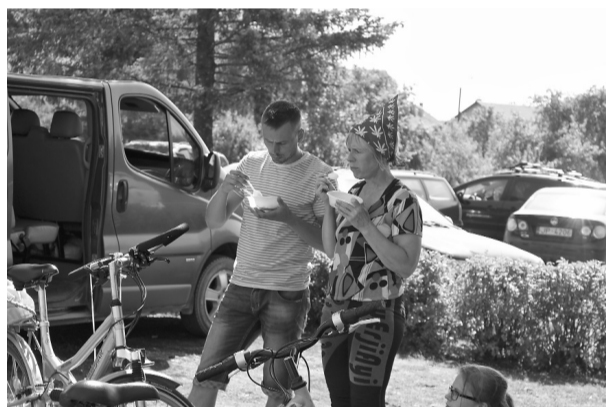
Pēc velomaratona visus dalībniekus cienāja ar spēcinošu putru un atvēsinošu dzērienu, par ko jāsaka mīļš paldies Bērenes vispārējās un profesionālās vidusskolas administrācijai un darbiniekiem. Kā arī pateicamies sacensību sponsoram -SIA Sporta punkts