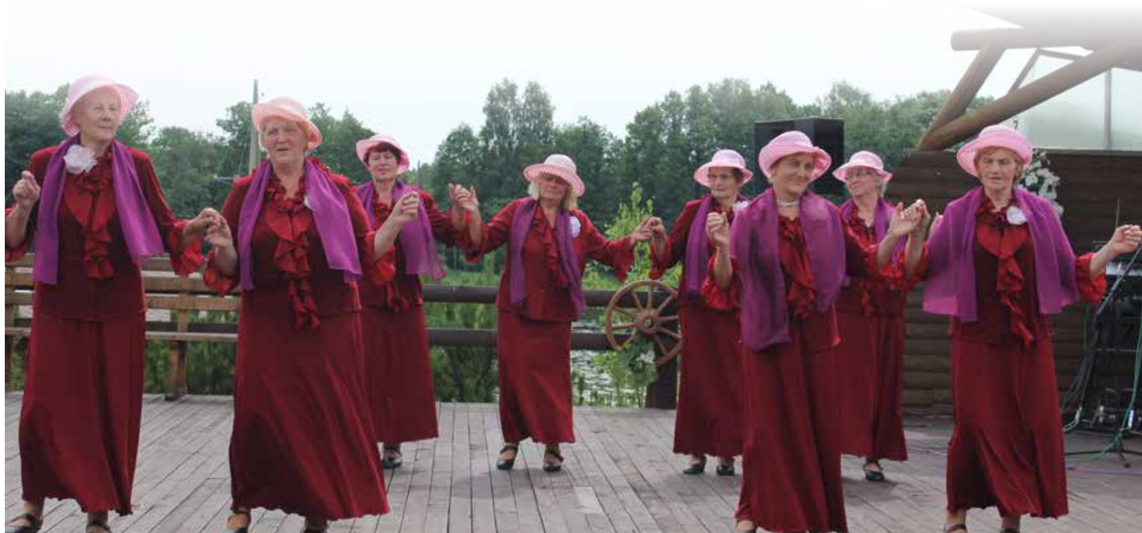
„Rudzupuķes” – kopā nodejoti nu jau 9 gadi, apgūtas vairāk nekā 40 dejas