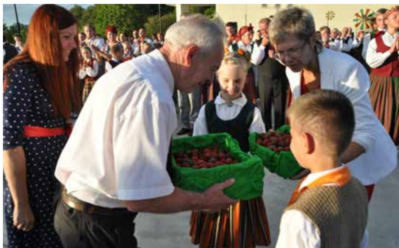
Suminājām deju kolektīvus