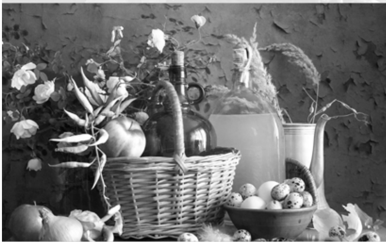
Tirgotāju ievēribai: jānodrošina visas likumdošanā paredzētās prasības!