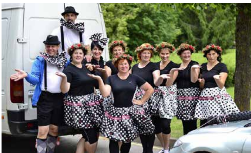
Uzvaras laurus plūca komanda “Drīms”, kuru pārstāvēja Pilskalnes vidējās paaudzes deju kolektīvs