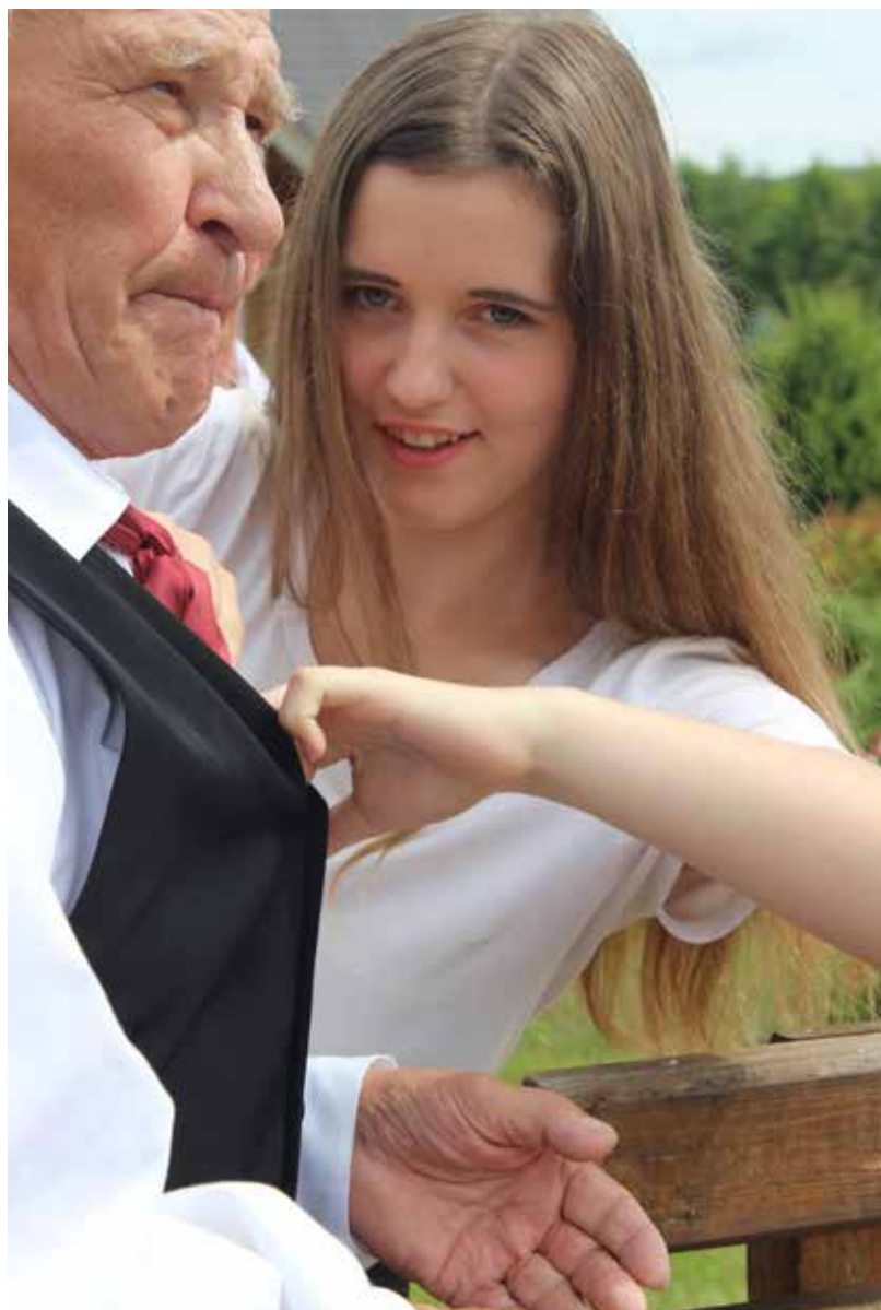
Diena pavadīta ģimentiskā gaisotnē