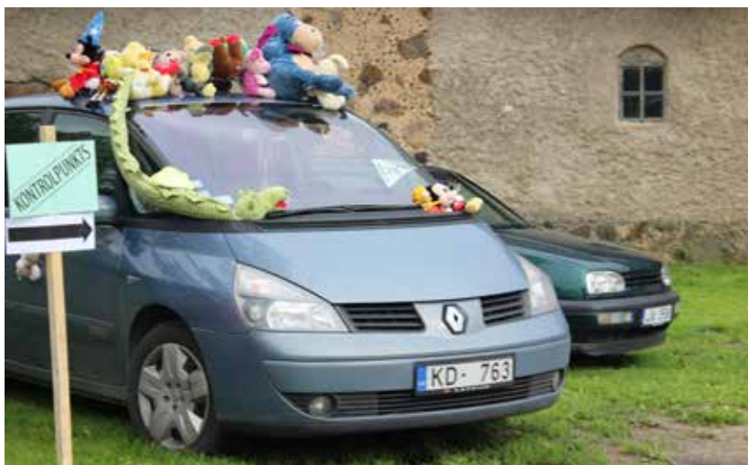
Maršrutā bija iekļauti 14 kontrolpunkti