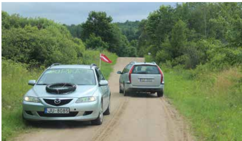
Pirmajā Tūrisma rallijā Ilūkstes novadā dalību ņēma 41 ekipāža