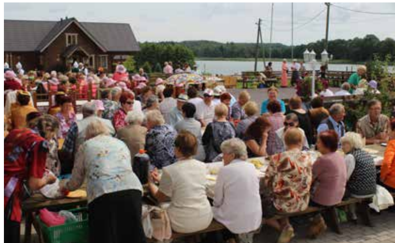
Ilūkstes novada senioru saiets notika jau septīto reizi, šoreiz visus pulcinot Eglaines pagasta atpūtas bāzē „Saliņas”