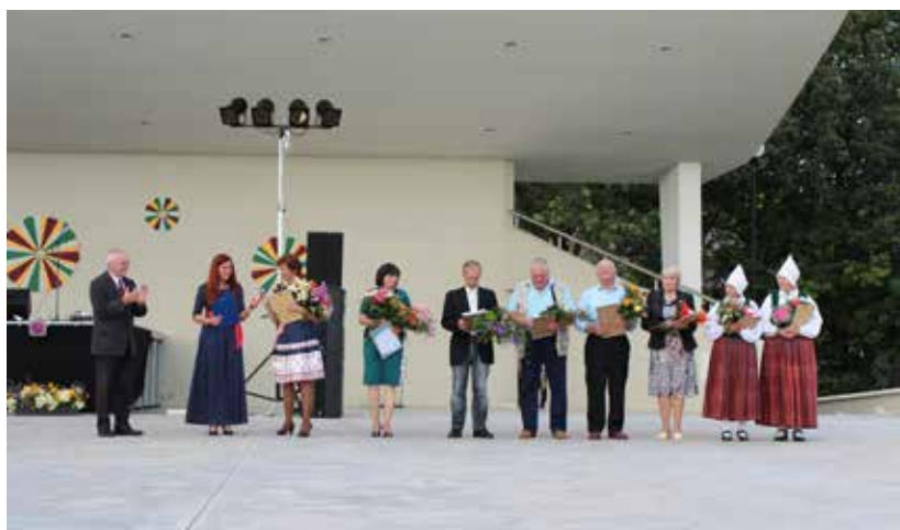
Tika pirmatskaņota jaunā novada himna un sveikti visu konkursam pieteikto dziesmu autori