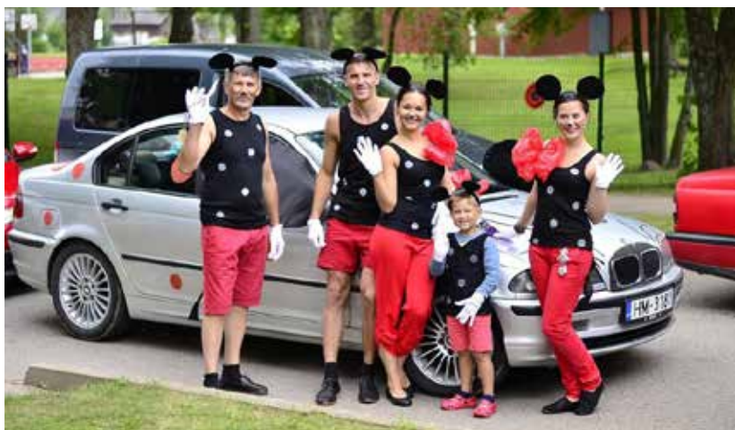
Tika izvēlētas arī radošākās un interesantākās komandas noformējuma ziņā – gan auto, gan pašu dalībnieku stils