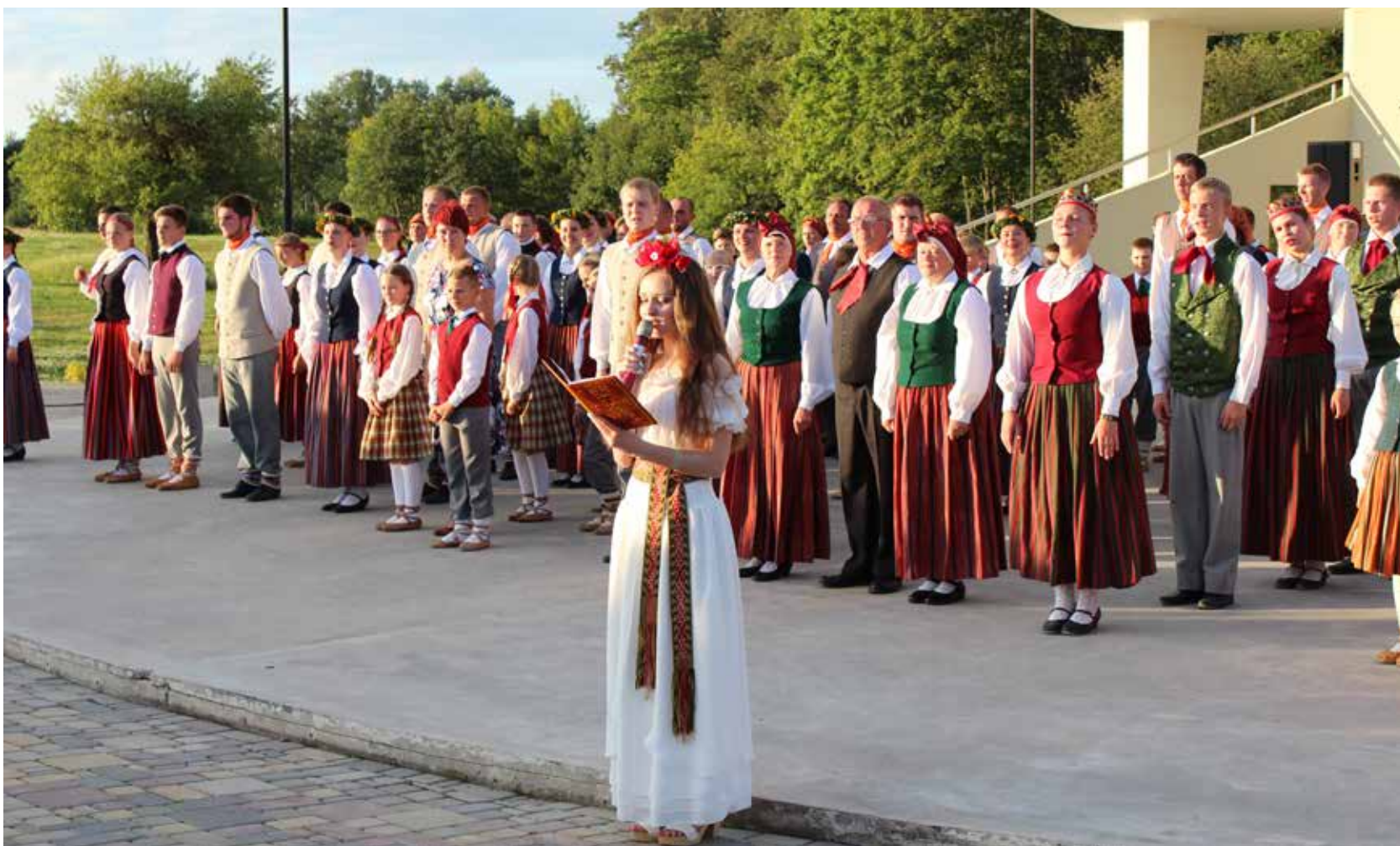
Svētku kulmināciju piedzīvojām 16.jūlija vakarā, tautas deju lielkoncertā „Paaudzes satiekas dejās”