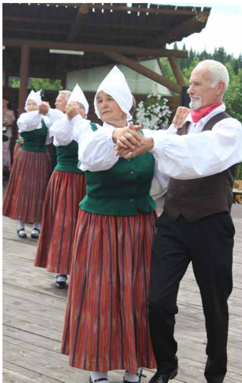
„Ozolzīles” – mūsu novada pats jaunākais senioru kolektīvs, izveidojies Sarkanā Krusta projekta ietvaros 2014.gadā