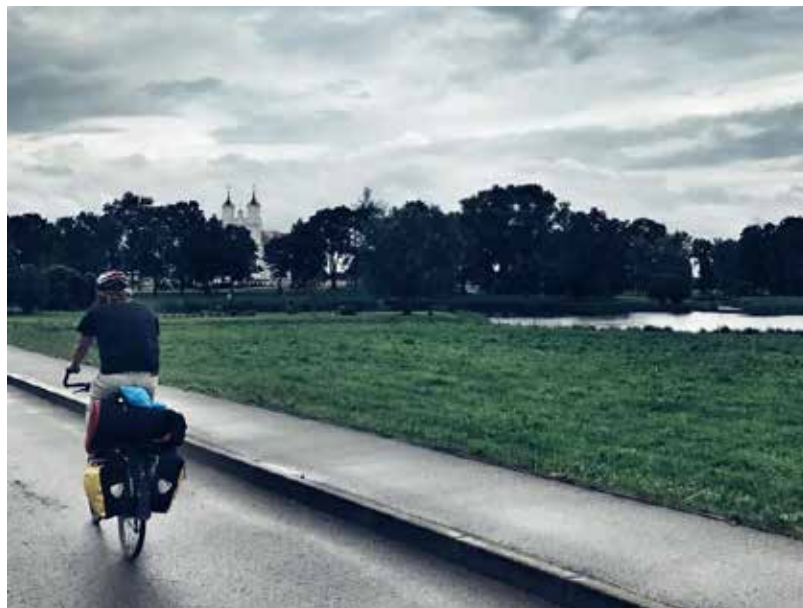
“Šovakar satiekam vakaru Dvietē”