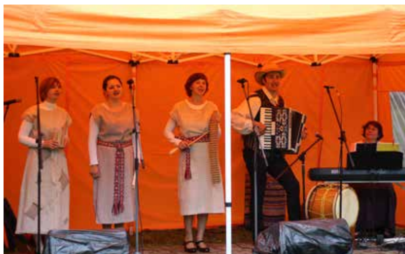
Novadu dižošanās, uzstājas vokālais ansamblis “Sonāte”