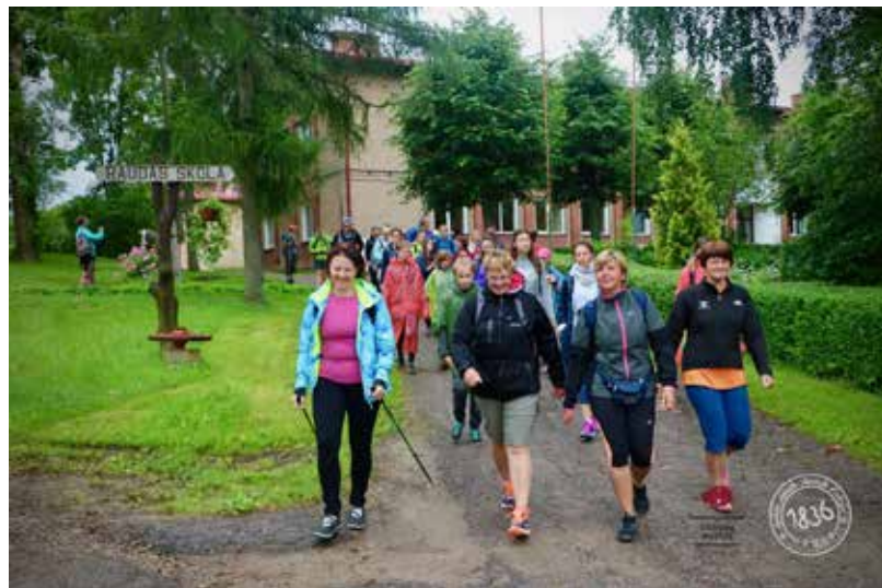
Leišmalītes posms ir 571 km garš un tā gājienu organizē Imanta Ziedoņa muzejs, fonds "1836" sadarbībā ar pašvaldībām

Papildus informācija mājaslapā www.1836.lv