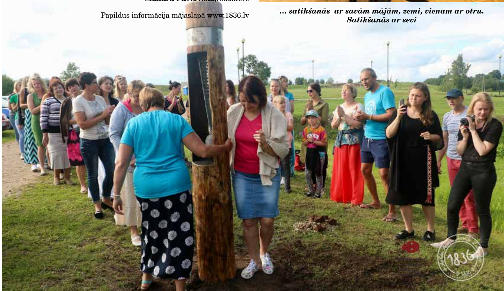
Mēs esam stipri savā saderībā un drīkstam saderību sagaidīt arī no pārējiem, no ļaudīm. Taču vispirms ir jāsader sevī un savos vistuvākajos cilvēkos. /I. Ziedonis/