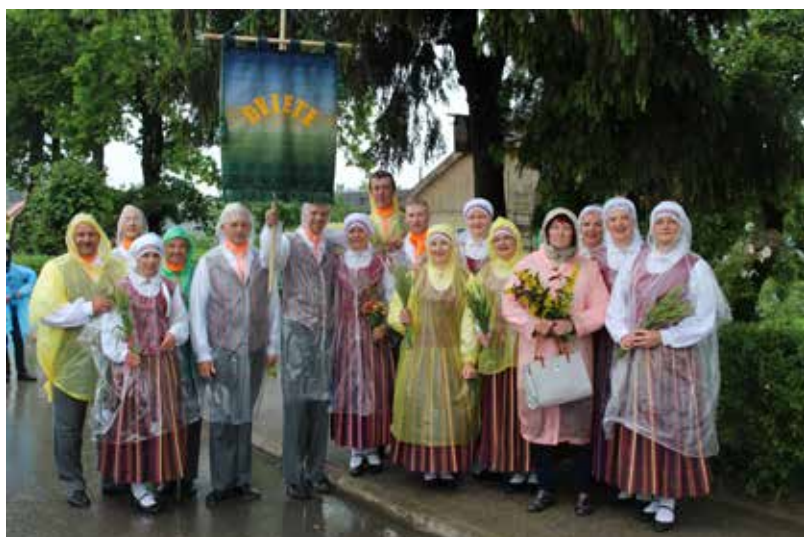
Dvietes vidējās paaudzes deju kolektīvs