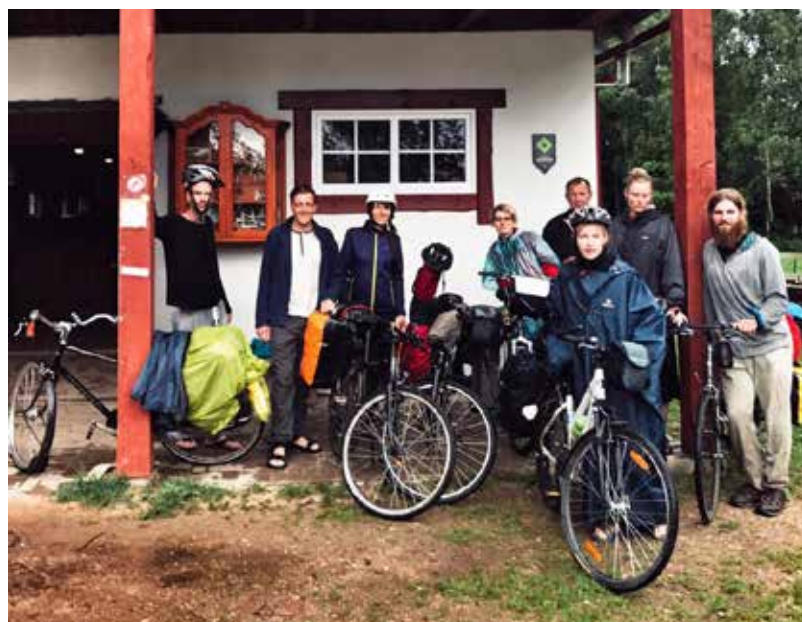
“Te nu mēs esam. Klajumos. Paldies Sēlijai par 494 neticami skaistiem kilometriem, laipnību un cilvēcību. Esam piepildīti”