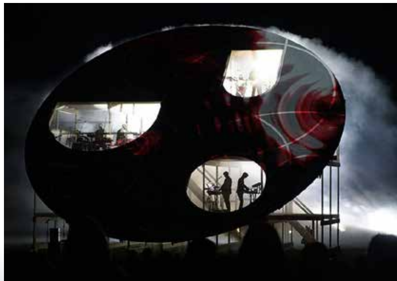
“Dabas koncertzāle” dažādu nozaru profesionāļu atzinību guvusi ne tikai Latvijas, bet arī Eiropas līmenī