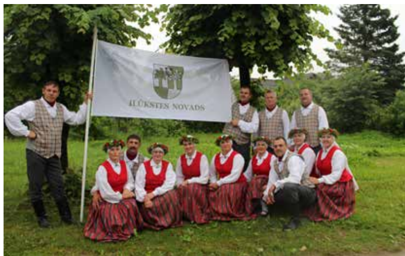
Pilskalnes pagasta vidējās paaudzes deju kolektīvs