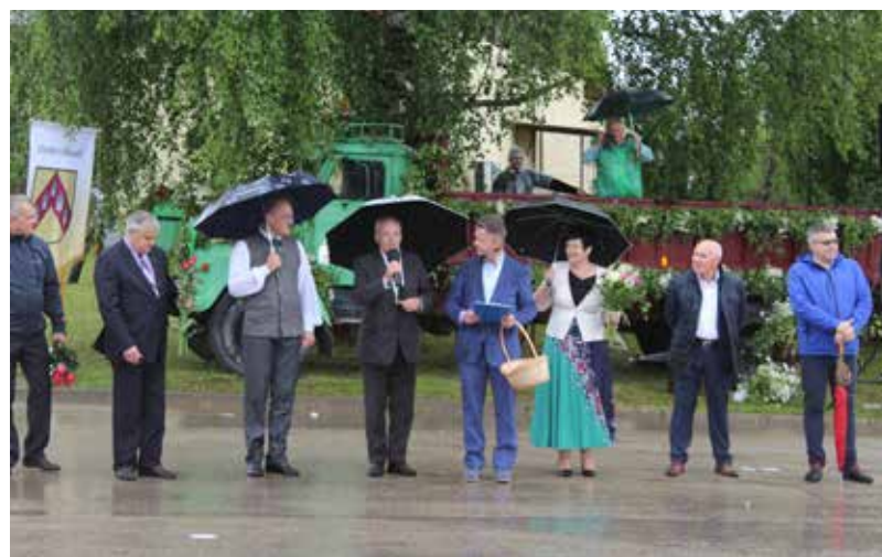
Sēlijas novadu pašvaldības vadītāji uzrunā svētku dalībniekus