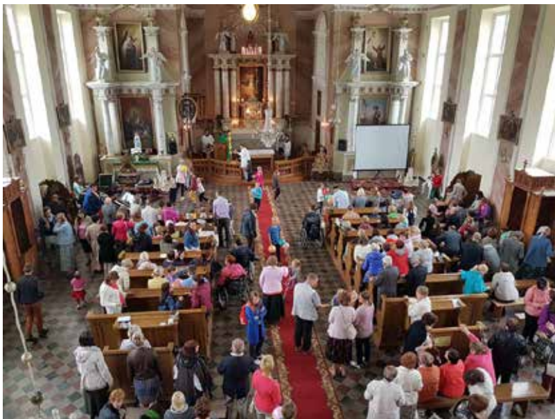
Bebrenē no 7. līdz 16. jūlijam notika Marijas skolas vasaras sesija, pulcinot vairāk kā 200 dalībniekus