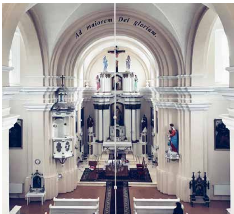
“Dviete ir skaista arī no iekšpuses. Ļoti”