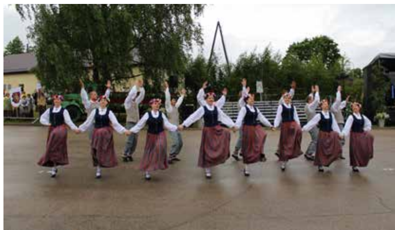
Dejo jauniešu deju kolektīvs “Labrīt”