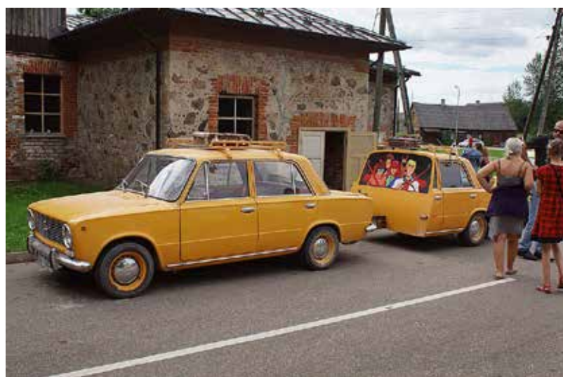
Šoreiz, no 29.- 30. jūlijam, tika rīkots VAZ auto kluba izbrauciens pa Sēlijas ārēm