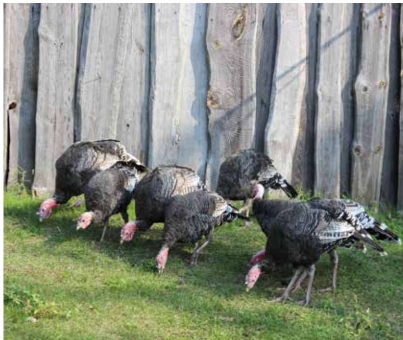
Mini zoodārzs pieņem apmeklētājus no 1. jūnija līdz 1. oktobrim

Pagājušā vasara saimniekiem pagāja aktīvi, kopā mini zoodārzu apmeklēja 1062 apmeklētāji. Mini zoodārzs pieņem apmeklētājus no 1. jūnija līdz 1. oktobrim. Ekskursijas ilgums ir apmēram 2 stundas, tās laikā viesiem ir iespēja uzzināt par dzīvniekiem, par Latviju zīmēm, kā tās izskatās un ko tās nozīmē. Tāpat arī tiek stāstīts par draudzību, rūpēm un ģimeniskām vērtībām, kas jāsauglabā. Ekskursijai var pieteikties zvanot pa tālr.: