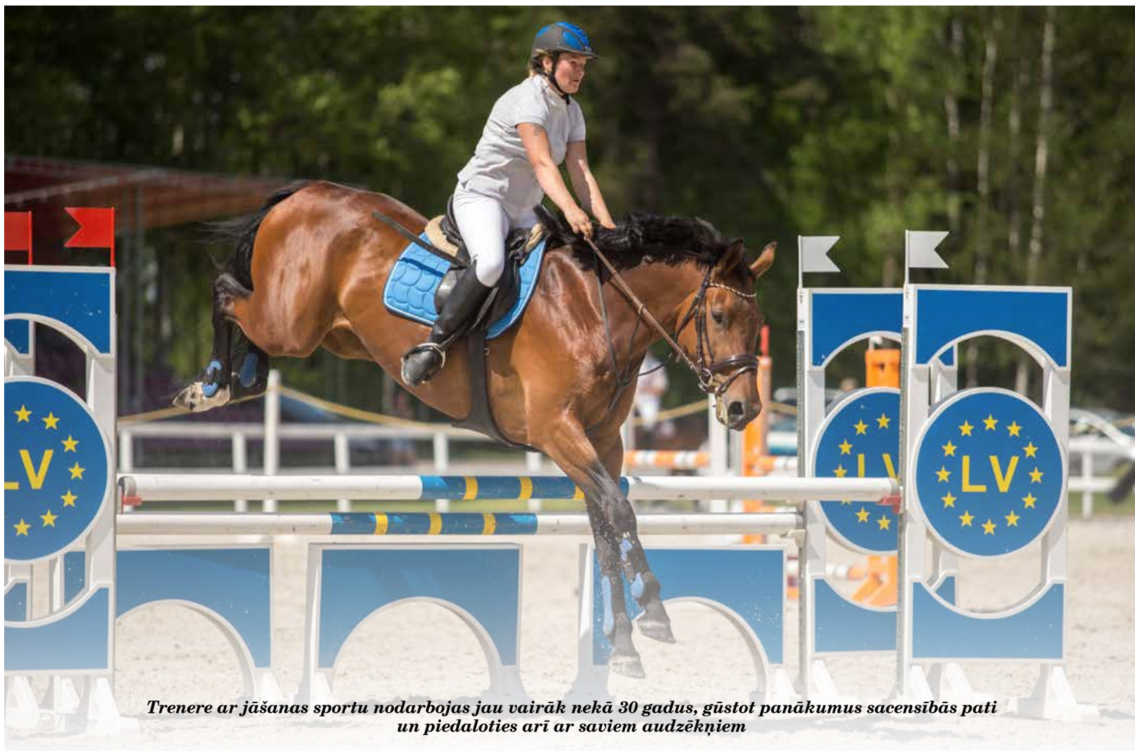
Trenere ar jāšanas sportu nodarbojas jau vairāk nekā 30 gadus, gūstot panākumus sacensībās pati un piedaloties arī ar saviem audzēkņiem