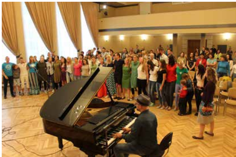
... satikšanās ar savām mājām, zemi, vienam ar otru. Satikšanās ar sevi