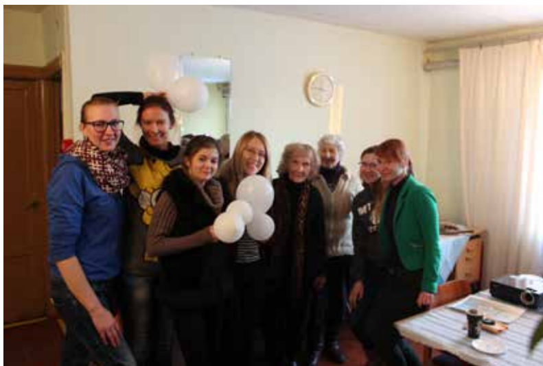
Pasākumā "Stāstu vakars" Egalinē piedalījās biedrība "Solis dabā" un "Stendera novadnieki" pārstāvji

Aizvadītā gada nogale Eglaines kultūras dzīvē tika pavadīta daudzveidīgi. Novembris pavadīts valsts svētku noskaņās, decembris - Ziemassvētku jūsmās. Ar īpašu un neparastu koncertu, ko sniedza Daugavpils akordeonistu orķestris (T.Saratova, atbalstīja Daugavpils latviešu kultūras centrs), 5.novembrī tika ieskandināts valsts svētku mēnesis, kam sekoja arī svētku koncerts 18.novembra priekšvakarā. Savukārt 28.novembrī Eglaines pagasta kultūras namā viesojās cirks ar "Klaunu šova" programmu, iepriecinot jaunākos pasākuma apmeklētājus.