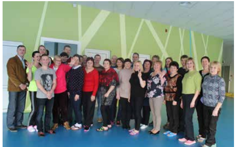
Sēlijas sporta skolotāji tikās seminārā, kur jaunākās mācību metodes izmēģina praktiski