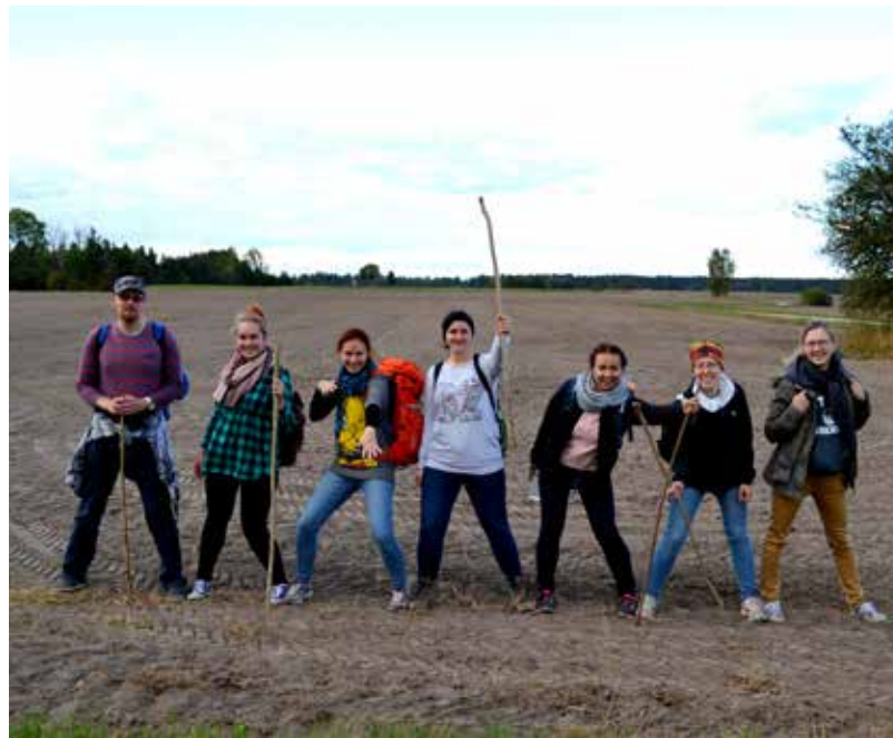
Kopā ar biedrību "Solis dabā" pārgājienā Kurzemē Kandava-Sabile, Abavas senlejā

Pēc studijām, kad bija brīvāks laiks, kad es nestrādāju, nemācījos, mēģināju brīvprātīgi dažādos pasākumos iesaistīties. Kaut vai „Positivus”, tajā trakajā, ar stereotipiem bagātajā pasākumā, Brīvdabas muzejā, [Latvijas Etnogrāfiskais brīvdabas muzejs] biedrībā Homo ekos [Homo Ecos]. Tādos brīvprātīgos pasākumos, apmācībās, nometnēs, arī biju "Latvijas kultūras vēstnieku nometnē", kaut gan tajā laikā es nebiju kultūras darbinieks, kaut kā domāju - vis jau nepazaudēts laiks, kontaktus iegūsti, jaunas idejas... Lai kam tomēr tie kultūras vēstnieki turpinājās ar tādu realizāciju.