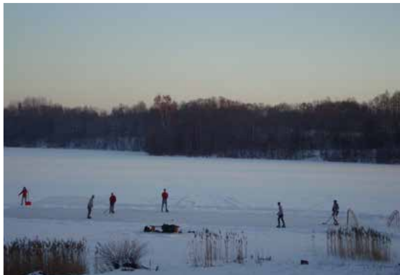
Biedrība "Subatieši-sanākam, domājam, darām" kopš 2006.gada organizē sporta inventāra nomu