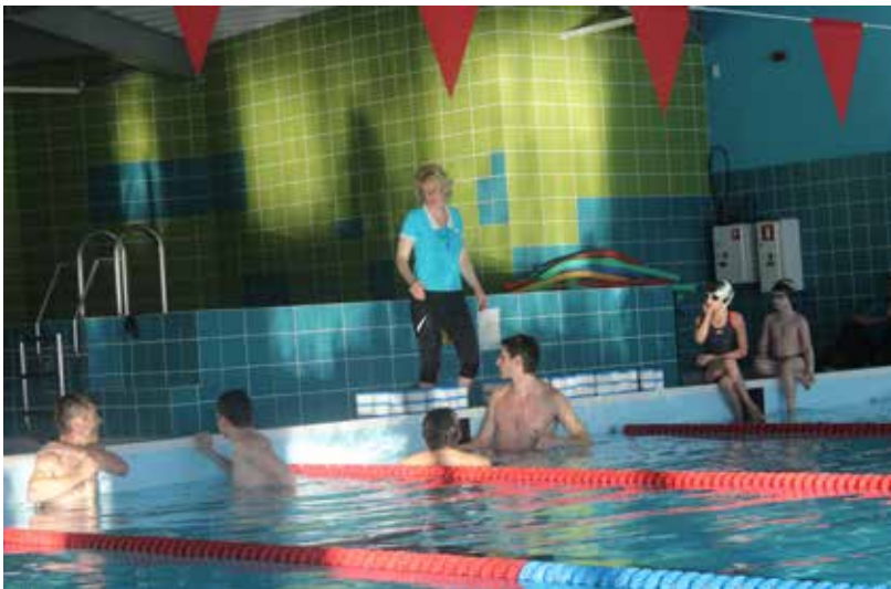
Daļa skolotāju izmantoja iespēju pilnveidot arī savas peldēšanas prasmes