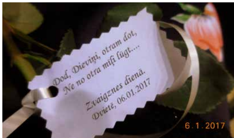
Atzīmējot Zvaigznes dienu, Dvietē iedibina jaunu tradīciju

pateiktu paldies, par visu ko Dvietes labā katrs personīgi ir izdarījis no brīvas gribas, nevis amata pienākumu dēļ.