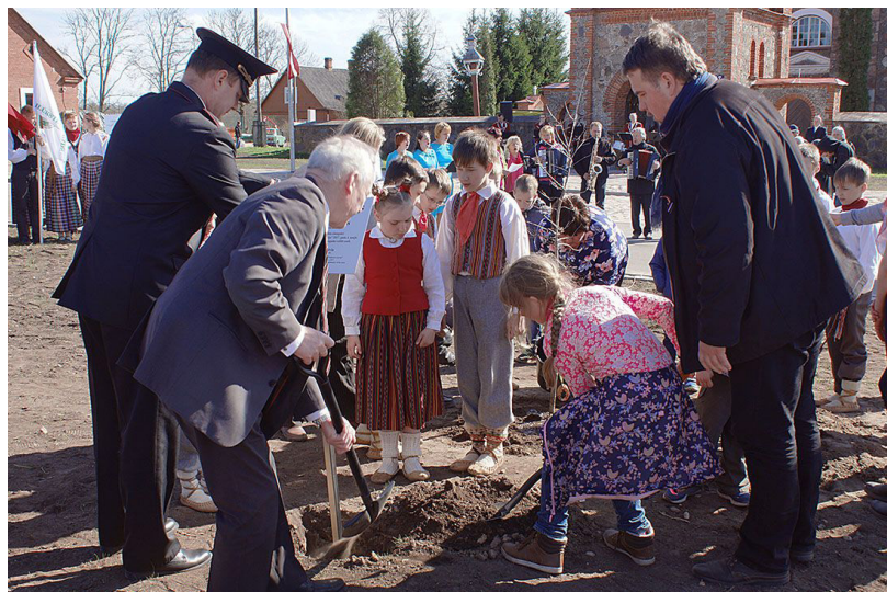
4.maijā visi kopā Subatē iestādījām Latvijas simtgades ozolu

4. maijā pie Latvijas robežas esošo 45 pašvaldību teritorijās stādījām ozolus, kam pievienota īpaša norāde, kas apliecinās, ka tas ir Latvijas simtgades ozols. Stādīšanas darbi tika vienlaicīgi uzsākti no četriem galējiem Latvijas punktiem, kuros par piemiņu valsts astoņdesmitajai jubilejai (1998. gadā) tēlnieks Vilis Titāns izveidoja skulpturālu grupu „Latvija saules zīmē”. Meikšānu ciemā Zilupes - Šķaunes ceļa malā atrodas viena no četrām zīmēm „Austras koks”, jo būdams vistālāk uz valsts austrumiem,