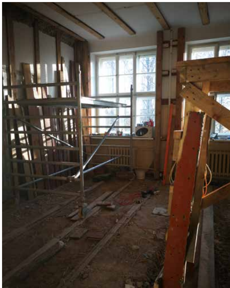
Projekta ietvaros Eglaines pamatskolas telpās tiks izveidota “Stendera laika klase”, ko varēs apmeklēt visi skolas vecuma bērni un jebkurš tūrists