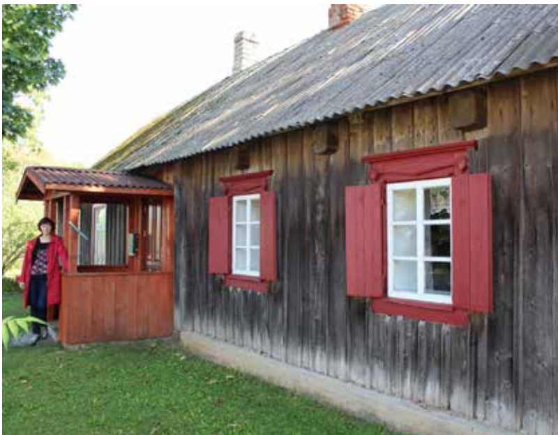
Top video stāsti par skaistajām novada vietām un uzņēmīgajiem novadniekiem