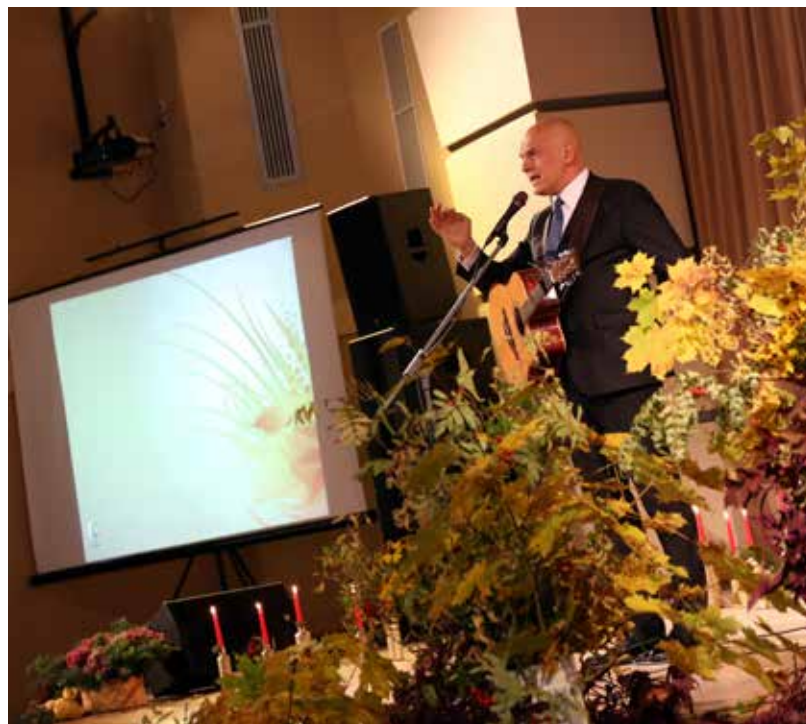
Vakara noslēgumā dzejas un mūzikas baudījums kopā ar iemīloto mākslinieku Vari Vētru

Vakara noslēgumā skolotājiem tika dāvināts dzejas un mūzikas baudījums kopā ar iemīloto mākslinieku Vari Vētru, vēlot no svētku vakara paņemt sirds siltuma uguntiņu, kopā būšanas prieku, to klāt pie citiem mīļiem mirkliem likt, lai rudens vējos tas spētu sasildīt!