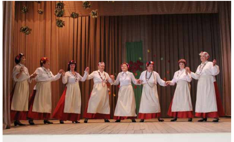
Pasākuma gaitā tika sniegta ne vien noderīga informācija, bet arī sanākušie baudīja dažādus priekšnesumus, tostarp uzstājās arī Eiropas deju kopa “Eglītes”