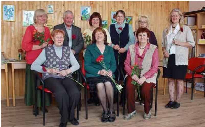
“Ļoti ceram, ka mūsu pulkam pievienosies arī citi seniori-darbotiesgribētāji,” Bebrene senioru kluba „Sidrabrasa” padome

Bebrene seniori, Starptautiskās senioru dienas noskaņās un uzsākot kārtējo sezonu, tikās 3.oktobrī, lai skatītu fotoprezentāciju un dalītos iespaidos par savām aktivitātēm.