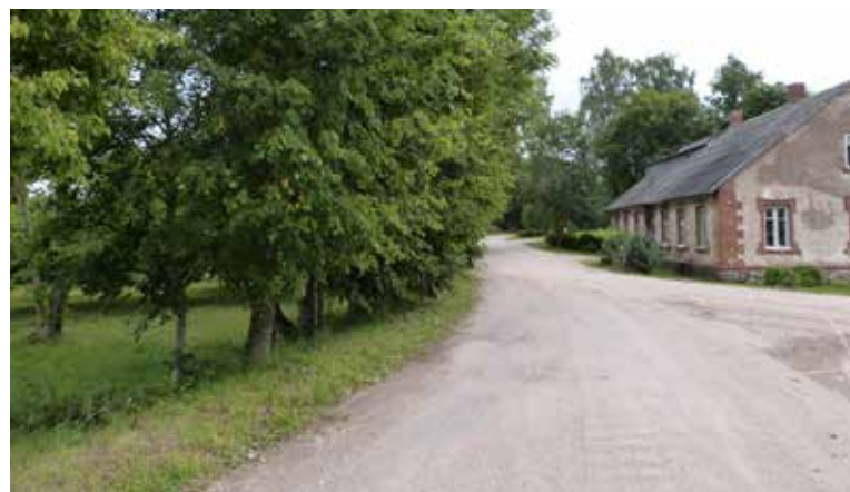
Autoceļa V702 Ilūkste – Ilze – Vitkuški posmu Ilzes ciemata teritorijā sakārtošanas darbi varētu tikt uzsākti šogad

Bebrenes pagasta Ilzes ciemā notika publiskā apspriešana par koku ciršanu un apzāģēšanu. Koku ciršana ir nepieciešama, lai nodrošinātu kvalitatīvu ceļu seguma atjaunošanu un ūdens atvades sistēmas sakārtošanu. VAS "Latvijas valsts ceļi" Daugavpils nodaļa informē, ka autoceļa V702 Ilūkste – Ilze – Vitkuški posmu Ilzes ciemata teritorijā, sakārtošanas darbi varētu tikt uzsākti šogad.