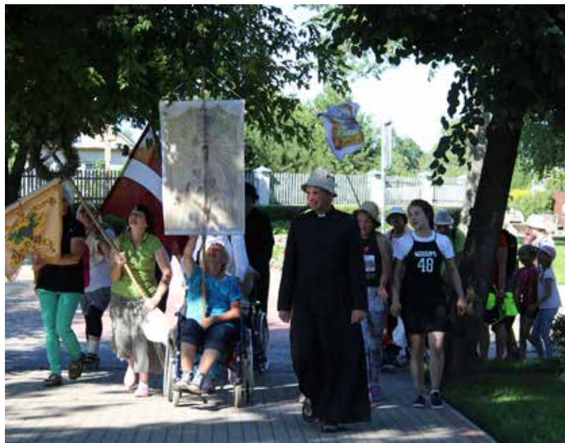
Ceļā uz Aglonu devās arī mūsu novada ļaudis, kurus 8.augustā satiekam Ilūkstē. Viņu vidū ir gan mazi bērni, gan cilvēki ratiņkrēslos. Viņi dienā mēro pat 20 kilometrus pa grants ceļiem, lūdzot nevis ko sev, bet Latvijai