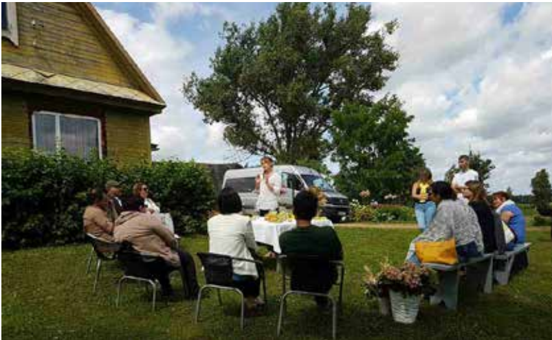
Šogad augustā Timšānu saimniecībā tika uzņemti Armēnijas lauku tūrisma pārstāvji

Principā piektais gads graudkopībā. Sanāk pieci gadi.