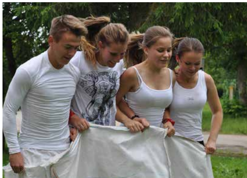
Vasarā Ilūkstē notika orientēšanās sacensības, kurās mūsu novada jaunieši ne tikai piedalījās, bet arī bija kā organizatori. Novadu pārstāvēja komanda no Subates