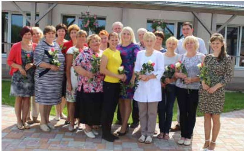
Dvietē durvis vērusi jaunā pansija „Mūsmājas „Dižkoks””

No 16. augusta Dvietē darbu uzsākusi jauna pansija „Mūsmājas „Dižkoks””, kas sniedz atbalstu, sirdssiltumu un mājas sajūtu cilvēkiem, kuriem ikdienā nepieciešama palīdzība un aprūpe.