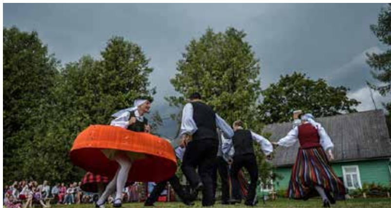
Ar plašu pasākumu programmu, visas dienas garumā, Dvietē tika svinēti „Vīnkopju – Vīndaru svētki”