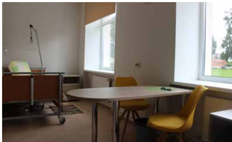
Pansijā ir pieejamas gan vienvietīgas gan divvietīgas istabīņas

Kā jau iepriekš tika plānots, vairojot bērnu iespējas aktīvi, veselīgi pavadīt laiku, vasarā Sporta centrā notika dažādas nometnes gan peldētājiem gan vieglatlētiem. Uz nometnēm brauca bērni no Lietuvas, Ādažiem, Olaines.