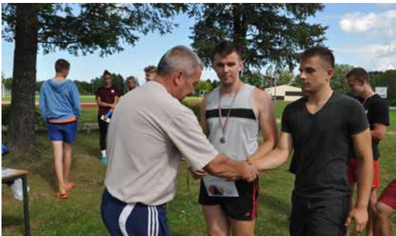
4.augustā noslēdzās Ilūkstes novada minifutbola sacensības, kurās piedalījās četras komandas- "Pilskalne", "Šēdere", "Svente" un "Hektors" no Daugavpils