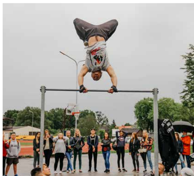
Paraugdemonstrējumi no Latvijas ielu vingrotāju biedrības

„PROTI un DARI!” ir Eiropas Savienības fondu 2014.-2020. gada plānošanas perioda darbības programmas „Izaugsme un nodarbinātība” 8.3.3. specifiskā atbalsta mērķa „Attīstīt NVA neregistrēto NEET jauniešu prasmes un veicināt to iesaisti izglītībā, NVA īstenojamajās pasākumos Jauniešu garantijas ietvaros un nevalstisko organizāciju vai jauniešu centru darbībā” projekts, ko īsteno Jaunatnes starptautisko programmu aģentūra sadarbībā ar Latvijas pašvaldībām.