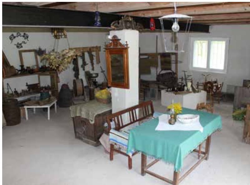
Šodien "Vecā Stendera muzejs" ir glabātājs, atmiņu krājuma tēvs, satikšanās vieta un jaunu domu avots