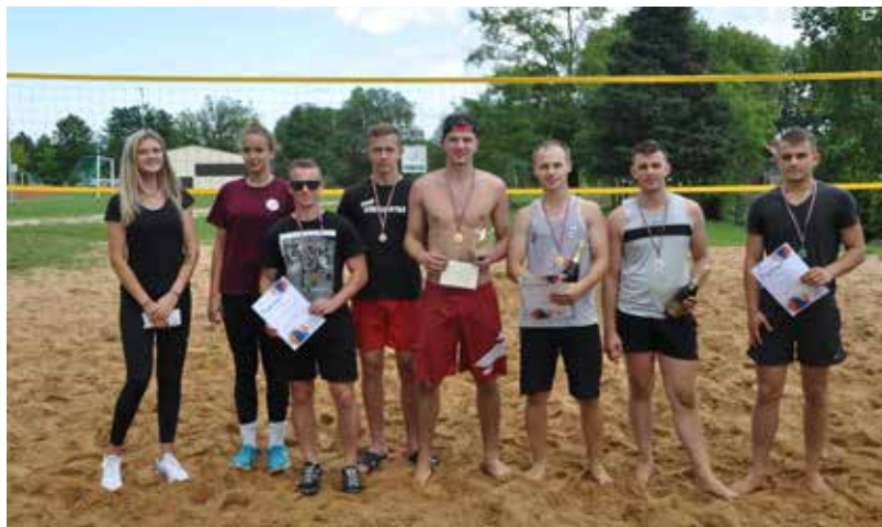
Pludmales volejbola cienītāji Ilūkstes pilsētas stadionā pulcējās 5.augustā