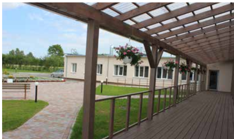
Labiekārtots pagalms ar skatu no terases, šūpoles, augļudārzu un mazdārziņš