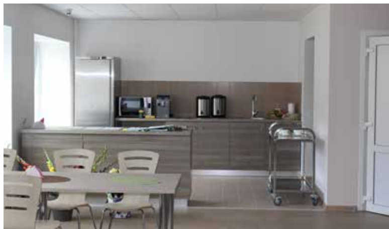
Virtuve patstāvīgai ēdiena gatavošanai

Bērnu skaits nometnēs dažāds, gan sākot no 10 līdz 50 cilvēku lielai grupai.