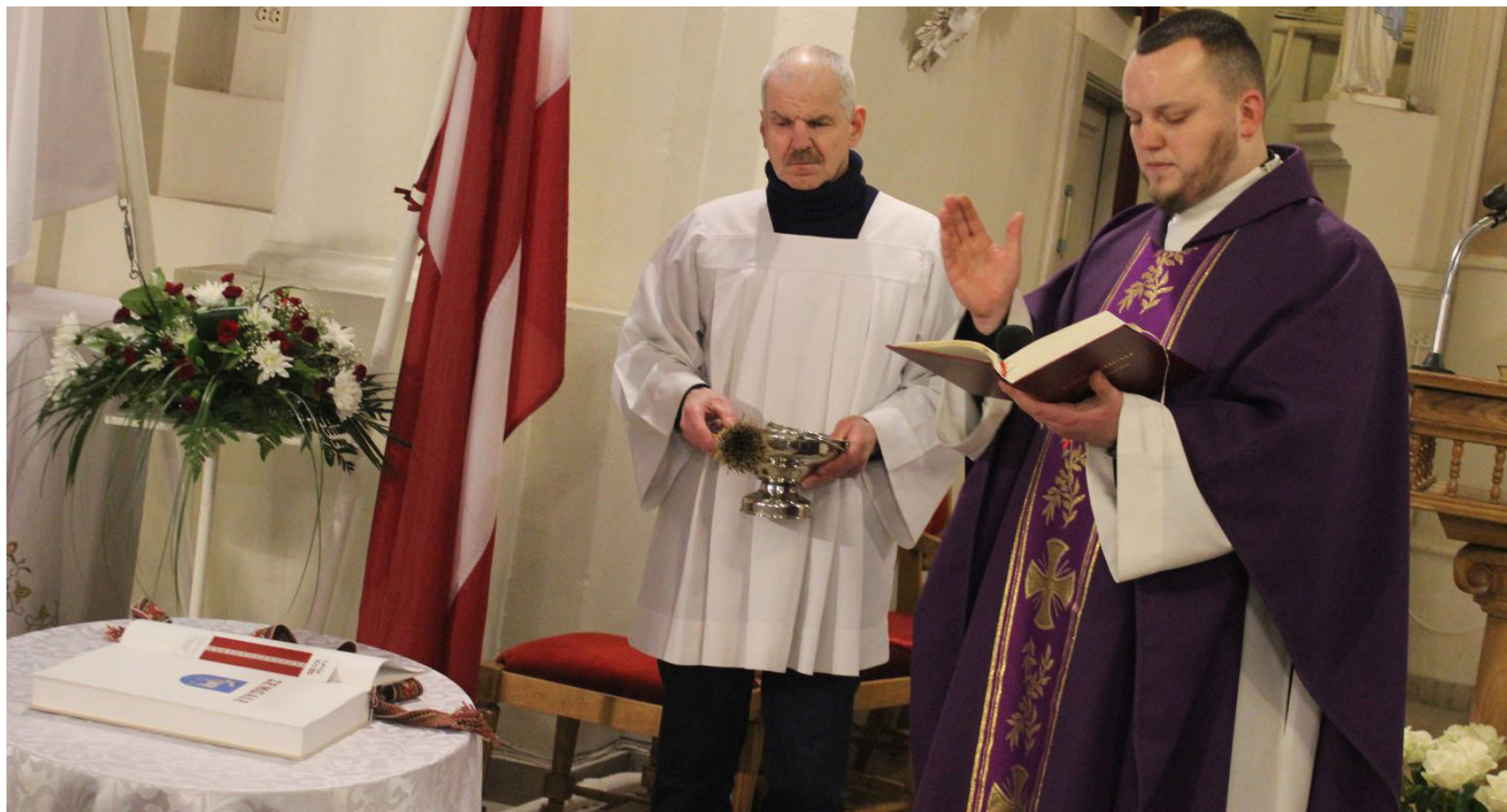
„Tautas Saimes grāmata” iedziedāšanas pasākums notika 16. martā Ilūkstes Romas katoļu baznīcā

Ilūkstes novada pašvaldības sabiedrisko attiecību speciāliste