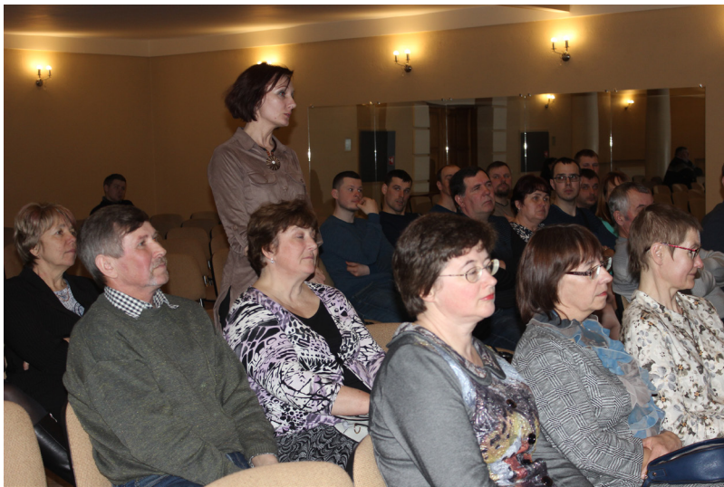
Ministrs ar saviem kolēģiem uz klausīja klātesošo jautājumus, komentārus, ieteikumus un atklāti skaidroja savu nostāju, risinot dažādas situācijas