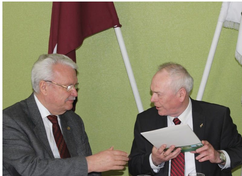
Šī vizīte novadā kļuva par vēl vienu spēcīgu notikumu, jo ne vien deva iespēju paust novada nostāju mums svarīgos jautājumos, bet arī just ministra atbalstu un sapratni, ciešā sadarbībā veicinot lauku attīstību

tiešmaksājumus no Eiropas Savienības fondiem. Ministrs uzsvēra, ka tiek turpināts darbs pie tā, lai samazinātu OIK (Obligātā iepirkuma komponente) ne tikai lielajiem uzņēmumiem, bet arī mazajiem un vidējiem, kā arī māsaimniecībām. Ministrs ar saviem kolēģiem uz klausīja klātesošo jautājumus, komentārus, ieteikumus un atklāti skaidroja ministrijas nostāju, risinot dažādas situācijas, kā arī kļiedēja neskaidrības dažādos jautājumos.