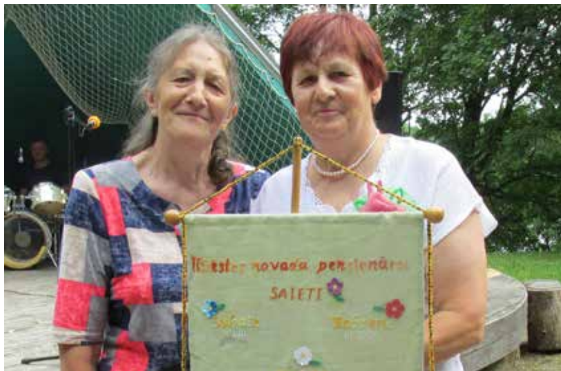
Nākamais senioru saiets notiks Bebreņē

Ilūkstes novada pensionāru biedrības valde