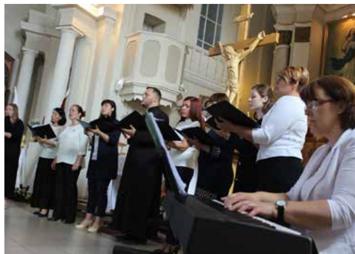
...pieaugošā cerībā un patiesā priekā par novada izaugsmi, svētkus atklājām ar Dievkalpojumu

Ilūkstes novada pašvaldības sabiedrisko attiecību speciāliste