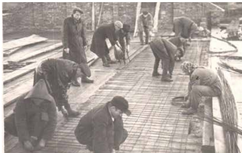
Ilūkstes pirts celtniecība, 1952. gads