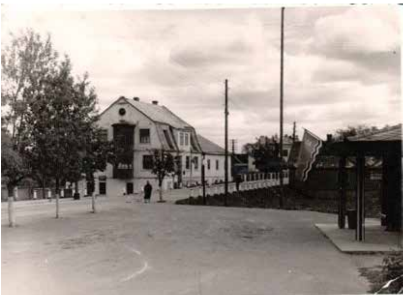
Ilūkstes dzirnavas, autoosta, 60-to gadu sākums