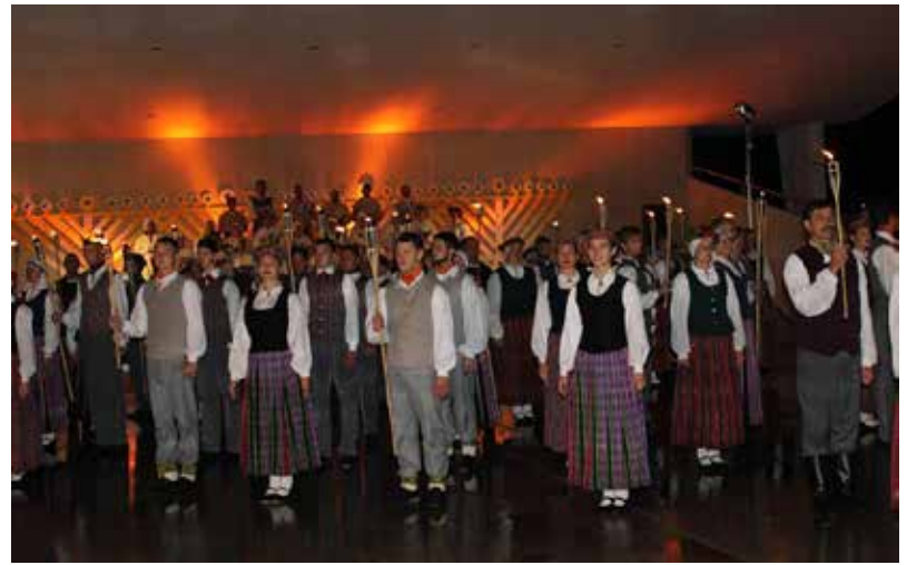
Patriotiskais svētku noslēguma koncerts "Saules meitas vedības"