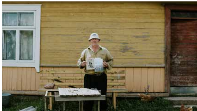
Ekspedīcija notika realizējot LU Filoloģijas fakultātes un LNB projektu "Lauka pētījums: lasīšanas ieradumi mūsdienī Ilūkstes novadā" (atbalsta Valsts Kultūrkapitāla fonds) un RSU un LKA ikgadējo Kultūras žurnālistikas vasaras skolas ietvaros.

Latvijas Nacionālās bibliotēkas, Latvijas Universitātes, Rīgas Stradiņa universitātes vārdā vēlos pateikt lielu, lielu paldies par sirsnīgu un dāsno lauka pētījuma "Lasīšanas ieradumi Ilūkstes novadā" dalībnieku uzņemšanu Bebreņē un Ilūkstes novadā!