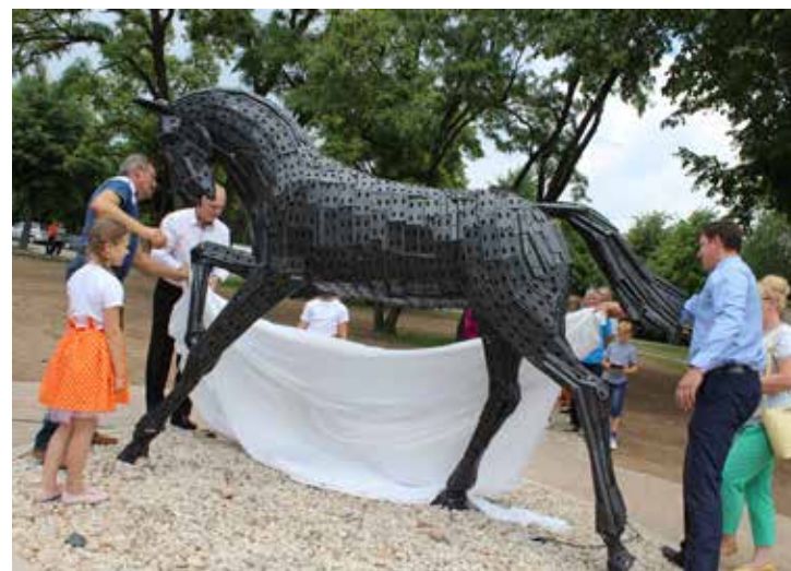
Novada svētkos tapa skaista dāvana pilsētai un novadam. Pilsētas simbols - zirgs - "ienācis" pilsētvidē un rotā rekonstruēto skvēru