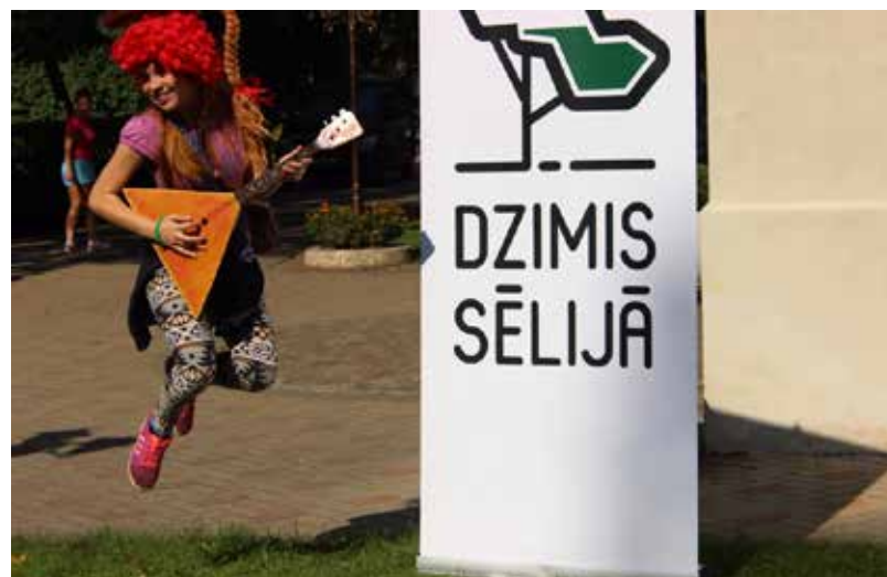
Pasākuma mērķis joprojām palicis nemainīgs – veicināt jauniešu sadarbību starp septiņiem Sēlijas novadiem un Krustpils novadu, organizējot kopīgas pasākumu tradīcijas un sekmējot jauniešu līdzdalību Sēlijas novadu jauniešu organizāciju un skolu pašpārvalžu darbā

Otrā diena sāksies ar rīta rosmi. Tad kopīgi dosimies pārgājienā uz lauku sētu "Vidzemnieki", kur ir izveidots mini zoodārzs. Pēc tam paredzēts