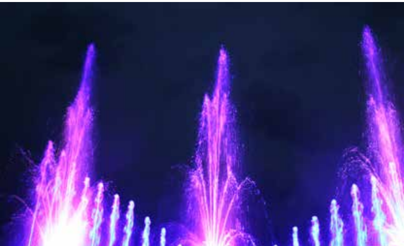
Novada svētku pārsteigums – muzikālās strūklakas!