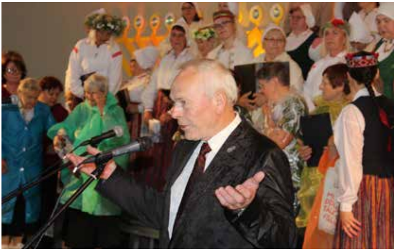
Spēcinošie novada domes priekšsēdētāja vēlējumi