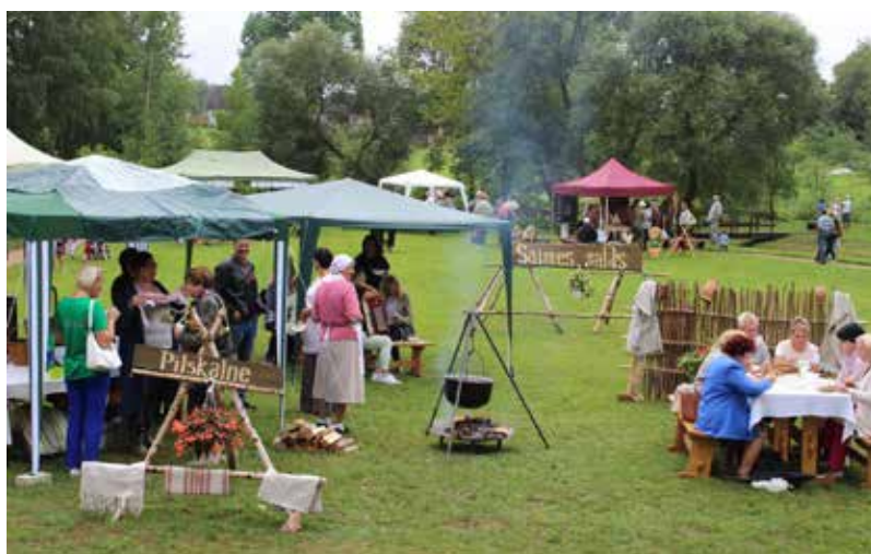
Spēcinājāties pie "Saimes galdā"