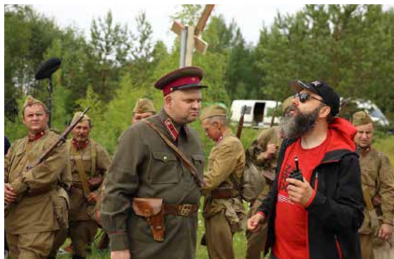
Filma stāstīs par laika posmu no 1939. gada līdz 1941. gadam