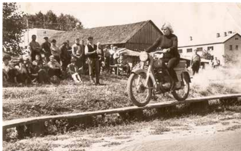
Veiklības braucieni sacensības, 1967./68.māc.gadā Bebrenes veterinārajā tehnikumā