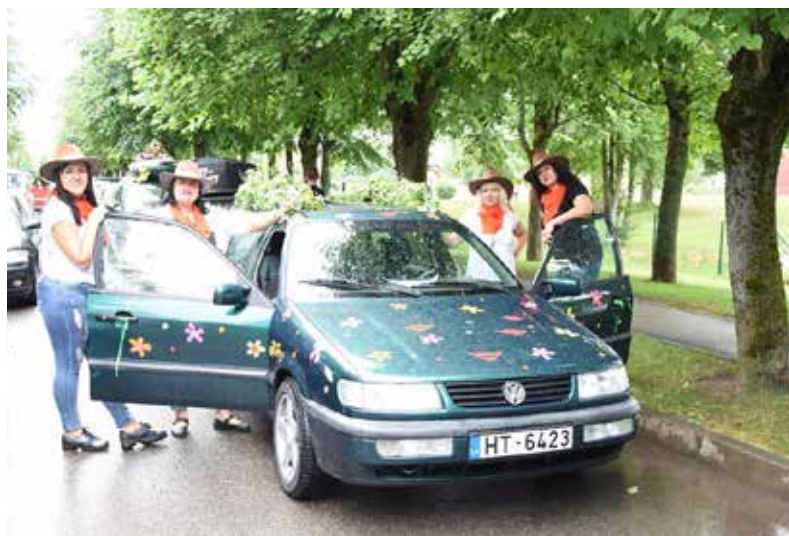
Šogad Ilūkstes novada tūrisma rallijā "Citādais ceļojums" piedalījās 29 komandas

Ilūkstes novada pašvaldības sabiedrisko attiecību speciāliste