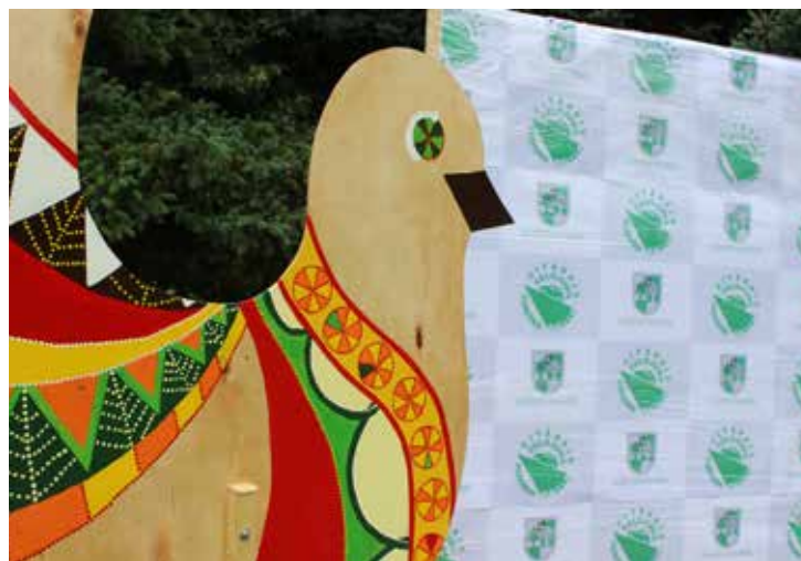
Radošā noskaņā sagaidījām "Citādo ceļojumu"