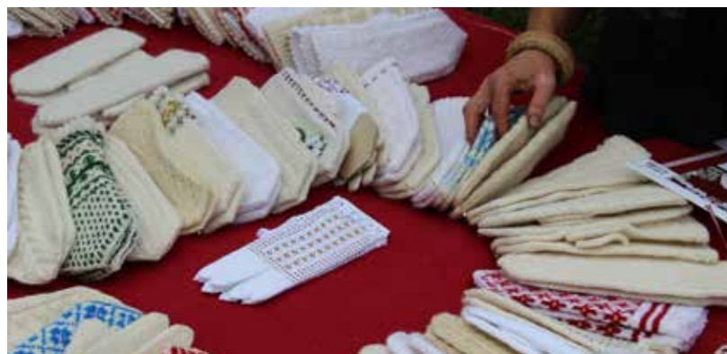
Jau ir tapuši vairāk kā 80 Goda cimdu pāru!

Ilūkstes novada pašvaldības sabiedrisko attiecību speciāliste