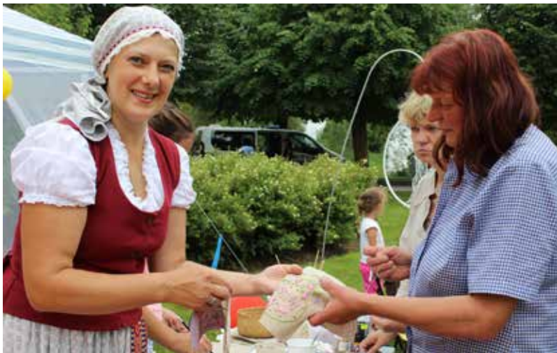
Vijām simtgades jostu