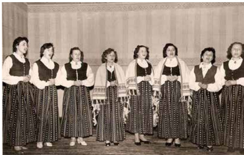
Bebrenes veterinārā tehnikuma skolotāju un darbinieku vokālais ansamblis. 1960-tie gadi