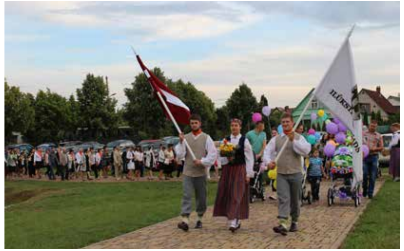
Īpašā kopības sajūtā vienojāmieš dodoties svētku gājienā