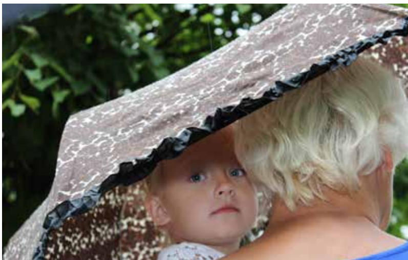
...un lietus mums netraucēja!