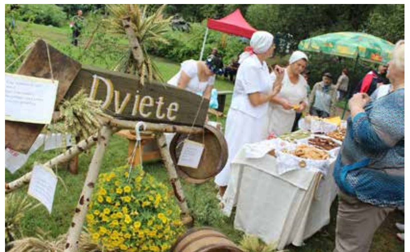
...pārsteidzošās pagastu prezentācijas "Saimes galdā"