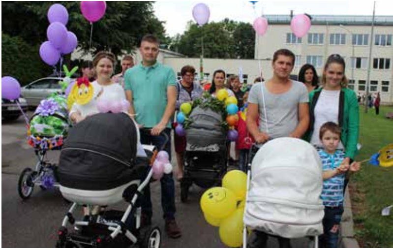
Svētku gājienā arī mūsu simtgades bērniņu ģimenes