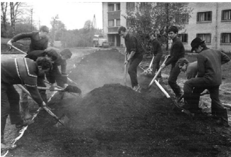
Sestdienas talka. Audzēkņi palīdz klāt asfalta segumu līdz kopmītnēm. 1973.g. 21.aprīlis, Bebrene

Ilūkstes novada pašvaldības sabiedrisko attiecību speciāliste