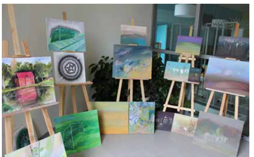
Savādāki stāsti par novada pērlēm