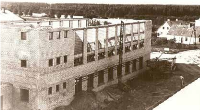
Sporta zāles un ēdnīcas celtniecība Bebreņē, 1969.gads