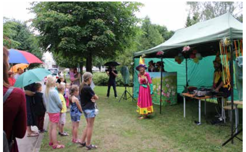
Mazo un lielo priekam "Čučumižas" rūķu vasaras raibumi!