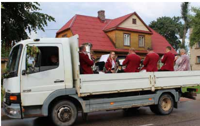
Tā lūk modāmie svētku noslēguma dienai!