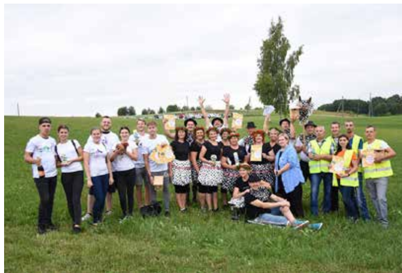
Godalgotajās vietās suminājām komandas "Tokijas sānslīde" (Ilūkstes katoļu draudzes komanda) - 2.vieta, "Drīms" (Pilskalnes pagasta vidējās paaudzes deju kolektīvs) - 1.vieta, bet 3.vietā - Mednieku kolektīvs Dvieta