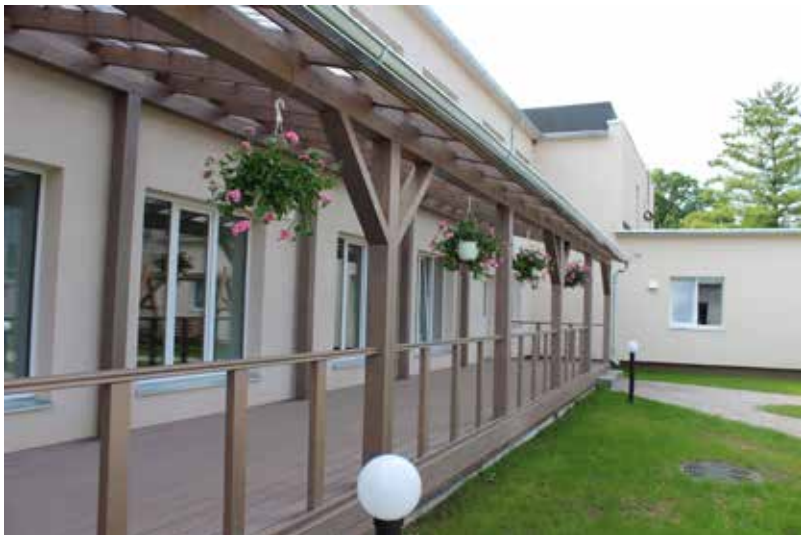
...mājas, kas lauž priekšstatus