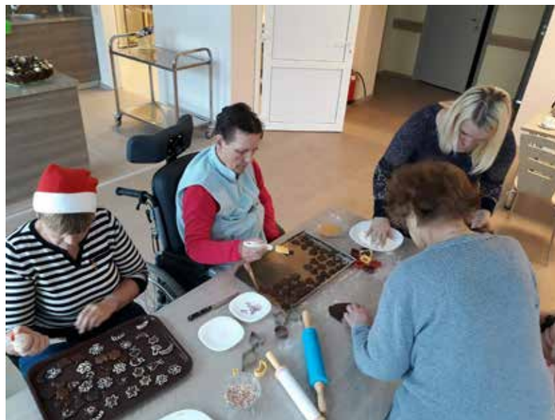
Tiek ieviestas un stiprinātas tradīcijas, kas saliedētu visu kolektīvu, nenodalot darbiniekus no klientiem un svētki tiek svinēti kopā!

Darbinieku teikto apstiprina arī sirmgalvji, kas dzīvo pansijā. Jā, te satiekam arī kādu sāpi un skumju stāstu... bet tomēr visam pāri – šķiet gandrīz sataustāma gaisma.