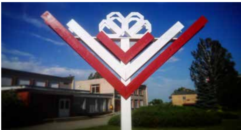
Svētku rota Dvietē

Jau šovasar, 12.,13. un 14. jūlijā svinēsīm Ilūkstes novada svētkus, tādēļ, sagaidot tos, aicinām novada organizācijas un iestādes, kā arī ikkatru novada iedzīvotāju rūpēties par svētku noformējumu.