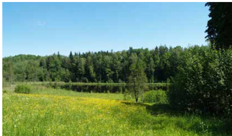
Pilskalnes pagasts ir pilskalniem visbagātākais pagasts visā Augšzemē un viens no pilskalniem bagātākajiem pagastiem arī visā Latvijā

Liepkalnu pilskalns atrodas ap 200 m uz DA no Liepkalnu mājām. Tas nav tradicionāls pilskalns, bet liels un grandiozs, tagad kokiem, krūmiem un briksņiem pāraudzis no zemes veidots nocietinājums. A un DA pusē nocietinājumu norobežo ap 10 – 15 m dziļā Dziļā grava un te nekādi mākslīgi nocietinājumi nav bijuši vajadzīgi. No pārējās apkārtnes nocietinājums norobežots ar 3 – 4 – 5 m dziļu un ap 5 m platu grāvi, kas visizteiktākais ir pret Z, ZR un R. Zemes no grāvja ir mestas abās tā pusēs. D daļā grāvis izbeidzas stāvajā gravas nogāzē. Šķiet, ka nocietinājuma būvētāji