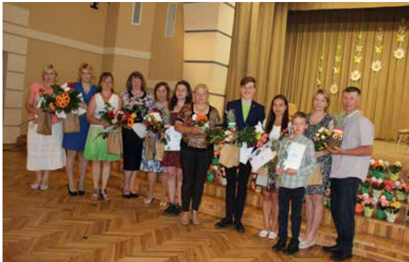
Labi padarīta darba un pateicības gaisotnē 30.maijā Ilūkstes novada kultūras centrā, kur tika sumināti novada reģionālo, valsts mācību priekšmetu olimpiāžu, konkursu, interešu izglītības un sporta laureāti

30. maija pēcpusdienā pulcējāmies Ilūkstes novada kultūras centrā, lai dalītos priekā par mūsu novada bērnu un pedagogu augstajiem sasniegumiem šajā mācību gadā. Gads ir bijis dažādām aktivitātēm bagāts – skolēni ir piedalījušies mācību priekšmetu olimpiādēs, mūzikas konkursos, interešu izglītības un sporta sacensībās, tādēļ šajā svētku pasākumā dažādās kategorijās tika apbalvoti vairāk nekā 40 skolēni un 39 skolotāji, kuri radošā un profesionālā sadarbībā ir pilnveidojušies un pamatoti likuši ar sevi lepoties, nesot gan skolas, gan visa novada vārdu.