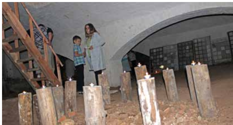
Baznīcas pagrabus ir pazemes eja un kā vēsta nostāsti, šī pazemes eja vedot no baznīcas zem Subates ezera uz Subate katoļu baznīcu