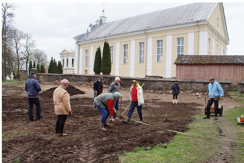
...liela rosība valdīja pie Bebreņu katoļu baznīcas. Talcinieki raka, veda, grāba zemi, stādīja kociņus un košumkrūmus – tapa Jaunavas Marijas dārzs.

Bebrenes pagastā šogad talkā piedalījās nedaudz vairāk kā 200 cilvēki. Savākti 152 maisi ar atkritumiem. Pirmstalkas nedēļā aktīvi darbojās 140 Bebreņu vispārīgizglītojošās un profesionālās vidusskolas skolēni un darbinieki. Talkas ietvaros tika sakopta ābeļdārza teritorija, sporta laukums un dienesta viesnīcas (upītes krasts un tam piegulošā teritorija) apkārtnē. Piektdien mazie Bebreņu bērnu dārza ķipari un audzinātājas (kopā 23 cilvēki) centīgi uzskatīja bērnu dārzu piegulošo teritoriju (lasīja zariņus, vāca plastmasu un papirus). Talkas dienā parkā aktīvi darbojās 5 seniori (savā atpūtas stūrītī). Arī „Tehniskā centra” apkārtnē čakli rosījās 6 talcinieki. Savukārt „Akmeņupes dabas takā” darbojās 10 talcinieki. Tika izcirsti koki un krūmi, salikti akmeņu pakāpieni. Liela rosība valdīja pie Bebreņu katoļu baznīcas. Talcinieki raka, veda, grāba zemi, stādīja kociņus un košumkrūmus – tapa Jaunavas Marijas dārzs. Kopā talkoja 20 cilvēki. Arī „Bebra” vetaptiekas apkārtnē čakli uzskatīja 6 talcinieki. Ilze ciemata centrā aktīvi darbojās 16 talcinieki. Pēc talkas visus talkotājus spēcīnāja silta tēja un zupa. “Paldies visiem par atsaucību. Taču Lielā Talkā nebeidzas ar gandarījumu par šajā dienā paveikto. Mums visas nākošās 364 dienas līdz nākamajai talkai jādzīvo ar domu, ka talkas dienā būs daudz mazāk kopjamā, bet vairāk laiku varēsīm veltīt skaistākas vides labiekārtošanai un veidošanai”, uzsver Benita Štrausa, Bebreņu pagasta pārvaldes vadītāja.