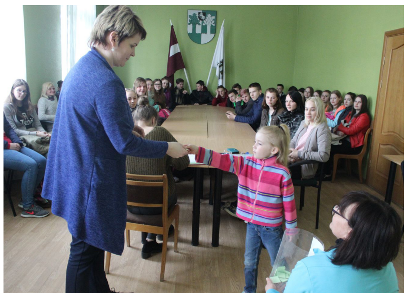
24.aprīlī tika noskaidroti jaunieši, kuriem būs iespēja strādāt vasarā

Ilūkstes novada pašvaldības sabiedrisko attiecību speciāliste