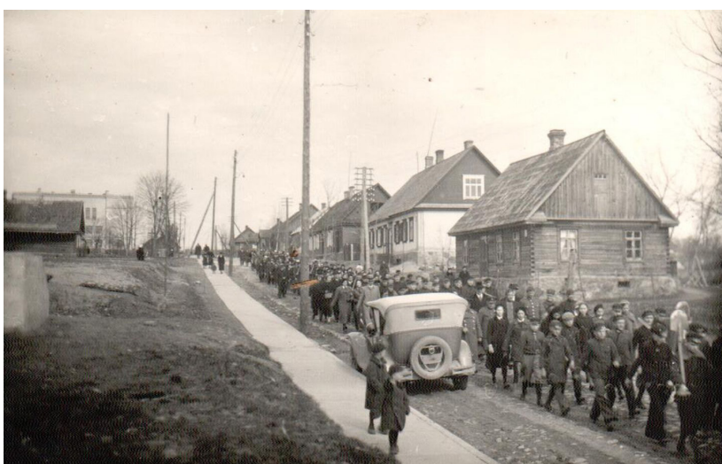
Bebreņu iela Ilūkstē, 1938.-1948. gads