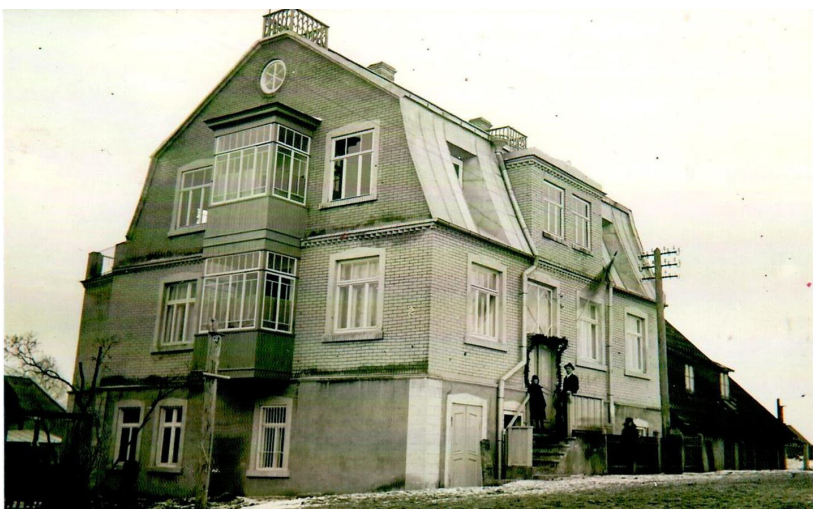
Ūdens dzirnavas, Ilūkste, 1938.-1948. gads