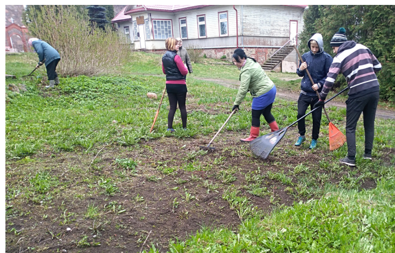
Subatē talka notika vairākās vietās - subatieši sakopa ezera krastus, luterāņu un katoļu baznīcu apkārtni, “Miera nama” kolektīvs strādāja Kazimīrvāles kapos