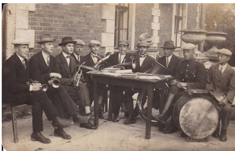
Bebreņu pagasta pūtēju orķestris. Pūtēju orķestris saglabāja savas tradīcijas un darbību līdz pat 1980. gada beigām. (1938.g.)