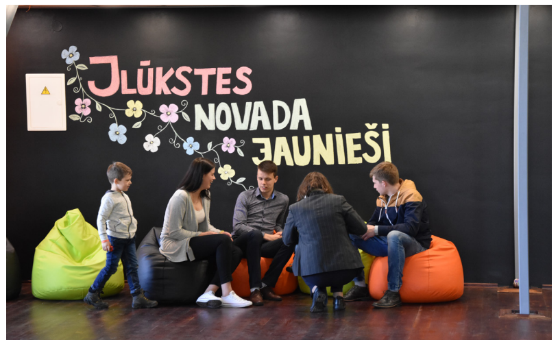
„Ilūkstes novada jauniešu radošais kvartāls” - vienā vietā apvienotas trīs jauniešiem svarīgas lietas – iespējas izglītoties, atpūsties un strādāt

Ilūkstes novada pašvaldībai piesaistot Eiropas lauksaimniecības fonda lauku attīstībai finansējumu un ieguldot savu līdzfinansējumu tika īstenots projekts „Ilūkstes novada jauniešu radošais kvartāls” (Nr. 17-03-AL28-A019.2201-000003). Atjaunojot un labiekārtojot bijušā kino teātra telpas Ilūkstes novada kultūras centrā ir izveidota jauna atpūtas vieta jauniešiem, kas vienā vietā apvienotas trīs jauniešiem svarīgas lietas – iespējas izglītoties, atpūsties un strādāt. Projekta “Ilūkstes novada jauniešu radošais kvartāls” mērķis ir apvienot visus radošos, mērķtiecīgos, zinātkāros, atraktīvos un aktīvos jauniešus – gan tos, kuri vēl mācās skolā, gan esošos un bijušos studentus, un nodarbinātos jauniešus aktīvai un produktīvai brīvā laika pavadīšanai, socializācijai, jaunu kontaktu gūšanai, kopīgu pasākumu organizēšanai u.c. Tādā veidā kļūstot ne tikai brīvā laika pavadīšanas vietu, bet arī darba iemaņu gūšanas, pieredzes apmaiņas vietu un jauniešu biznesa inkubatoru.