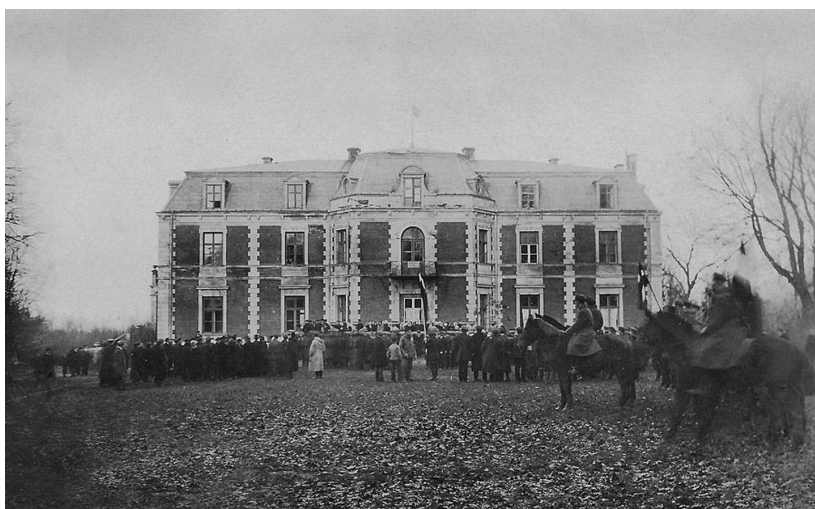
Tautas sapulce pie Bebreņu muižas 1919.gads