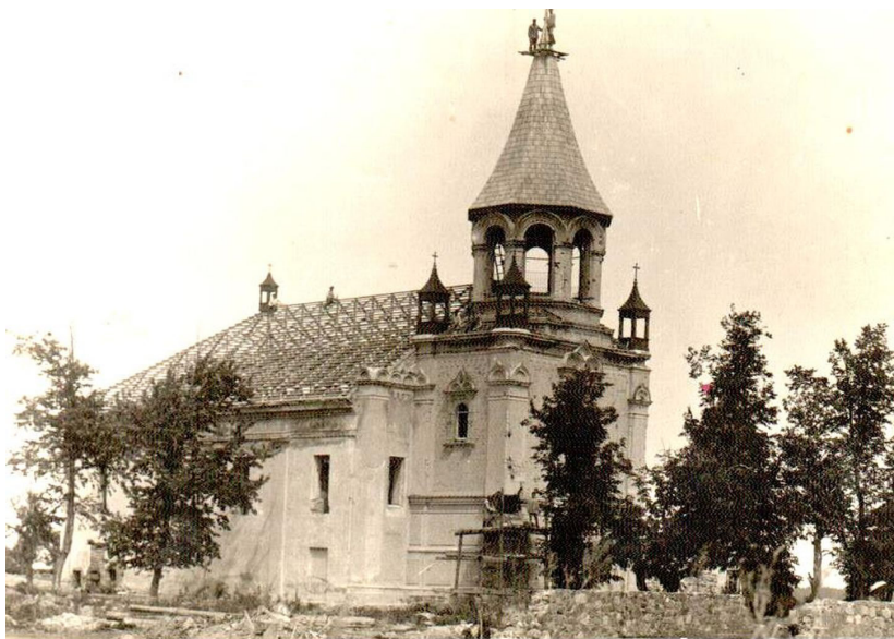
Ilūkstes Romas katoļu baznīcas remontdarbi, 1938.-1948. gads

Sagaidot Latvijas simtgadi katru mēnesi novada mājaslapā tiek publicētas 10 fotogrāfijas par katrām 10. gadiem (no 1918. līdz 1928., no 1929. līdz 1939. gadam utt.). Kopā – 100 fotogrāfijas! Piedāvājam ieskatu dažās no tām.