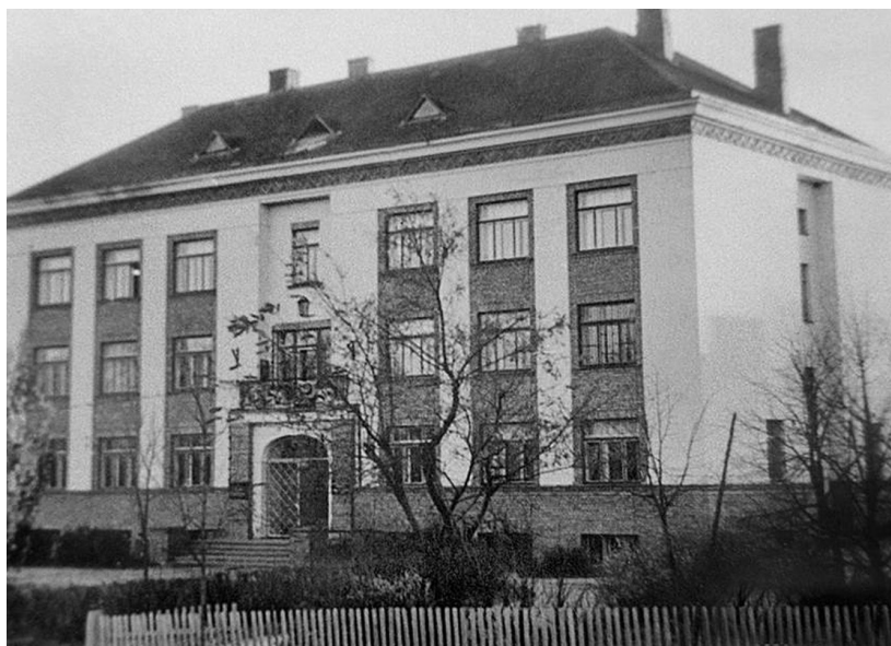
Aprīņķa administrācija (14.08.1937)