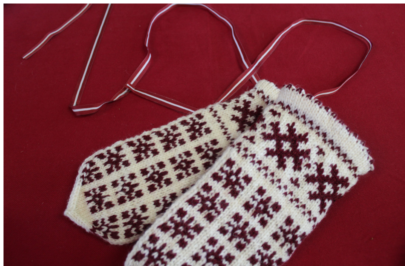
Latvietim cimdi ir ne tikai praktisks apģērba gabals, bet arī priekšmets ar dziļu simbolisku jēgu - tā saucamie dāvināmie cimdi

Baltā gaismā Latviju rotāsim Baltus ceļus un tekas staigāsim Dzīparos baltos viņu ievīsim.