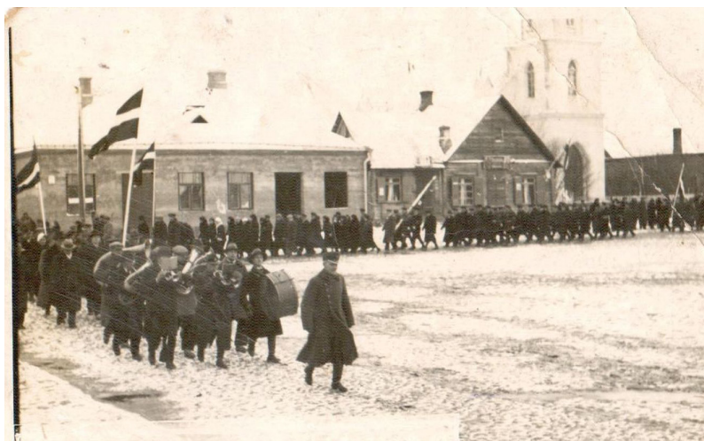
Parāde Ilūkstes pilsētas laukumā, 30-tie gadi