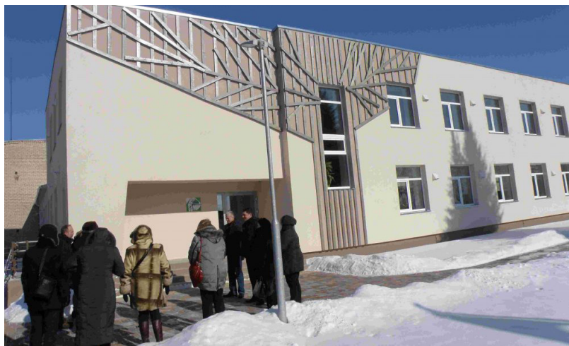
Nominācijā „Pārbūve” ir izvirzīta Dvietē izveidotā pansija „Mūsmājas „Dižkoks””. 27.februārī 14 ekspertu sastāvā komisija ieradās pansijā, lai klātienē kopā ar būvdarbu veicēju un pašvaldības pārstāvjiem novērtētu ēku

Skates „Gada labākā būve Latvijā 2017” žūrijas komisijas priekšsēdētājs, Latvijas Būvnieku asociācijas prezidents Normunds Grinbergs uzsver: „Priece lielais pieteikumu skaits no dažādiem Latvijas reģioniem. Kaut Latvijā pērn būvēts mazāk nekā 2016. gadā, kvalitāte ir ļoti augsta.” Latvijas Būvzinieņu savienības valdes priekšsēdētājs Mārtiņš Straume izēzi-