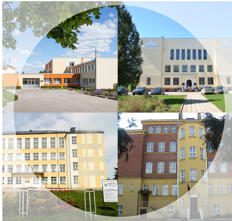
Lai saglabātu visas izglītības iestādes, notiks skolu reorganizācija tās apvienojot un izveidojot jaunu skolu “Ilūkstes Raiņa vidusskola”

Pašvaldībai, plānojot budžetu, gadu no gada izglītība ir bijusi prioritāte, tāpēc ar savu līdzfinansējumu skolas ir izdevies nosargāt. Arī šogad 44,69% no kopējā pašvaldības budžeta ir atvēlēti izglītībai. Šobrīd novadā darbojas pirmsskolas izglītības iestāde “Zvaniņš” (198 bērni) ar filiālēm Subatē un Bebrenē, trīs vidusskolas- Ilūkstes 1.vidusskola (270 skolēni), Ilūkstes Sadraudzības vidusskola (vispārīzgl.pr.-147 skolēni un neklātiesnes progr.- 51) un Bebrenes vispārīzglītojošā un profesionālā vidusskola (vispārīzgl.pr.- 92 skolēni un profesionālā progr.- 79), divas pamatskolas-Subates pamatskola (52 skolēni), Eglaines pamatskola (pirmsskolas izgl.pr.- 14 bērni un pamatizgl.pr.- 61 skolēns) un viena speciālās izglītības iestāde- Raudas internātpamatskola (31), divas izglītības iestādes ar profesionālo ievirzi-Ilūkstes mūzikas un mākslas skola un Ilūkstes novada Sporta skola, un viena interešu izglītības iestāde- Ilūkstes bērnu un jauniešu centrs. Esošās izglītības iestādes nodrošina iespēju novada skolē-