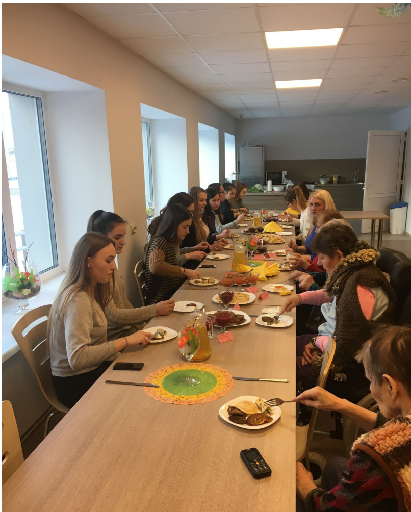
Pansijā regulāri viesojās ciemiņi, gan bērnudārza bērni, gan jaunieši ar saviem koncertiem un vienkārši daloties kopā būšanas priekā

Viena no vislielāko atsaucību guvušajām iniciatīvām ir regulāras tikšanās reizes ar novada jauniešiem. Šajā reizē, 21.februāra pēcpusdienā, Mūsmājas viesojās Ilūkstes 1. vidusskolas skolēni, kuri kopā ar senioriem, apgūstot jaunas receptes, kopā cepa dažādu veidu pankūkas un vienotās kopīgās dziesmās.