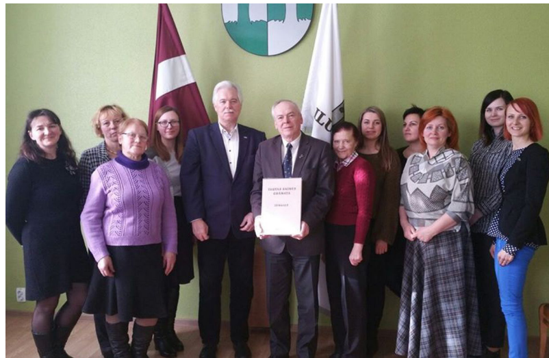
Aicinām uz “Tautas Saimes grāmatas” iedziedāšanas pasākumu, kas notiks 16.martā plkst.18.00 Ilūkstes Romas katoļu baznīcā

Esiet laipni gaidīti un aicināti Ilūkstes novada pagastu bibliotēkās martā un aprīlī. Ir sastādīts Grāmatas “viesošanās” laika plāns, pēc kura vadoties var sekot līdzi – kur Grāmata atrodas (skatīt tabulu). Šajos laikos (katrā bibliotēkā plānotas 3 darba dienas) iedzīvotājiem būs iespēja ierakstīt vēstījumu un vēlējumu Latvijas Simtgadē. Jāņem vērā vien tas, ka vēlams bibliotēkā ierasties jau ar sagatavotu melnrakstu, ko grāmatā pārakstīt. Šajā reizē var ņemt līdzi arī foto materiālus kā vēstures liecības. Aicinām pieteikties bibliotēkās jau laikus par savu daļību šajā iniciatīvā un ziņot, ja ir vēlme rakstīt, bet nav iespējams nokļūt bibliotēkā.