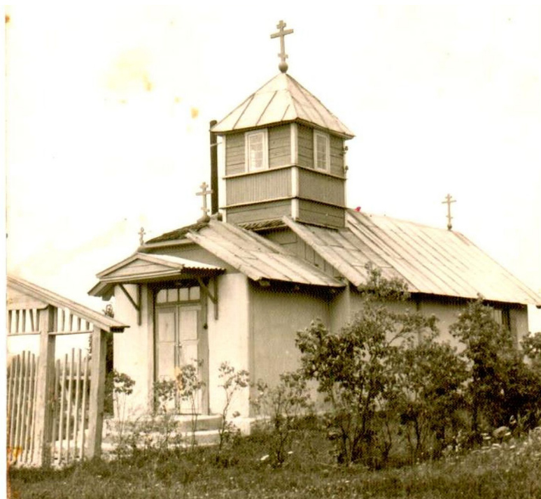
Ilūkstes vecticībnieku baznīca (celta 1845.gadā)

(1936.gada 5.jūnijā) svinīgi guldīja pamatakmēni lauksaimniecības skolai, kas pēc sava lieluma būs lielākā Latvijā. Jaunajam skolas namam būs trīs stāvi, kuros novietos mācības klases, internātu, izrīkojumu zāli un skolotāju dzīvokļus. Ēkas būve ilgs trīs gadus un izmaksās 160 000 ls. Pamatakmēns guldīšanas svinībās ieradās arī zemkopības ministrs J.Birznieks ar zemkopības departamenta direktoru Grāvi”(„Jaunākās Ziņas”, 06.06.1936)