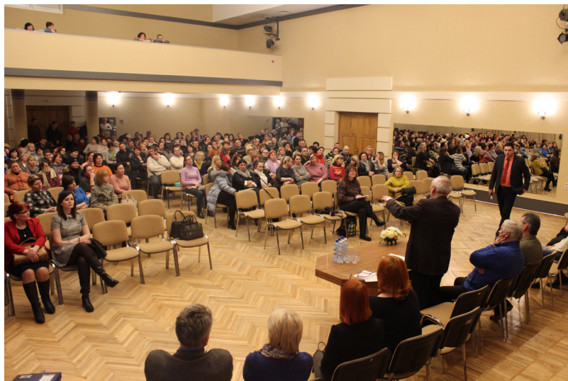
22.februārī Ilūkstes novada pašvaldības vadība un domes deputāti tikās ar skolu pārstāvjiem un vecākiem, lai iepazīstinātu ar esošo situāciju Ilūkstes novada izglītības sistēmā un kopīgi rastu labākos risinājumus

Valsts līmenī ir veikti daudzi pētījumi par izglītības kvalitāti, dažādām skolu problēmām, ļoti detalizēti ir izpētīts skolu tīkls un izstrādāti ieteikumi tā racionalizēšanai. Izglītības jomu regulējošie normatīvie akti ir spieduši pēdējos gados valstī reorganizēt un slēgt skolas, kas galvenokārt saistās ar nelielu izglītojamo skaitu, neracionālu telpu noslodzi, finanšu līdzekļu neefektīvu izlietojumu. Kopš 2009. gada Latvijā ir reorganizētas (apvienojot, pievienojot vai mainot īstenoto izglītības pakāpi) 213 izglītības iestādes (gan vispārīzglītojošās skolas, gan profesionālās ievirzes izglītības iestādes, gan pirmsskolas izglītības iestādes, gan internātskolas) un ir slēgtas 138 izglītības iestādes.