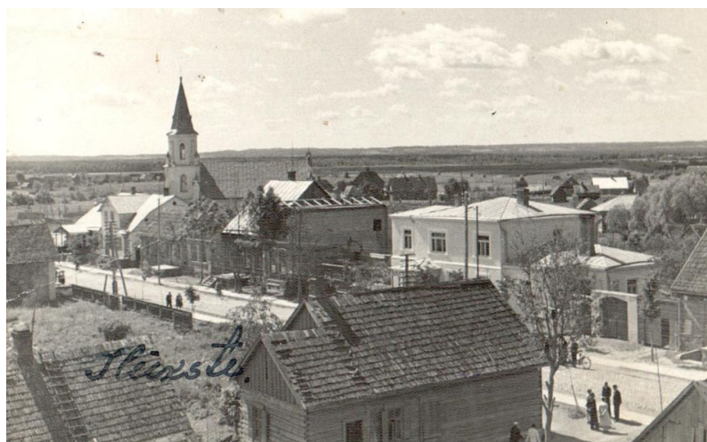
Ilūkstes pilsēta, 30-tie gadi