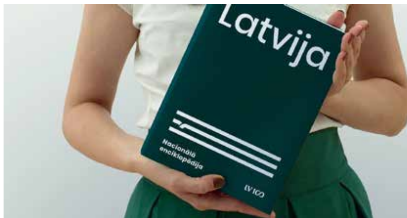
Nacionālās enciklopēdijas saturu veido dažādu nozaru ekspertu sagatavoti šķirkļi jeb enciklopēdijas raksti, kas satur koncentrētu un aprobētu informāciju ar noteiktu satura uzbūvi un apjomu. Sējums "Latvija" iekārtots tematiski un tas izceļ plašu faktoloģisko pārskatu par valsti pēc neatkarības atjaunošanas