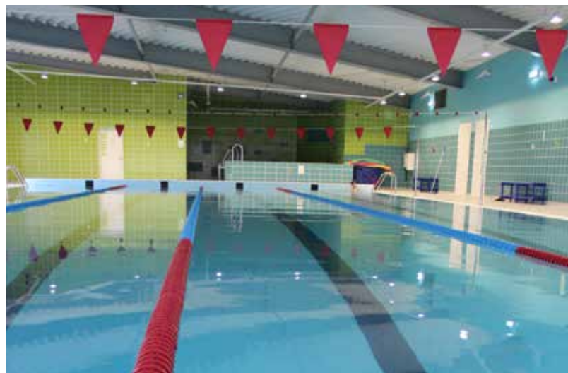
Ilūkstes novada Sporta skolas sporta centrā atkal ir iespēja apmeklēt baseinu, kā arī sportisko formu uzturēt trenāžieru zālē

Ilūkstes novada Sporta skolas Sporta centra administrācija