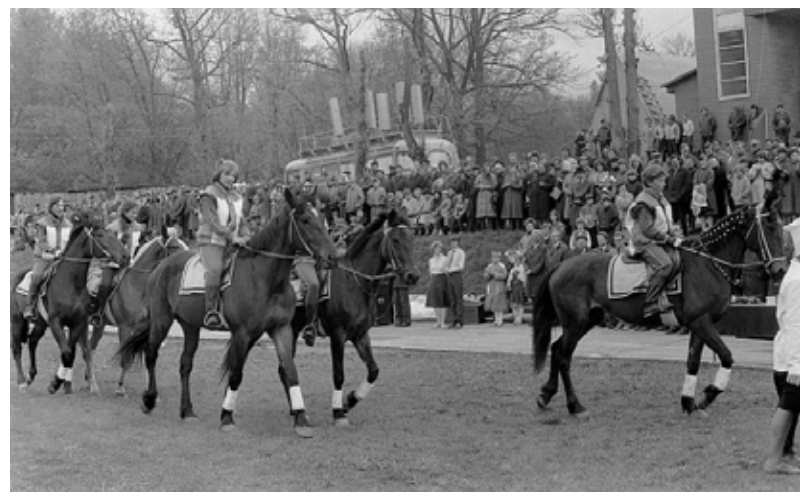
Republikas skolēnu ražošanas brigāžu – 1986.g. sociālistiskās sacensības uzvarētāju salidojuma „Mēs – tavi saimnieki, Zeme!” noslēguma parāde BST stadionā 1987.g. 17.maijā