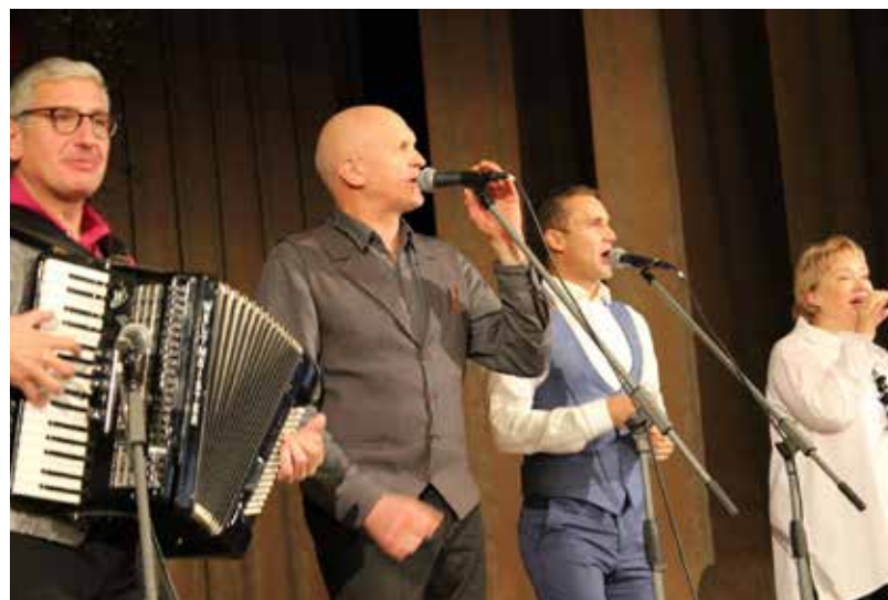
Turpinot vakaru svinīgā un pacilātā noskaņā visus klātesošos iepriecināja Latvijas Nacionālā teātra aktieru ansamblis "Greizais ratiņš"

Mūsos katrā gaismas ir pietiekami, lai mēs varam to iedegt arī savos līdzcīvēkos. Nevis salūts un bezpersonisks troksnis, bet uzmanīga saruna, saprotošs skatiens var kādam izglābt sirdi. Tā ir sirds sagaidīšana cilvēkā, kurš tev ir līdzās – darbavietā, teātrī, mājās, trolejbusā, veikalā, uz ielas, pastā. Tā ir līdzdarbošanās, nevis grūstīšanās. Salūts sirdī ir vissvarīgākā sagaidīšana. To novēlam ikvienam. Ar pacilātu garu veidosim pasauli!