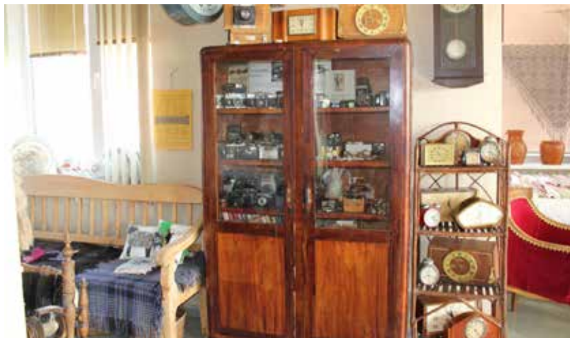
Ķerubinu ģimene uzdāvināja krātuvei savu stāstu ar vēstures liecību – senlaicīgu skapi

Ilūkstes Bērnu un jauniešu centra direktore