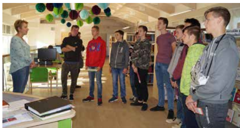
Karjeras nedēļas ietvaros Ilūkstes Raiņa vidusskolas un Bebreņu VP vidusskolas skolēniem bija iespēja piedalīties dažādos pasākumos Daugavpilī

9. oktobrī 8. – 10. klašu skolēniem tika piedāvāta iespēja apmeklēt pasākumu “Būvē savu karjeru pats!” Daugavpils Būvniecības tehnikumā, kur skolēni varēja stāstījumos un paraugdemonstrējumos iepazīt dažādas profesijas, kuras var apgūt tehnikumā un arī piedalīties piedāvātajās aktivitātēs. Skolēni dalījās savos ieguvumos: “Man ļoti patika, bija interesanti un labi viss izskaidrots. Ļoti patika, guvu plašu informāciju par profesijām, kuras var apgūt. Man radās interese par šo mācību iestādi. Vairāk uzzināju par interesējošo profesiju – ceļu būvtehnikas, autodiagnostikas.” Tajā pašā dienā citiem skolēniem tika piedāvāta mācību ekskursija uz “Park Hotel Latgola”, kur skolēni iepazinās ar viesmīlības nozarē strādājošu uzņēmumu, izzināja, kādu profesiju pārstāvji strādā uzņēmumā, kādas prasmes, zināšanas un iemaņas nepieciešamas viesmīlības jomā strādājošiem profesionāļiem, iepazīt uzņēmuma darba vidi. Skolēni pastāstīja: “Man ļoti patika viesnīcā, bija in-