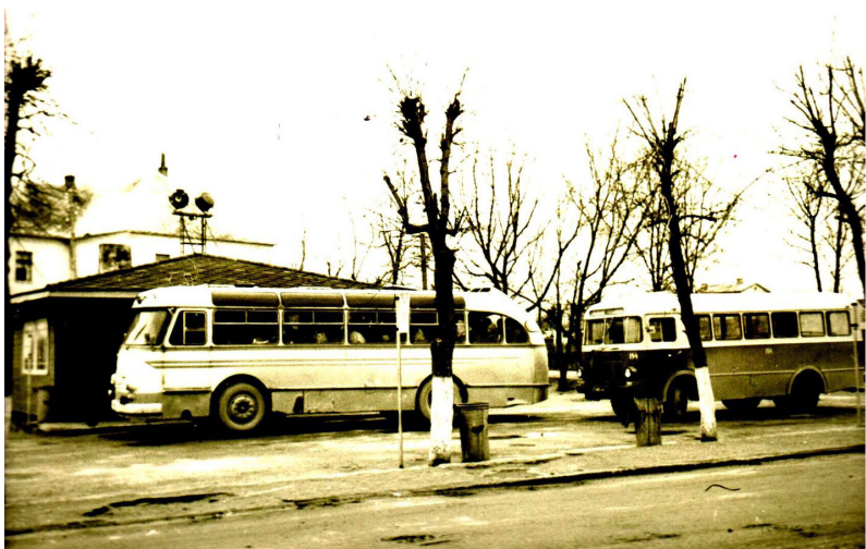
Ilūkstes autoosta, 1968.gads