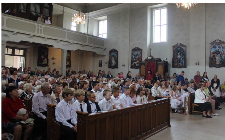
...ļaužu pilnā baznīcā