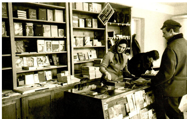
Grāmatu veikals Ilūkstē, 1975.gads