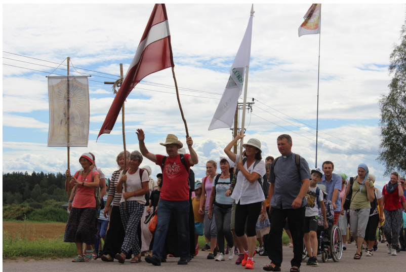
Augustā šosejas un lielceļus Aglonas virzienā papildīja svētceļnieku grupas, uzsverot, ka visspēcīgāko pārdzīvojumu dod tieši pats ceļš

Augustā aizvien vairāk ticīgo devās ceļā uz Aglonu, lai piedalītos Dievmātes Debesīs uzņemšanas svētkos, kas ik gadu 15. augustā Aglonā pulcina tūkstošiem ļaužu. 100 dienu lūgšanā, jau maijā, devās arī akcijas „100 dienas lūgšanā par Latviju” svētceļnieki, kurus Ilūkstē sagaidījām 7. augustā.