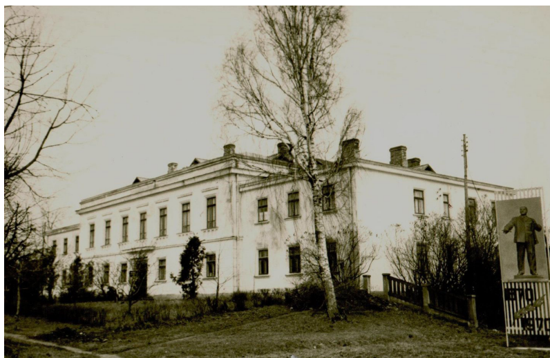
Veikals Ilūkstē, 70-tie gadi