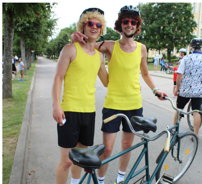
...un, protams, kur gan bez atraktivitātes!