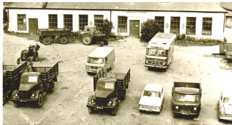
Mēbeļu cehs pie upes Ilūkstē, 70-tie gadi