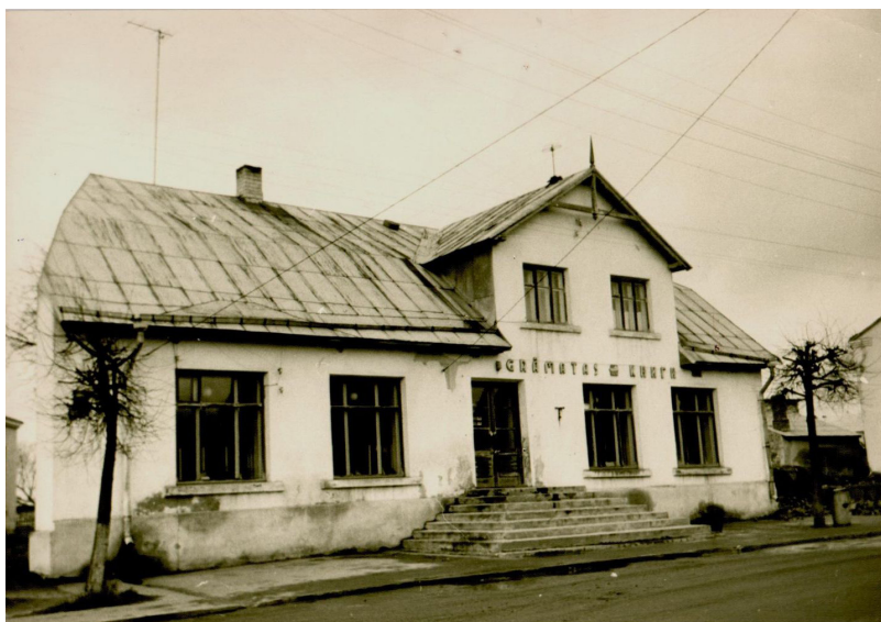
Grāmatu veikals Ilūkstē, 60-tie gadi