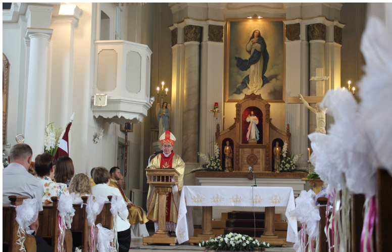
Svinīgi un pacilāti uzsākām Jauno mācību gadu!