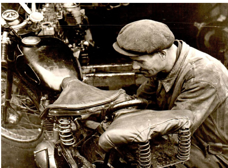
Remontdarbnīca Ilūkstē, 60-tie gadi