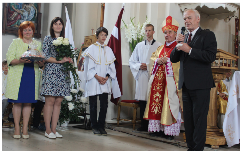
Ieklausījāmie stiprinājuma vārdos