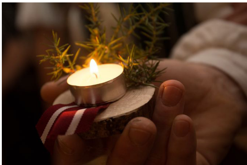
Rakstiskus vai elektroniskus ierosinājumus aicinām iesniegt līdz 17. septembrim

100 gadu takās vijas Latvijas ceļš, kurā mēs katrs minam savus soļus, un mūsu sirdis un darbi ir Latvijā... Svinot Latvijas simtgadi, Ilūkstes novada pašvaldība vēlas izteikt pateicību tiem novada ļaudīm, kuri dziļā ticībā Latvijas nākotnei snieguši neatsveramu ieguldījumu valsts pastāvēšanā un veidošanā, kuri bijuši klātesoši neatkarīgās Latvijas atjaunošanas procesos, kuru drosme un patriotiskā stāja pauž dziļu mīlestību valstij un kuru ieguldījums veicinājis Latvijas un Ilūkstes novada attīstību. Lai apzinātu šādus cilvēkus, pašvaldība aicina iedzīvotāju grupas vai organizācijas, biedrības un citus dibinājumus ne mazāk kā piecu cilvēku sastāvā iesniegt motivētus ierosinājumus apbalvošanai ar pašvaldības Atzinības rakstu. Ierosinājumus ir tiesīgi iesniegt arī novada pašvaldības iestāžu un struktūrvienību vadītāji, pašvaldības izpilddirektors, domes deputāti.