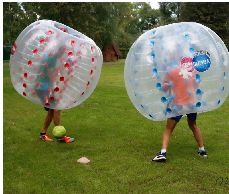
Īpašu sajūsmu izpelnījās burbulfutbols, kur labāko rezultātu uzrādīja Neretas novads, otro vietu ieguva Ilūkstes novads, trešo vietu - Jēkabpils novads