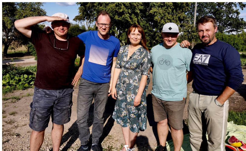
Turpinām mūsu iesākto ceļu - neatkarotomas dabas gleznas, melnais māls, brokoļi, arbūzi un derības par cirvja mešanu. Piedzīvojumi turpinās...