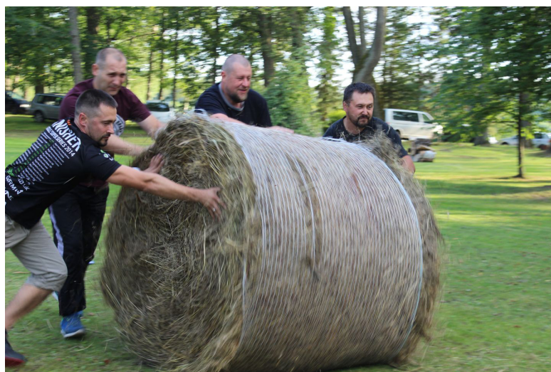
Sporta svētkos valdīja īsts sacensības gars!