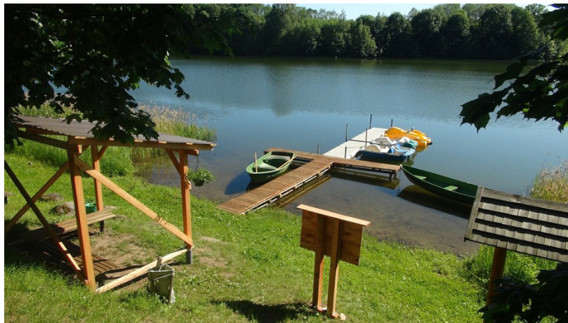
Interesentu grupai Subatē tiek piedāvātas vairākas pilsētas apskates ekskursijas: ekskursijas kājām gājienā "Subate laiku lokos" un "Sēlijas sala", ekskursija ar laivām "Subates ūdens ceļš"

Informācijas avots Sociālo tīklu www.facebook.com lapa "Latvijas garša"