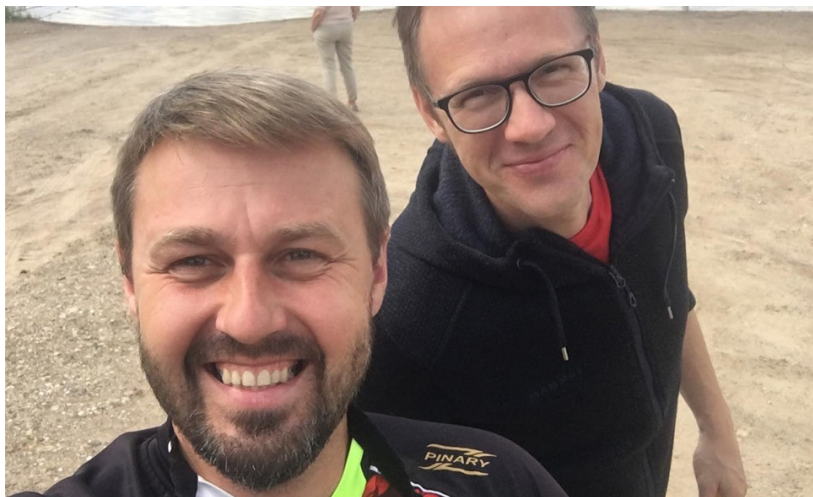
Esam starta azartā! Sākums jaunam projektam un pirmā filmēšanas diena! "Nezināmā Sēlija"

Jūlija vidū filmas veidotāju devās ceļojumā, lai iepazītu Sēliju. Sociālajos tīklos, publicējot fotogrāfijas, filmas veidotāji pauž pārsteigumu un prieku par redzēto. Piedāvājam nelielu ieskatu viņu publicētajos viedokļos un fotogrāfijās, savukārt darbu pie filmas komanda plāno pabeigt līdz gada beigām.