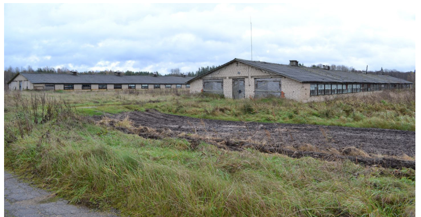
Projekta ietvaros Ilūkstes novada pašvaldība plāno Ilūkstes pilsētas bijušās "Putnu fermas" teritoriju attīstīt par ražošanas zonu

Ilūkstes novada pašvaldības izglītības nodaļas vadītāja Iļona Linarde