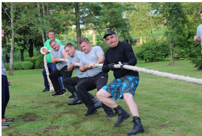
Skatītāju visskaļāk atbalstītā disciplīna bija virves vilkšana. Te emocijas sīta augstu vilni!