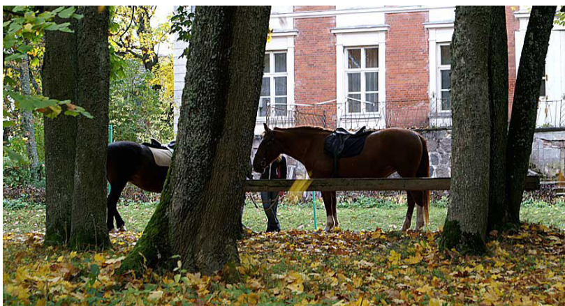
Bebrenes muižas ansamblis ir viens no nedaudzajiem Sēlijā, kurā pilnībā ir saglabājušies visi 19. gs. Bebrene muižas apbūves elementi