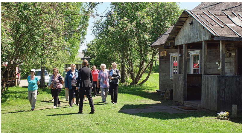
Putnu salā ir izveidots Dvietes senlejas informācijas centrs "Gulbji", kur ikviens var izjust un iepazīt seno sēļu sētu - klēti un visas ar to saistītas senās ieražas - graudu apstrādes process, mantu glabāšanas nozīme, meitu tradīcijas klēti, zvejas rīkus un zvejas paražas, kā arī sniegt iespēju nakšņot sēļu sētā