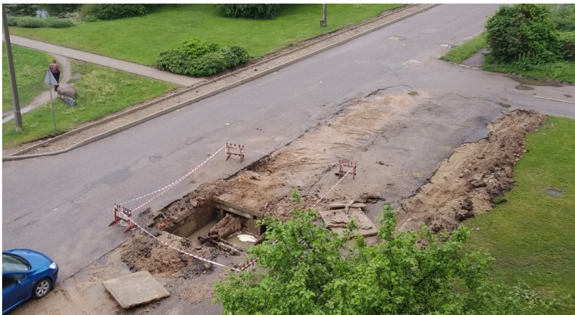
Ilūkstes pilsētā norisinās remontdarbi Jēkabpils ielā, kur ielas posmam brauktuves daļa un trotuārs tiks atjaunots ar jaunu asfaltbetona segumu

Eiropas Savienības Eiropas Lauksaimniecības fonda lauku attīstībai (ELFLA) finansētā projekta "Ilūkstes novada ceļu infrastruktūras kvalitātes uzlabošana" Latvijas Lauku attīstības programmas 2014.-2020.gadam