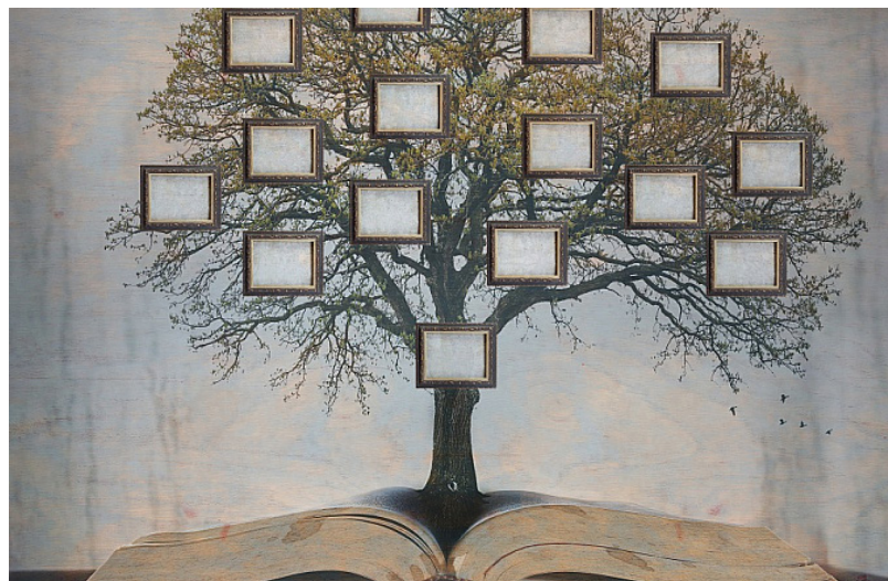
Ģimenes un dzimtas visā Latvijā aicinām iesūtīt projektam "Bibliotēka" savu dzimtas stāstu un aprakstu par grāmatu, kas ģimenei ir īpaši nozīmīga, līdz šī gada 31. augustam