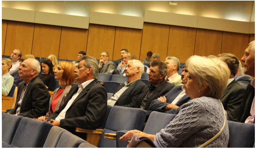
Pretēji iepriekš solītajam, ka saistībā ar plānoto administratīvi teritoriālo reformu (ATR) Vides aizsardzības un reģionālā attīstības ministrija (VARAM) viesosies katrā no 119 pašvaldībām, ministrijas pārstāvji deva priekšroku sapulces organizēt vien 30 vietās. 2.augustā Daugavpilī notika noslēdzošā diskusija, kurā piedalījās VARAM pārstāvji un Ilūkstes, Daugavpils novadu un Daugavpils pilsētas deputāti

VARAM šīs sapulces ir saukusi par konsultācijām, bet būtībā prezentē savu redzējumu un pasīvi ieklausās esošo novadu viedokļos. Jāatzīmē, ka VARAM savā informatīvajā ziņojumā sniedz neprecīzus datus, kā arī daudzos medijos reģionālās vizītes tiek atspoguļotas pavirši un pretrunīgi, piemēram, par sapulci Daugavpilī, interneta portāls www.gorod.lv raksta: „Sapulce notika 2,5 stundas, neviens šajā laikā, saistībā ar gaidāmo re-