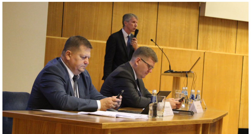
VARAM prāt ir normāli aizmirst par mūsu tautas pamatvērtībām – senčiem, no kuriem esam cēlušies, mūsu kultūru, šīm mazajām kopām, kas veidojuši tautas pamatus. Varbūt turpmāk vairs nesvinēsīm Dziesmu un deju svētkus, jo tas nav ekonomiski izdevīgi?

formu, izņemot ministru, neizteicās.” Ko no tā varam secināt?- diemžēl, sabiedrība turpina saņemt maldinošu informāciju.