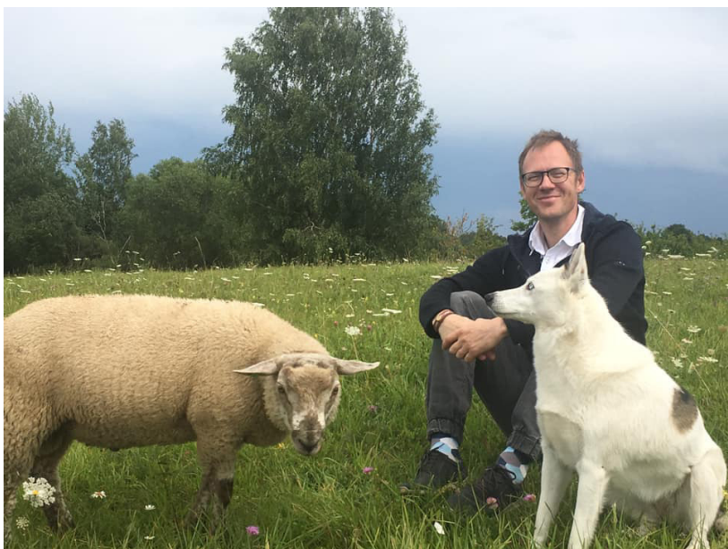
Dienas garas, ceļi slikti, cilvēki stipri un azartiski. Ne tikai nezināma, daudzu neatklāta Latvijas daļa - Sēlija! Trešā filmēšanas diena, "Nezināmā Sēlija"