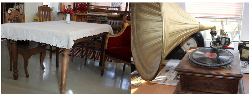
Pētersonu dzimtas relikvijas - galds un patafons, kas aizvien vēl skan! Nodeva Hendriks Pētersons