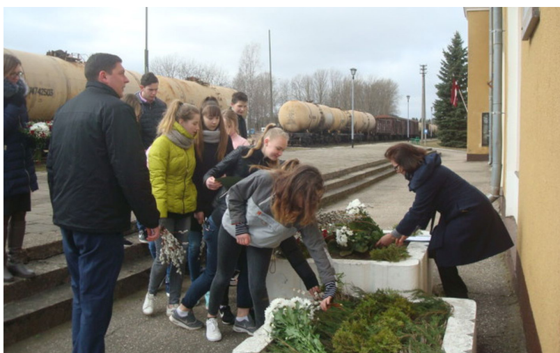
Eglaines dzelzceļa stacija 25. marta 1949.gadā kļuva par bēdu un asaru apzīmogotu vietu...