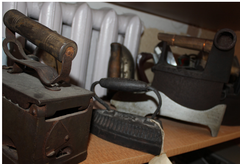
Kolekcijā ir 15 gludekļi un interesanti, ka pats smagākais ir pats mazākais