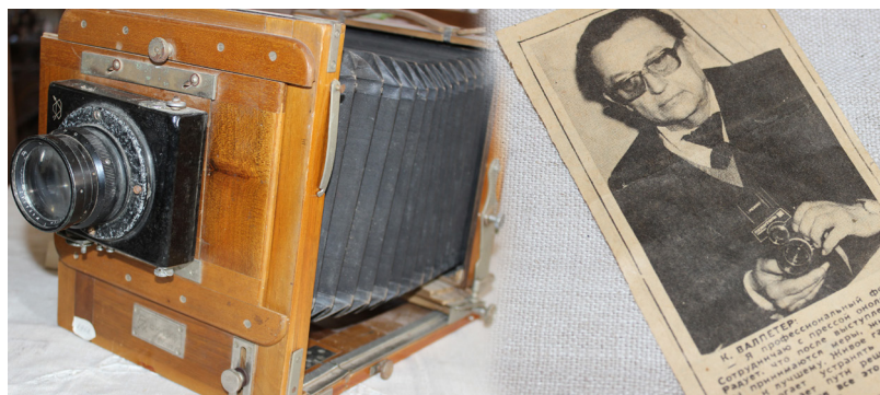
Kazimirs Valpēters Ilūkstē bija pazīstams fotogrāfs, "Sēļu istabā" aplūkojams viņa fotoaparāts, ko glabāšanā nodeva fotogrāfa ģimene