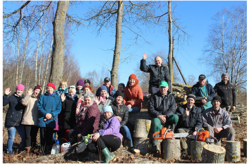
22.aprīlī Ilūkstes novada pašvaldības darbinieki pulcējās Subatē, lai sakoptu teritoriju Ilūkstes ielas galā

Dodoties talkot, noteikti ņemsim līdzi savus ģimenes locekļus, draugus, radus, darba kolēģus, kaimiņus un, pats svarīgākais – darba prieku! Talciniekus lūdzam izvēlēties laikapstākļiem atbilstošu apģērbu un ņemt līdzi darba cimdus.