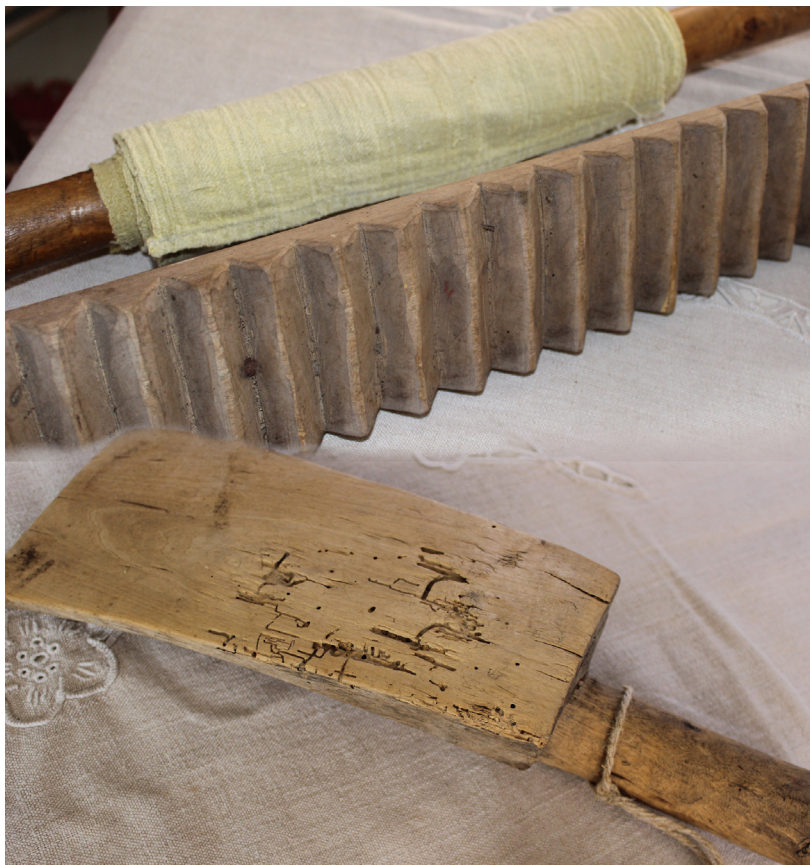
Kad "Sēļu istabā" viesojās ekskursantu grupas, viena no aktivitātēm ir atrast tos priekšmetus, kas kalpoja kā pirmā veļas mašīna (attēla apakšā) un atrast, kurš tad bija pirmais gludeklis (attēla augšā).