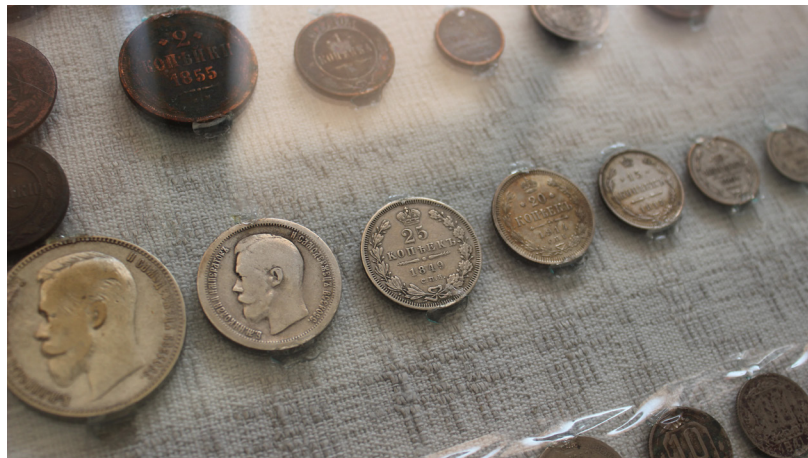
Cara Nikolaja laika monētas visās nominācijās no Bebrenes (Jāņa Bogdanova dāvinājums)