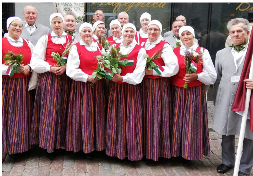
Ilūkstes novada vecākās paaudzes deju kolektīvs "Ozolzīles" atzīmēja savas darbības jubileju