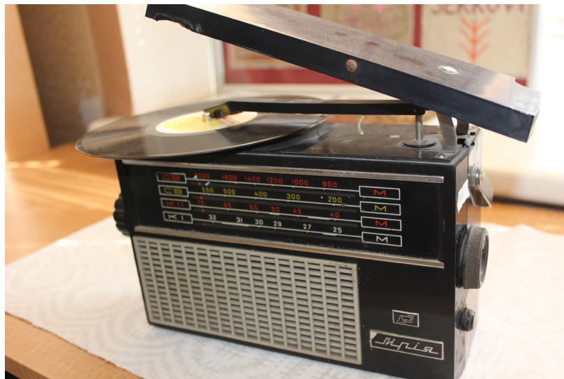
"Sēļu istabā" ir plaša radio kolekcija, šobrīd apskatei izlikti retākie un interesantākie radio aparāti