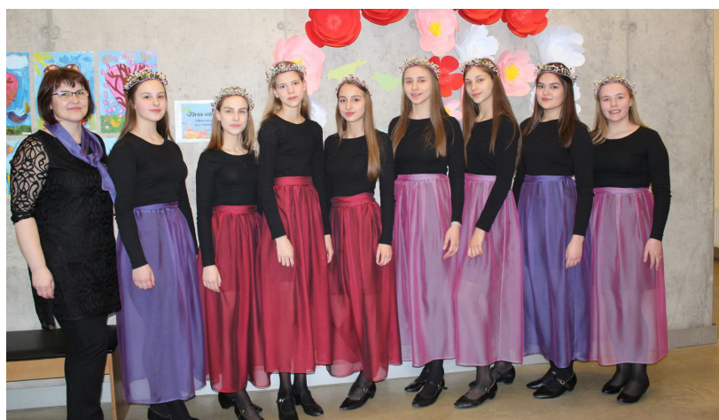
Paldies skolotājai un meitenēm par izcilo sniegumu un iegūto 1. pakāpes diplomu!