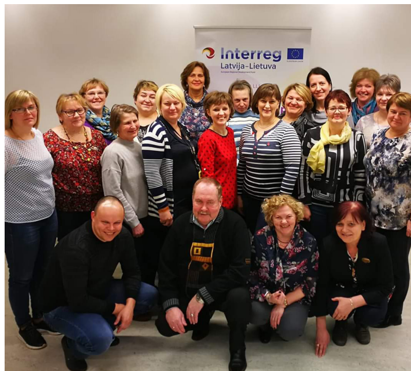
Projekta ietvaros, Rēzeknē un Daugavpilī notika 4 dienu mācības “Geriatrrijas pamati” un “Gados vecāku cilvēku veselības problēmas un pašpalīdzības pasākumi” sociālajiem darbiniekiem un mobilo brigāžu speciālistiem, kurās piedalījās arī Ilūkstes novada pašvaldības sociālās jomas darbinieki

Ilūkstes novada pašvaldība kopā ar sešiem Latvijas un Lietuvas partneriem (Eiropas reģiona “Ezeru zeme” Latvijas birojs, Rēzeknes pilsētas dome, Rēzeknes novada pašvaldība, Daugavpils novada pašvaldība, Utenas rajona pašvaldības administrācija un Moletu rajona pašvaldības ad-