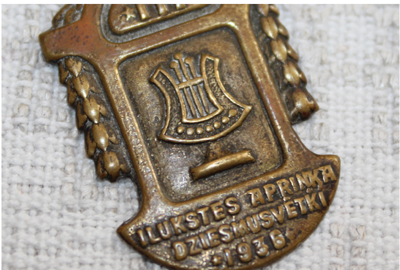
Medaļu, nozīmīšu, naudas skapī ir rodamas šādas skaistas vēstures liecības...