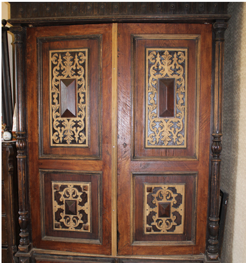
“Sēļu istabas” ieceres aizsākums rodams skapī. Jā, jā skapīt! Tā bija pirmā lieta, kas uzvedināja domu realizēt ieceri par istabas izveidi. Greznais koka skapis atceļojies no Raudas ciema