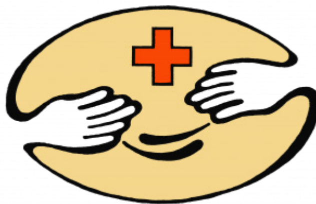
Projekta laikā, no 2019.gada 1.marta līdz 20.decembrim, sadarbībā ar Bebrenes pagasta senioru kluba “Sidrabrasa” kopām un biedrību “Sēlene” tiks noorganizētas radošās darbnīcas sadzīves prasmju un iemaņu attīstīšanai rokdarbos un ēdienu gatavošanā mērķgrupas dalībniekiem Ilūkstes un Daugavpils novadu sociālās aprūpes iestādēs Dvietē, Ilūkstē, Raudā, Subatē, Kalupē, Medumos un Višķos

Pirmās radošās darbnīcas notika 19.martā Dvietes pansionāta „Mūsmājas Dižkoks”, kuru laikā pansionāta iemītnieki apgleznoja zīda kabatlakatiņus un veidoja sviesta mīklas bumbiņas. Bebrenes senioru kopu „Varavīksne”, „Mare” un biedrības „Sēlene” dalībnieki ir patiesi gandarīti par paveikto. Paldies pansionāta „Mūsmājas Dižkoks” darbiniekiem par labvēlīgo sadarbības vidi, kas nodrošināja veiksmīgu jaunu prasmju un iemaņu apgūšanu pansionāta iemītniekiem.