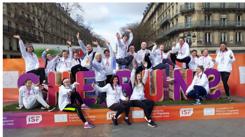
Projekta mērķis ir pievērst lielāku uzmanību meiteņu iesaistīšanai sporta aktivitātēs un regulārās nodarbībās. Tas ir šī brīža lielākais ISF projekts, kas veltīts meitenēm

Gatavojoties sacensībām, „She runs” dalībnieces dzīvoja īpaši iekārtotā „pilsētiņā”, kur bija iespēja iesaistīties dažādās sportiskās aktivitātēs: izmēģināt spējas boksā, šaušanā, nodarboties ar jogu, stepa aerobiku, skrituļslidošanu, airēt ar trenāžieri, lēkt dubultajās lecamauklās un ar ritenbraukšanas enerģiju pagatavot sev smūtiju. Ļoti liela interese bija par Chill out zonu un deju grīdu, kur vēlāk notika projekta dalībniecēm veltīts koncerts. Meitenes piedalījās arī konferencē, kurā bija iespēja tikties ar