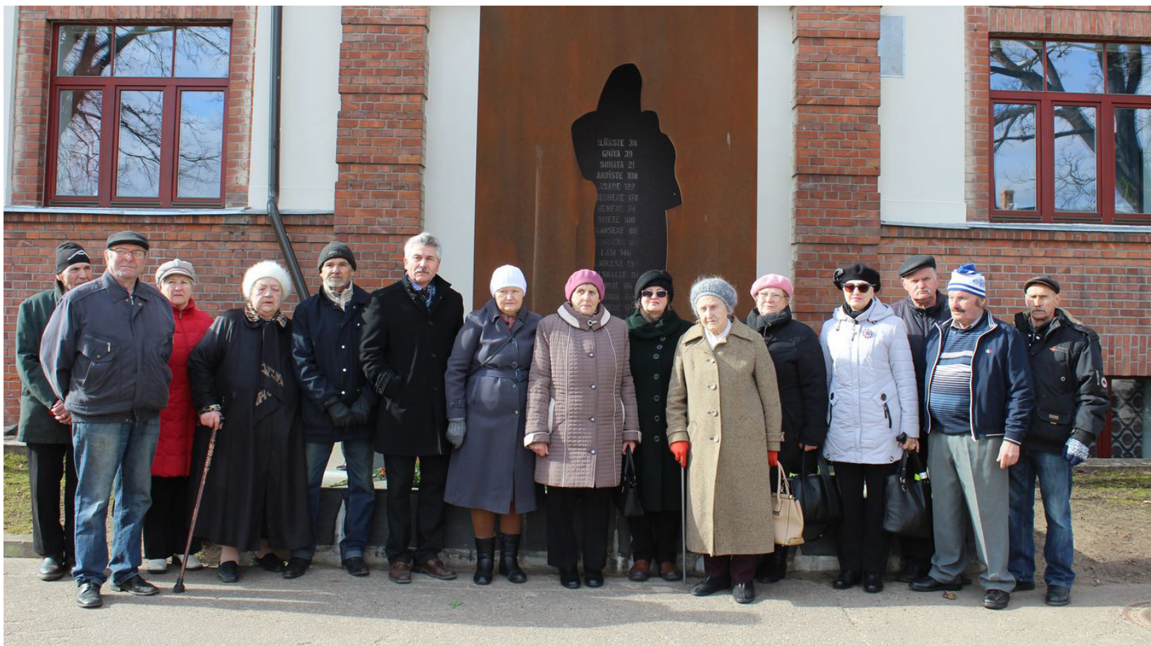
Spēcīgā pārdzīvojumā dēļ, 25. marts kļuvis par vienu no latviešu vēsturiskās apziņas stūrakmeņiem. Tautas vēstures atmiņa vienmēr būs dzīva...